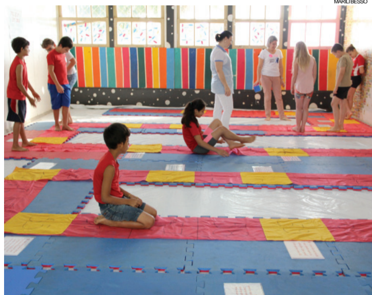
Alunos promovem a caminhada pelos hábitos saudáveis

Já a dentista declara que os dentes, quando bem tratados, podem permanecer em funcionamento por toda a vida, já que as próteses não funcionam como dentes naturais, o que reforça a necessidade de ações preventivas, desde a infância. "Por sua vez, as doenças infecciosas bucais podem se converter em uma fonte de disseminação de micro-organismos patogênicos ou de seus produtos para outras regiões do corpo, resultando em dor, sofrimento, perda de produtividade no trabalho e na escola", alerta a profissional.