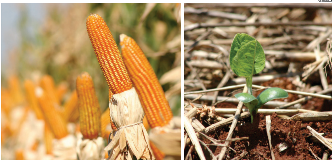
Cadeias produtivas serão destaques na exposição deste ano