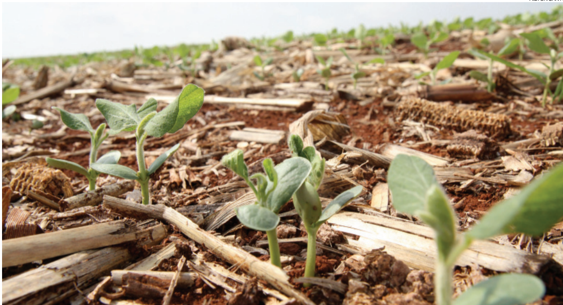
Plantas começam a emergir do solo