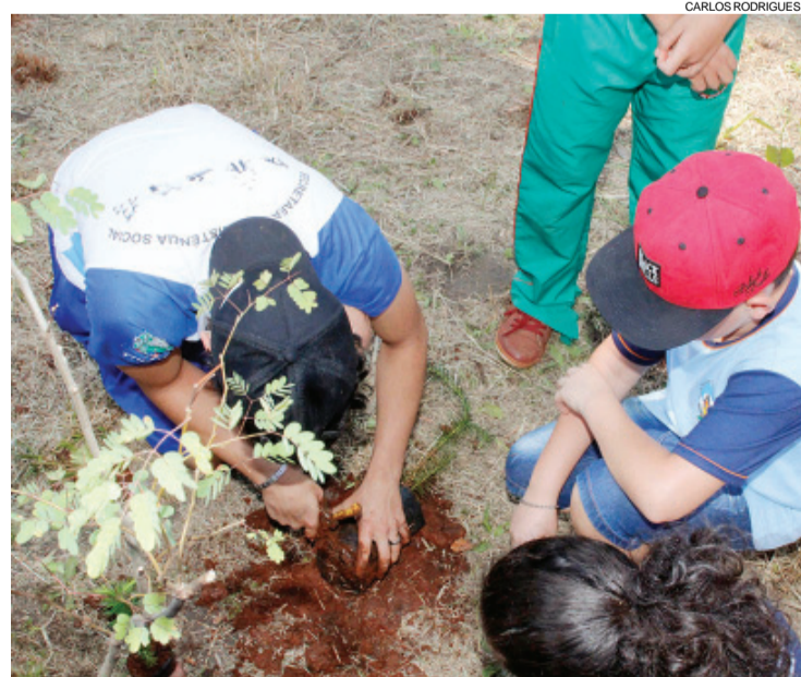
Crianças puseram a mão na terra para dar vida a novas árvores