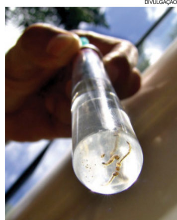
Objetivo é verificar se novo produto consegue matar os ovos

armadilhas em novembro e dezembro para coletar os ovos e depois serão remetidos para a Fiocruz, no Rio de Janeiro, para fazer testes com esses mosquitos que vão eclodir”, explicou.