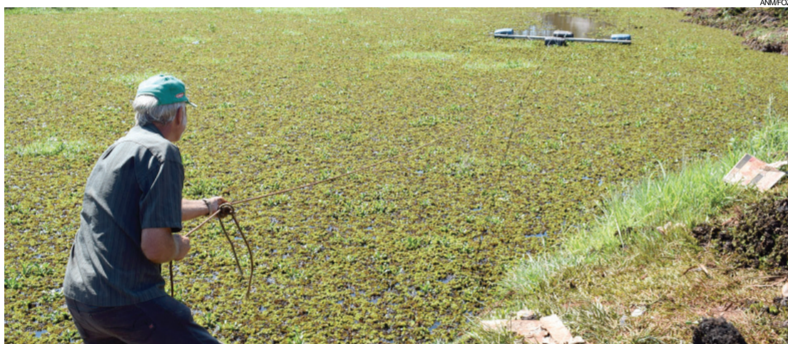
São usados retroescavadeira, barco e uma ferramenta desenvolvida por voluntários para retirar os aguapés