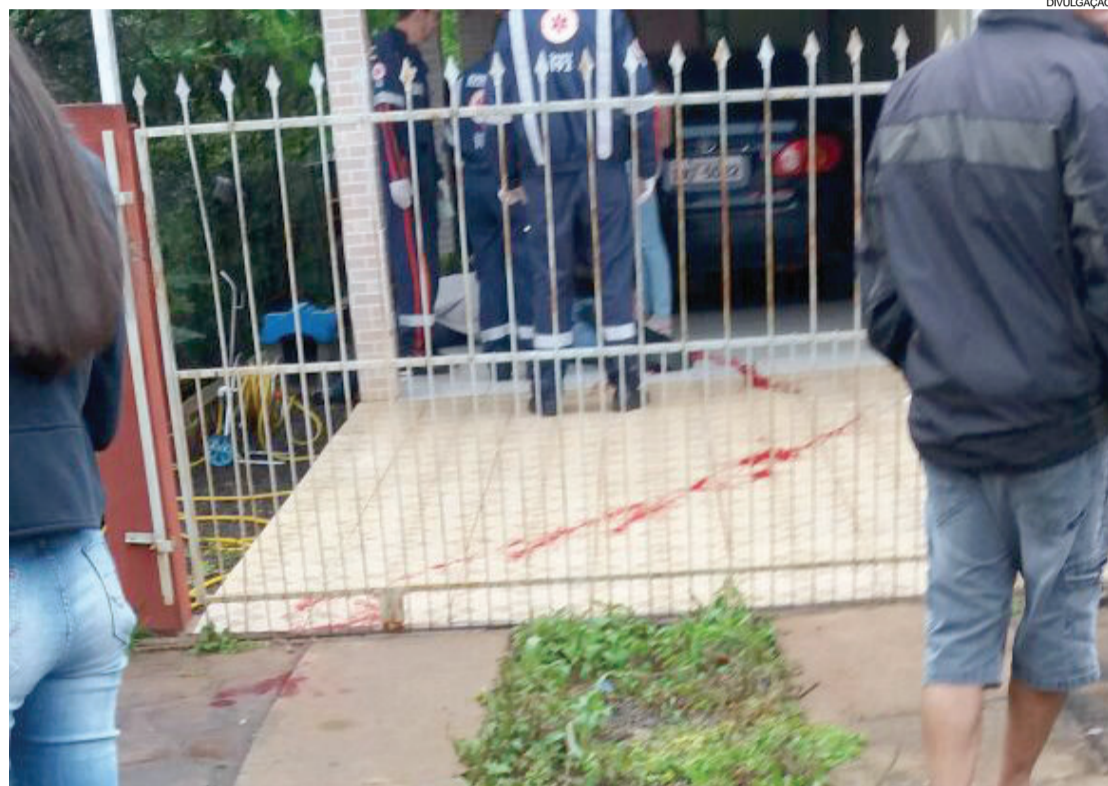
Jair Andrade já havia sofrido um atentado no início do ano na cidade

Jair foi atingido por cerca de 20 disparos de arma de fogo. Cápsulas de diversos