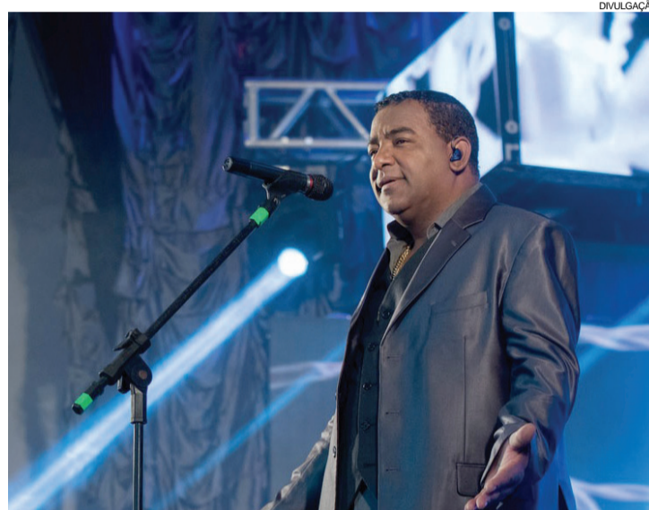
O Grupo Raça Negra se apresenta no primeiro dia da Expo Palotina

18h - Abertura dos Restaurantes e Lanchonetes 18h - Abertura da Exposição de Animais, Indústria, Comércio, Serviços e Cultura 19h30 - Abertura do Palco Cultural Palotina 21h - Arena de Rodeio - Solenidade Oficial de Abertura da Expo Palotina 2017 e Rodeio 22h30 - Fechamento dos Stands 23h - Tenda de Shows: Show com Raça Negra + DJ (ingresso pago)