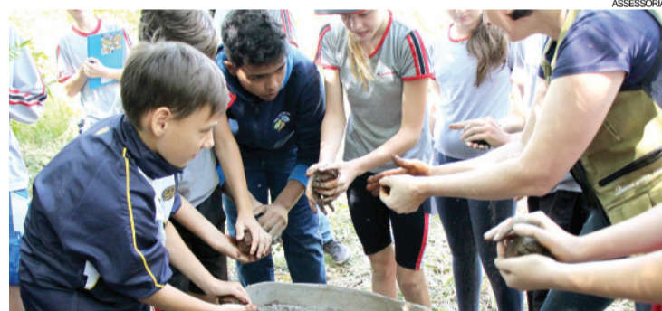
Alunos auxiliam na recuperação de nascentes em mais uma ação do Programa Encontros e Caminhos

Além da recuperação de nascentes, também foi realizado o plantio de mudas de árvores nativas. “A atividade se transformou em uma sala de aula fora do ambiente comum, que proporcionou aprendizado prático a partir da participação nas etapas e dos questionamentos feitos pelos alunos no decorrer do trabalho. Isso contribui para conscientizá-los da importân-