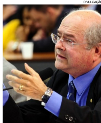
Deputado alerta para perdas que podem chegar a R$ 10 bilhões em um ano