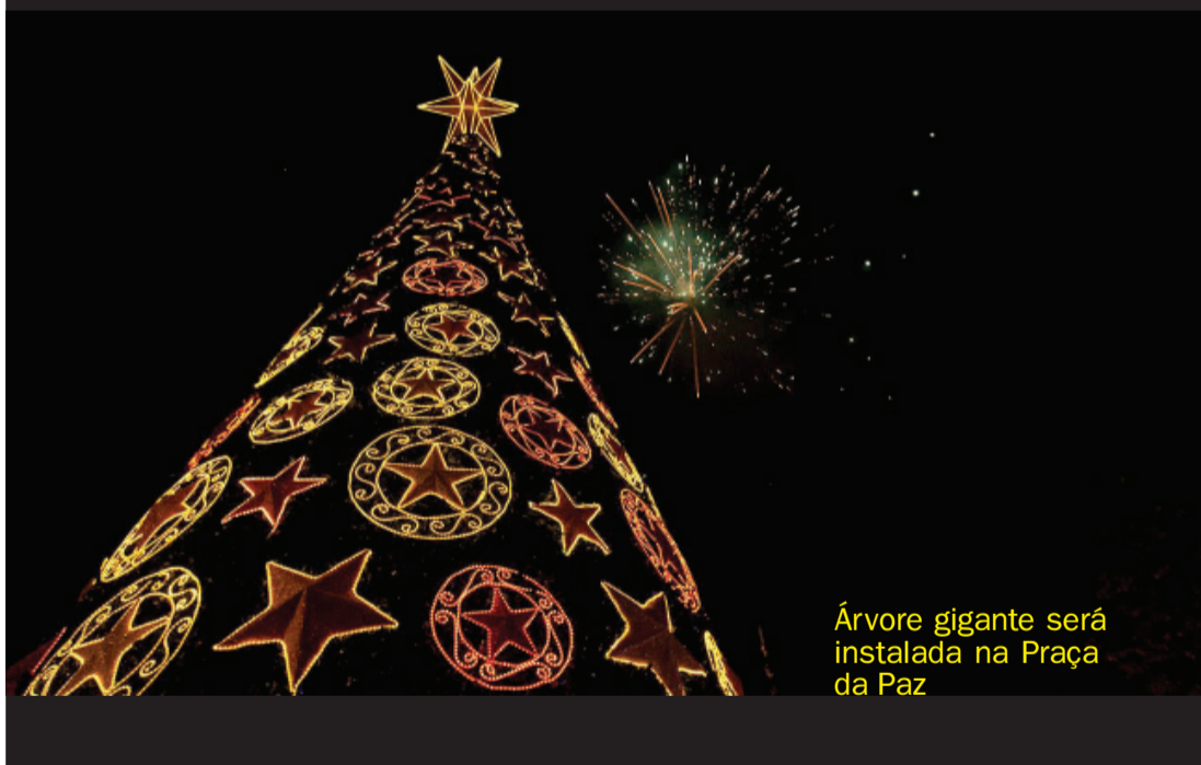
Árvore gigante será instalada na Praça da Paz

A abertura do Natal será no dia 30 de novembro, na Praça da Paz, onde o Papai Noel chega com o espetáculo da Companhia Arte & Manha, de Guarapuava. A programação segue até 22 de dezembro. Às terças, quartas, quintas e sextas-feiras haverá apresentações na Praça da Paz; aos sábados e domingos, no Gramadão.