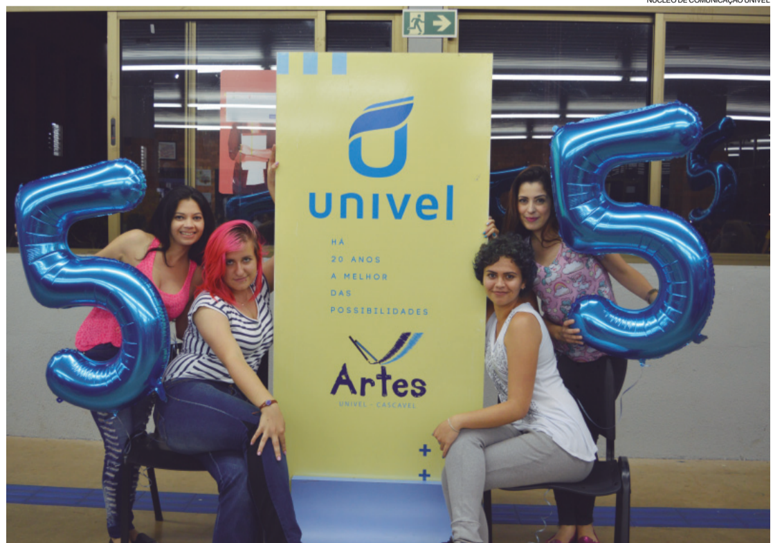
Acadêmicas do Curso de Artes da Univel comemoram o conceito máximo em avaliação do MEC (Ministério de Educação e Cultura)