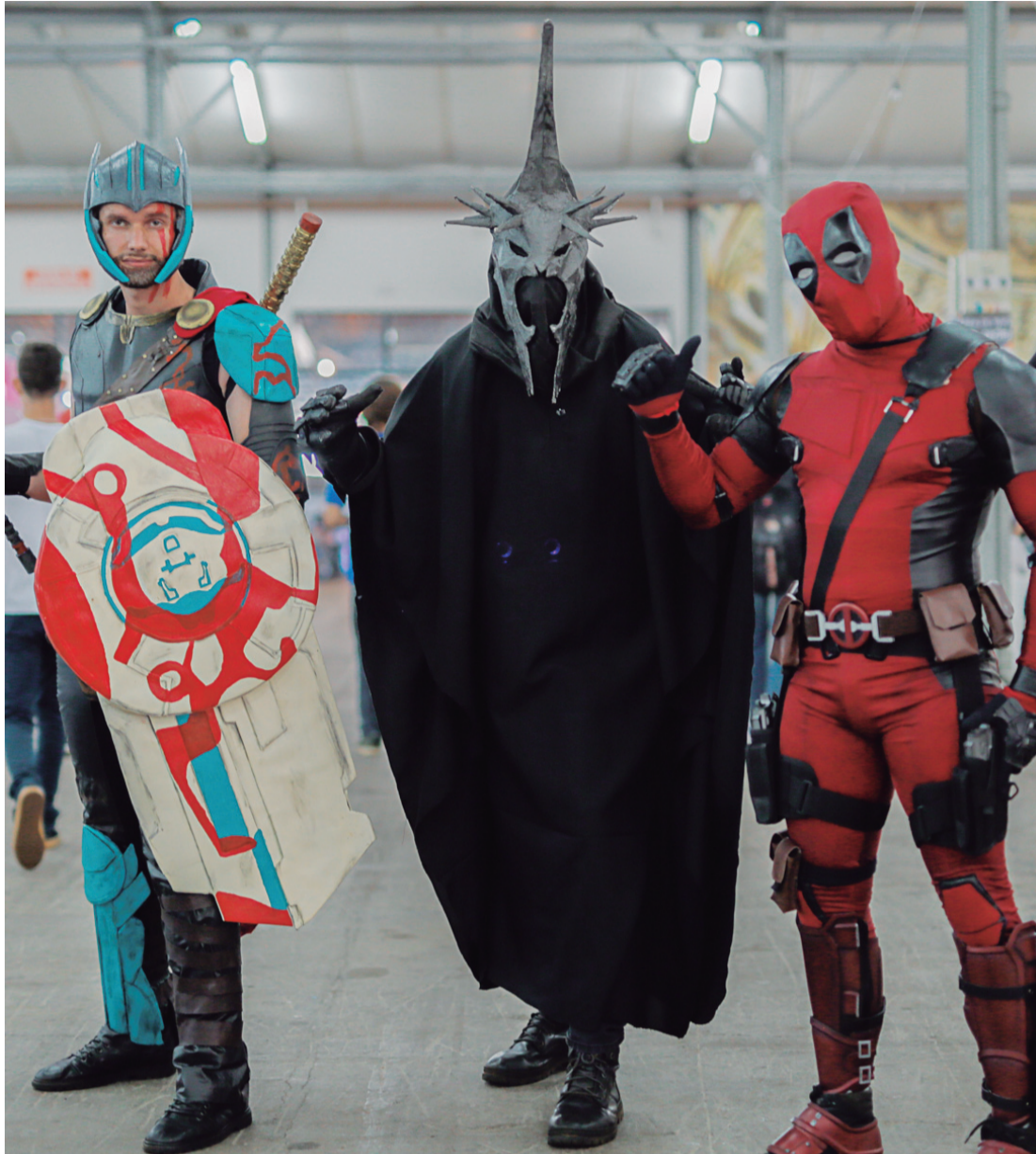
Personagens que fizeram parte do mundo GeekUP, evento que reuniu um público antenado em jogos, tecnologia entre outras atrações no Centro de Convenções de Cascavel