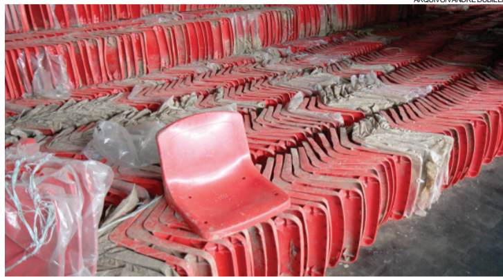
Cadeiras usadas não couberam no espaço em que deveriam ser usadas

Sem contar que na área descoberta da arquibancada o espaço é apertado e, se as cadeiras fossem colocadas, não haveria aprovação do Corpo de Bombeiros. A alternativa