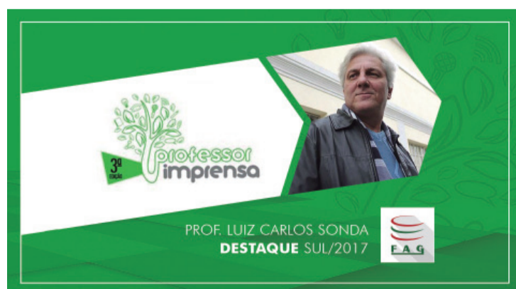
Sonda obteve 32% dos votos

coordenador da TV FAG. Ele comanda uma equipe que conta com seis estagiários e cinco funcionários e, que, entre as diversas produções, coloca no ar, de segunda sexta-feira, o Universo FAG. O projeto é um telejornal transmitido ao vivo, com duração de 10 minutos, e funciona como o diário do câmpus, com reportagens e entrevistas sobre as atividades dos cursos feitas pelos próprios acadêmicos. “Todo trabalho que você faz, se é bem feito, ele é percebido, ganha destaque. A fórmula que nós usamos aqui é inédita: ao vivo feito pelos próprios acadêmicos, transmitido