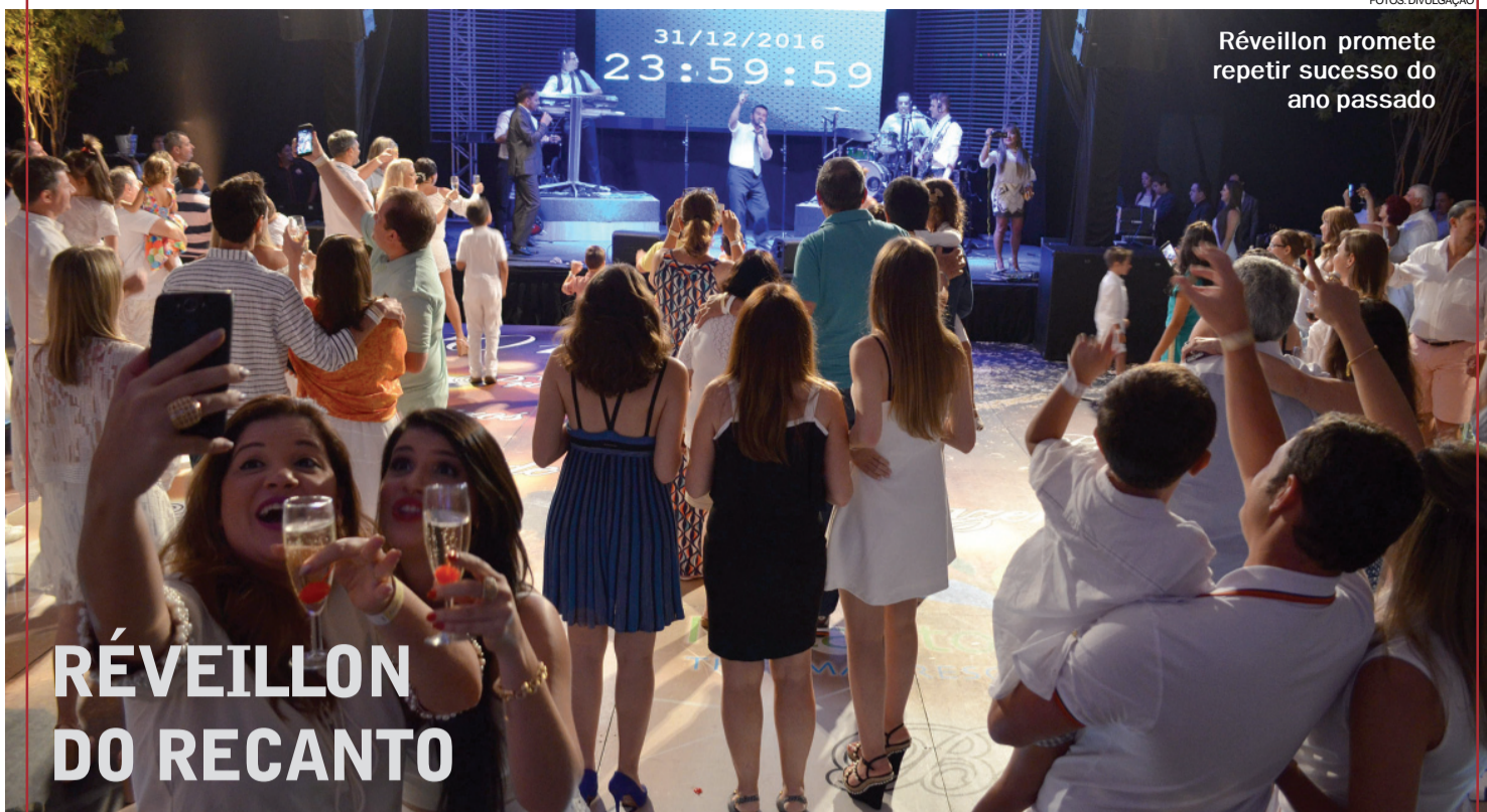
Réveillon promete repetir sucesso do ano passado