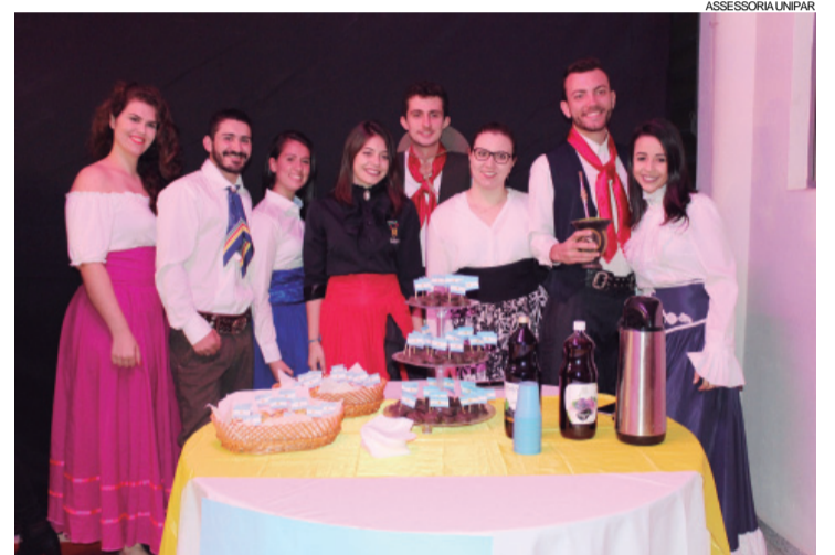
Argentina foi um dos países em destaque no trabalho 'Uma noite na América Latina' proposto aos acadêmicos de Arquitetura e Urbanismo da Unipar em Cascavel