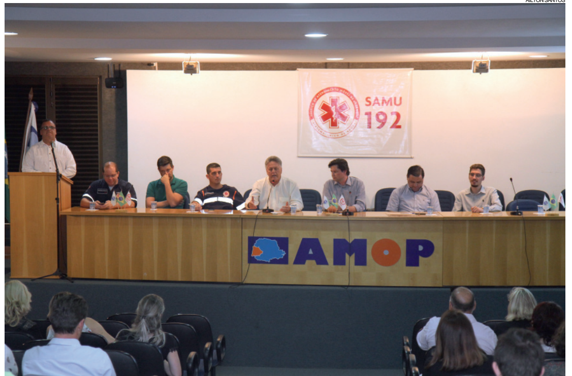
Assunto foi discutido durante apresentação do Consórcio aos Municípios na reunião da Amop, ontem