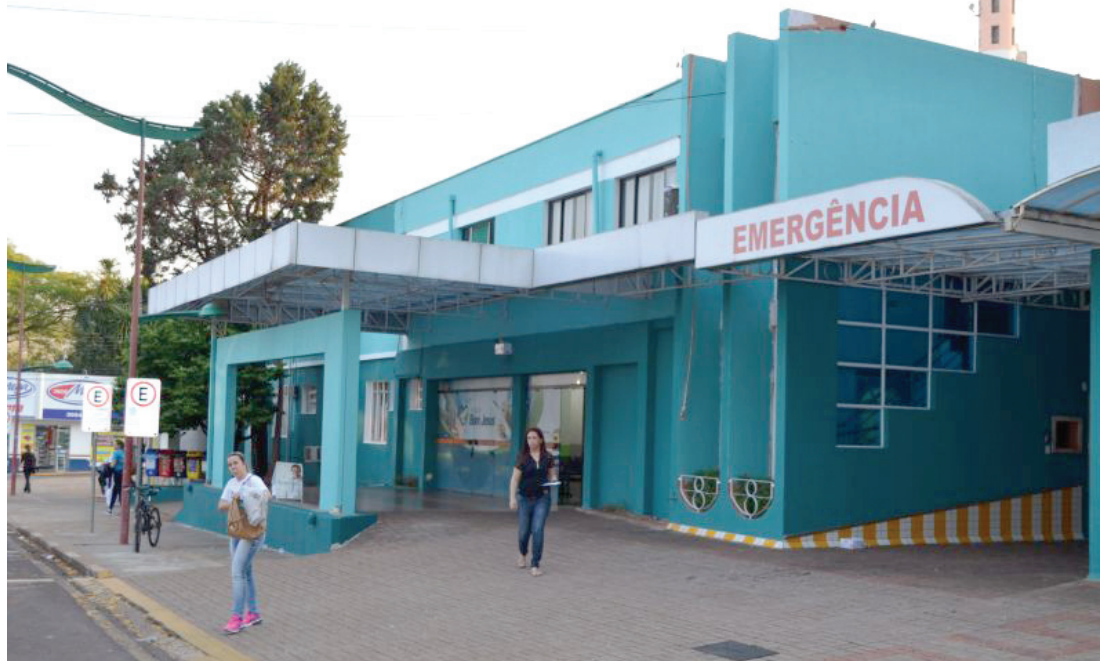
O Hospital Bom Jesus é responsável pelo atendimento de pacientes da microrregião de Toledo

“No fim de 2016 houve uma força-tarefa para que pudéssemos ter a liberação de recursos do governo federal para manter o hospital aberto, mas agora começa nova-