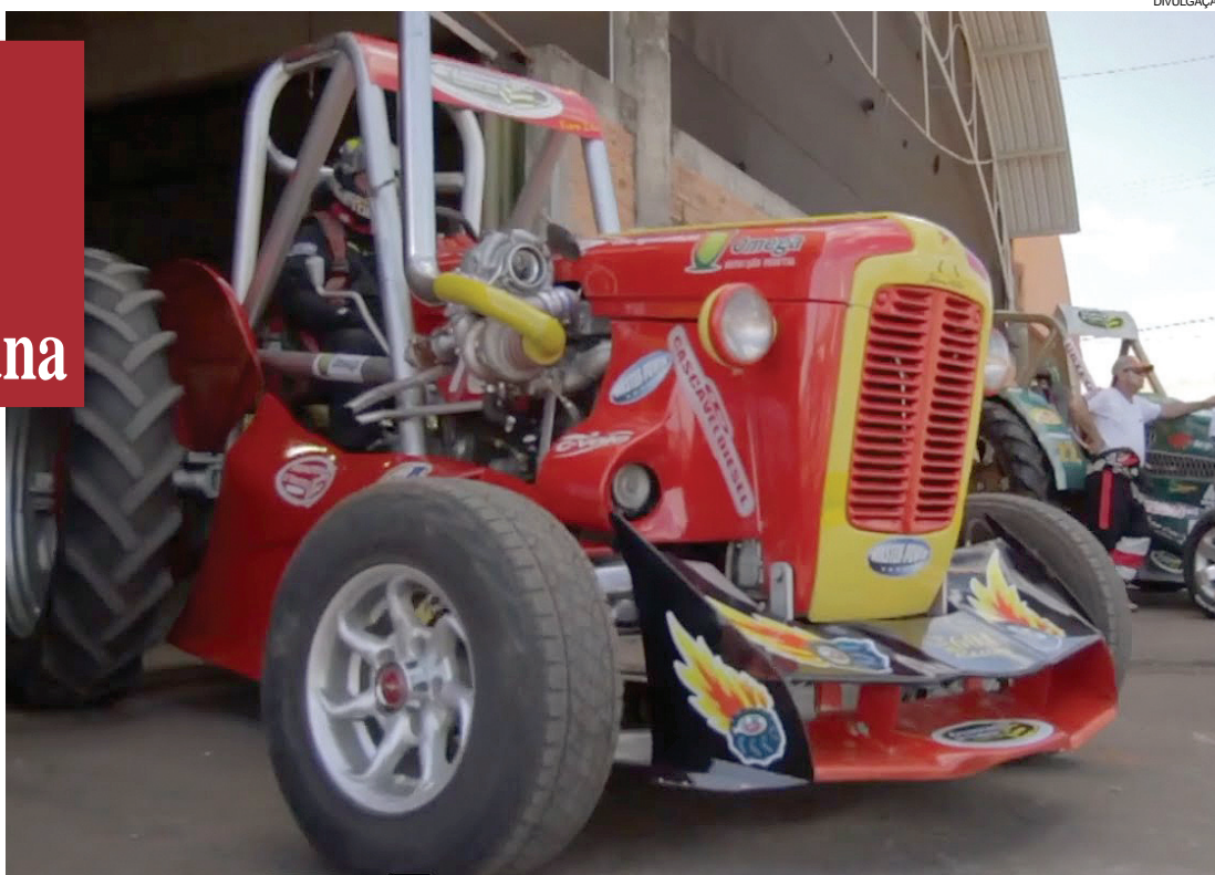
Os tratores voltam a acelerar em Maripá para mais uma edição do tradicional arrancadão

A edição 2017 da competição está sendo realizada pelo Automóvel Clube de Maripá