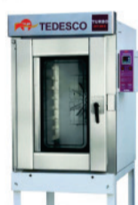
FTT - 300 G