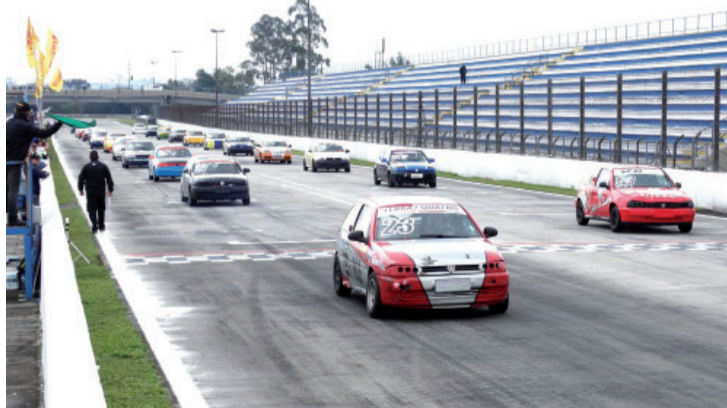
A categoria Terra (pilotos que competiam na Velocidade na Terra) foi a boa surpresa da temporada

Paralelos ao evento, a última etapa do Paranaense de Motovelocidade e a etapa final da Sprint Race.