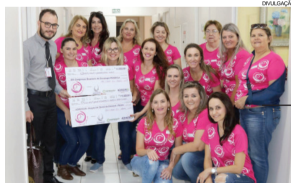
Empresárias fizeram o repasse à Uopecan

Ela lembra que ainda existem camisetas disponíveis nas lojas parceiras e que toda compra terá parte revertida para o hospital.