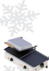
SCE - 70