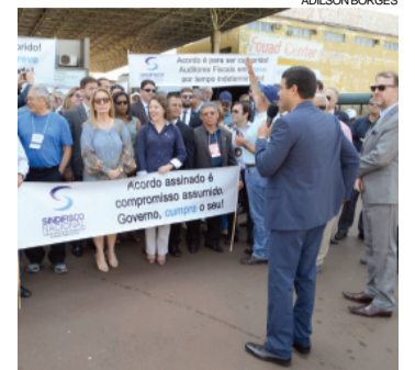
Auditores fiscais protestaram ontem em frente à aduana na fronteira do Brasil com o Paraguai, em Foz do Iguaçu