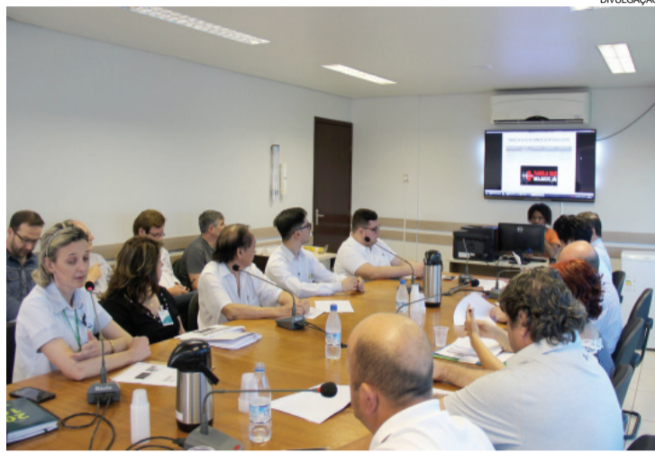
Associação apresenta números para garantir apoio do Legislativo