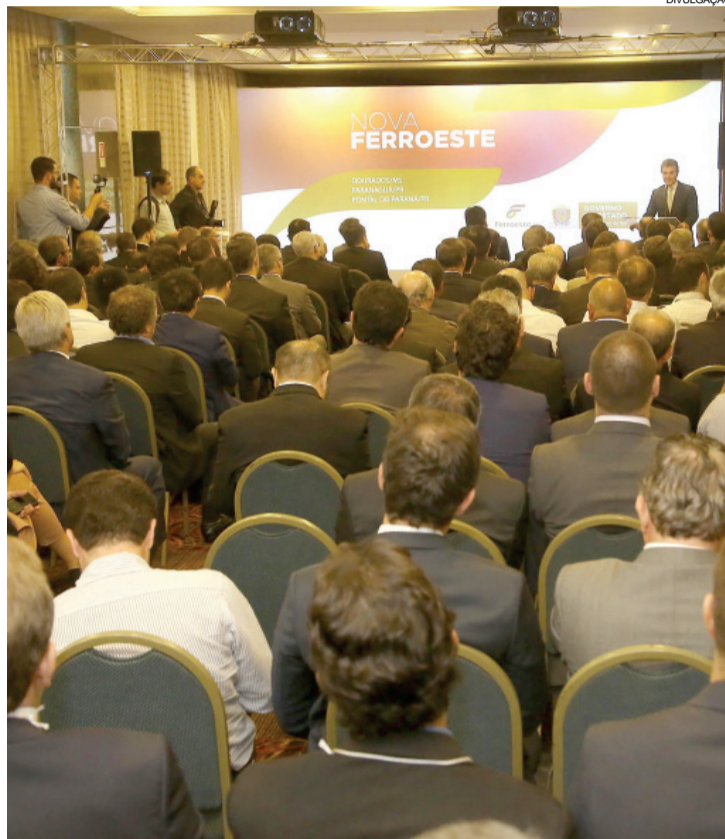
Autoridades do Paraná, do Mato Grosso e de São Paulo, com investidores, participaram do lançamento da nova ferrovia

isso que o Paraná quer corrigir, para que garantir competitividade ao setor agronegócio", disse ele.