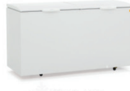
GHBA - 510