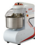
AE - 25L