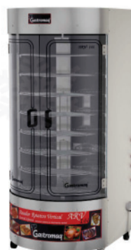
ARV - 150