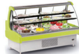
CRSTG - 1500