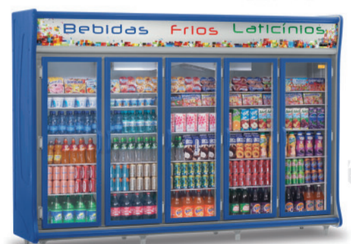
GEVT - 5 PAZ

WWW.REFRIEL.COM.BR vendas@refriel.com.br