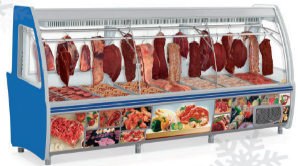
GCPC - 310 AZ