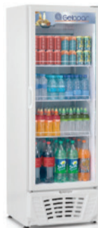
GPTU - 40