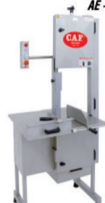
CAF 3.10 super inox NR12