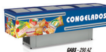
GABS - 290 AZ