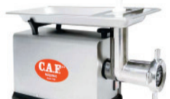
CAF 22 - inox NR12