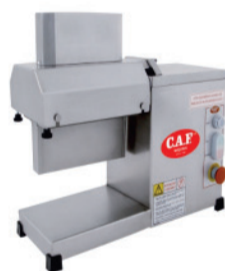
CAF AMB - inox NR12