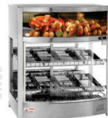
ESTUFA - 266