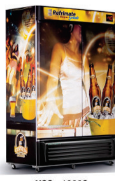
VCC - 1300S