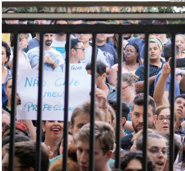
Do lado de fora do plenário, manifestantes exibiam cartazes

cas; e para fazer com que eles adotem padrões de julgamento e de conduta moral - especialmente moral sexual - incompatíveis com os que lhes são ensinados por seus pais ou responsáveis”.