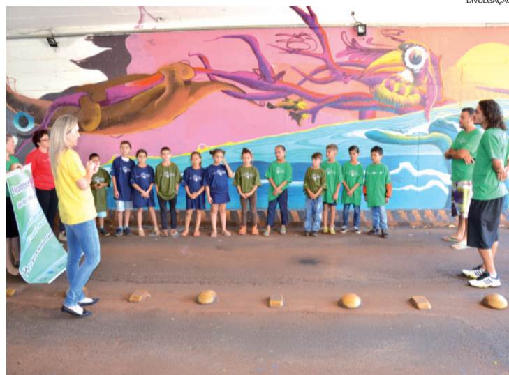
Alunos da Escola Serafim Machado foram conhecer o trabalho desenvolvido no túnel