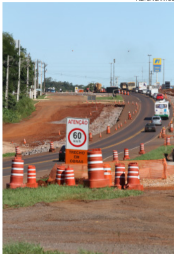
Boa parte das novas pistas foi feita pelas concessionárias que administram os pedágios

Dentre as metas, o então candidato à reeleição prometia a geração de 400 mil empregos, 20 novos presídios, duplicação de 750 km de rodovia e contratação de mais 10 mil policiais. Na primeira reportagem da série, publicada na edição de domingo (3) e que pode ser conferida no site www.oparana.com.br , a constatação de que, dos empregos gerados, o saldo de janeiro de 2015 a setembro deste ano é negativo em 107 mil postos de trabalho. Foram prometidos R$ 10 milhões em investimentos em energia elé-