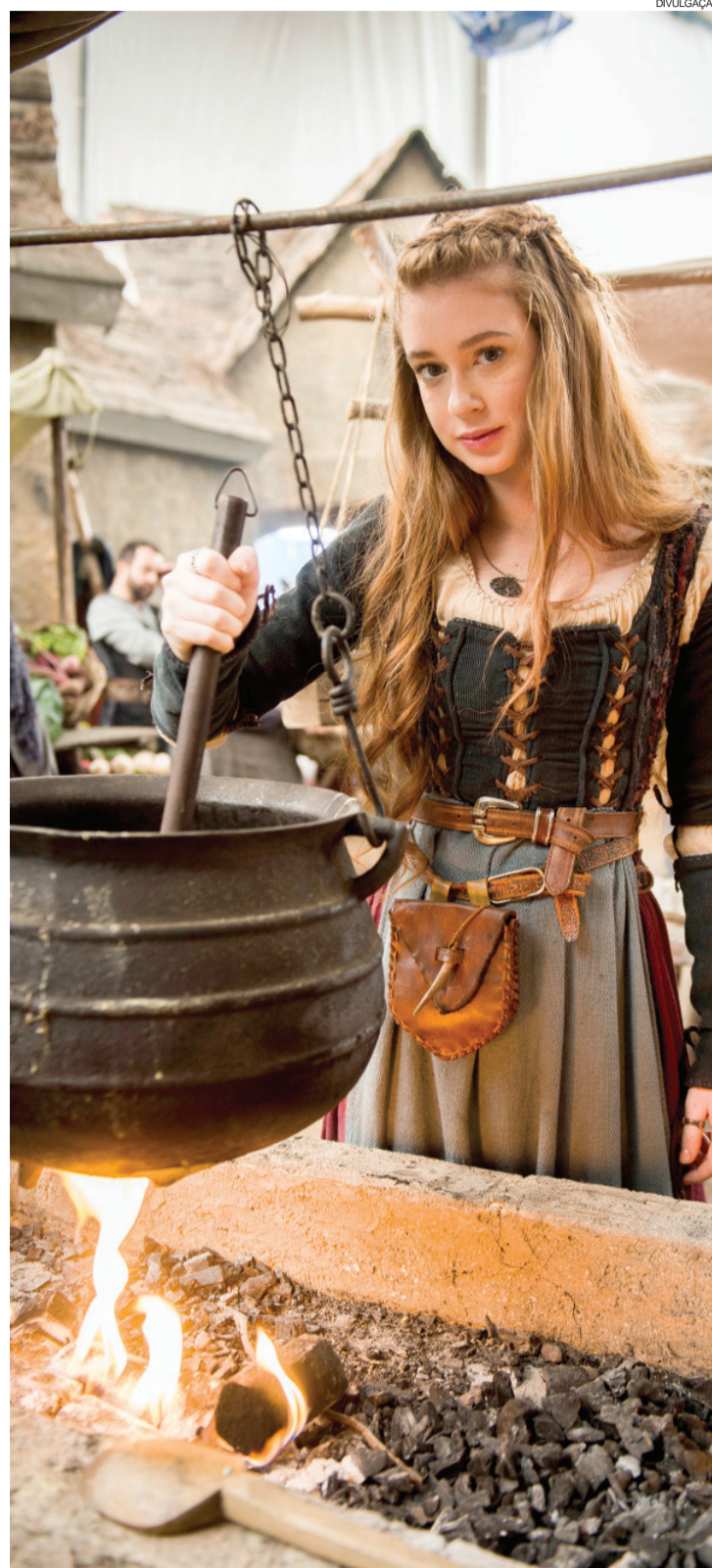
Depois de lançar um livro, domingo em São Paulo, Marina Ruy Barbosa (foto) já está de volta às gravações da novela "Deus Salve o Rei" nos Estúdios Globo, no Rio.

Isto também será transformado em especial no SBT, mesclando em sua exibição outras ações que o Instituto Neymar Jr. vem realizando no mundo afora.