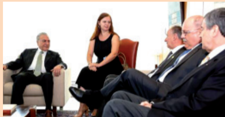
Autoridades da área de segurança do governo da Rússia se reuniram com o presidente Michel Temer

Autoridades da área de segurança do governo da Rússia se reuniram com o presidente Michel Temer e integrantes do governo brasileiro ontem e um dos temas discutidos foi a cooperação na área de segurança na Copa do Mundo de 2018. A Rússia vai sediar a competição, e o Brasil foi o último país a receber os jogos, em 2014.