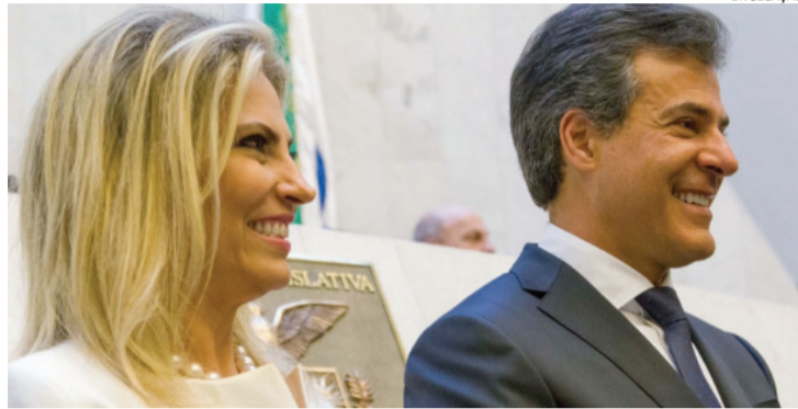
Beto terá de passar o governo para Cida, se quiser concorrer ao Senado

Ou seja. Se Beto Richa deixa o governo, perde a restrição de foro e pode ser investigado na esfera comum. E o Ministério Público do Paraná anda ávido para chegar a um dos barões citados no esquema de desvios de dinheiro da Secretaria Estadual de Educação, que teriam sido aplicados