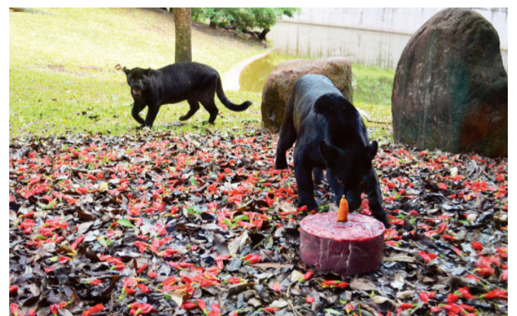
Onças podem ser observadas no passeio ao Refúgio Biológico Bela Vista, da usina de Itaipu

Cacau, a primeira onça-pintada nascida no Refúgio Biológico Bela Vista, da usina de Itaipu, completa um ano no próximo dia 28. E sua festa de aniversário foi ontem (21). A aniversariante e a mãe, a onça Nena, ganharam um bolo congelado de carne. No local também foi servido bolo tradicional para os convidados e a imprensa. O diretor-geral da Itaipu, Luiz Fernando Vianna, padrinho da onça, participou da cerimônia.