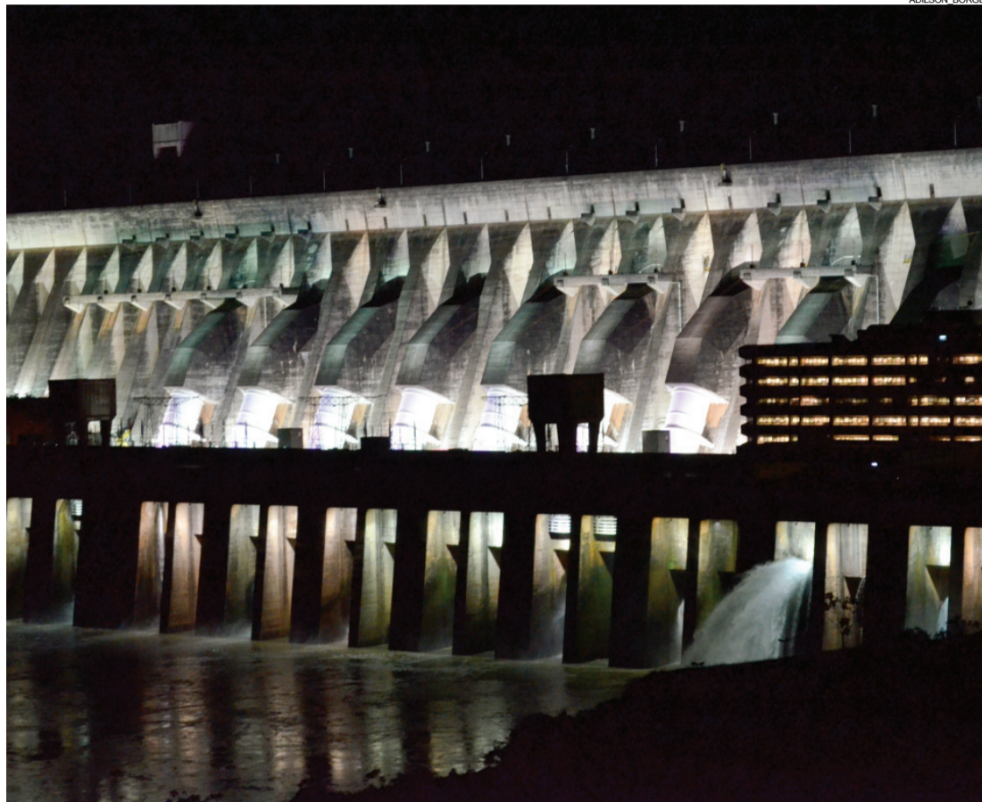
Evento especial para moradores da região e visitantes acontece no Mirante da Usina

A tradicional iluminação de Itaipu terá uma mudança especial amanhã, dia 23. A Itaipu Binacional, o Complexo Turístico Itaipu e o PTI (Parque Tecnológico Itaipu) promovem o “Energia de Natal”. O evento começará um pouco antes do horário convencional: às 20h, com apresentações circenses da Trupe Luz da Lua. Em seguida, o grupo teatral Parabolê apresenta a peça “Procura-se um Papai Noel”. A iluminação monumental será o grande encerramento da noite, quando o jogo de música e de luzes transforma a maior hidrelétrica em geração de energia em um espetáculo épico. O principal intuito do “Energia de Natal” é aproximar a comunidade da Iluminação da Barragem, além de promover um evento de Natal diferenciado para a cidade, que tenha a cara da Itaipu. O evento será gratuito para moradores de Foz do Iguaçu e da região lindeira ao Lago de Itaipu. Para os demais visitantes, o ingresso custará R$ 22. Mais informações: (45) 3576-7000 ou info@turismoitaipu.com.br .