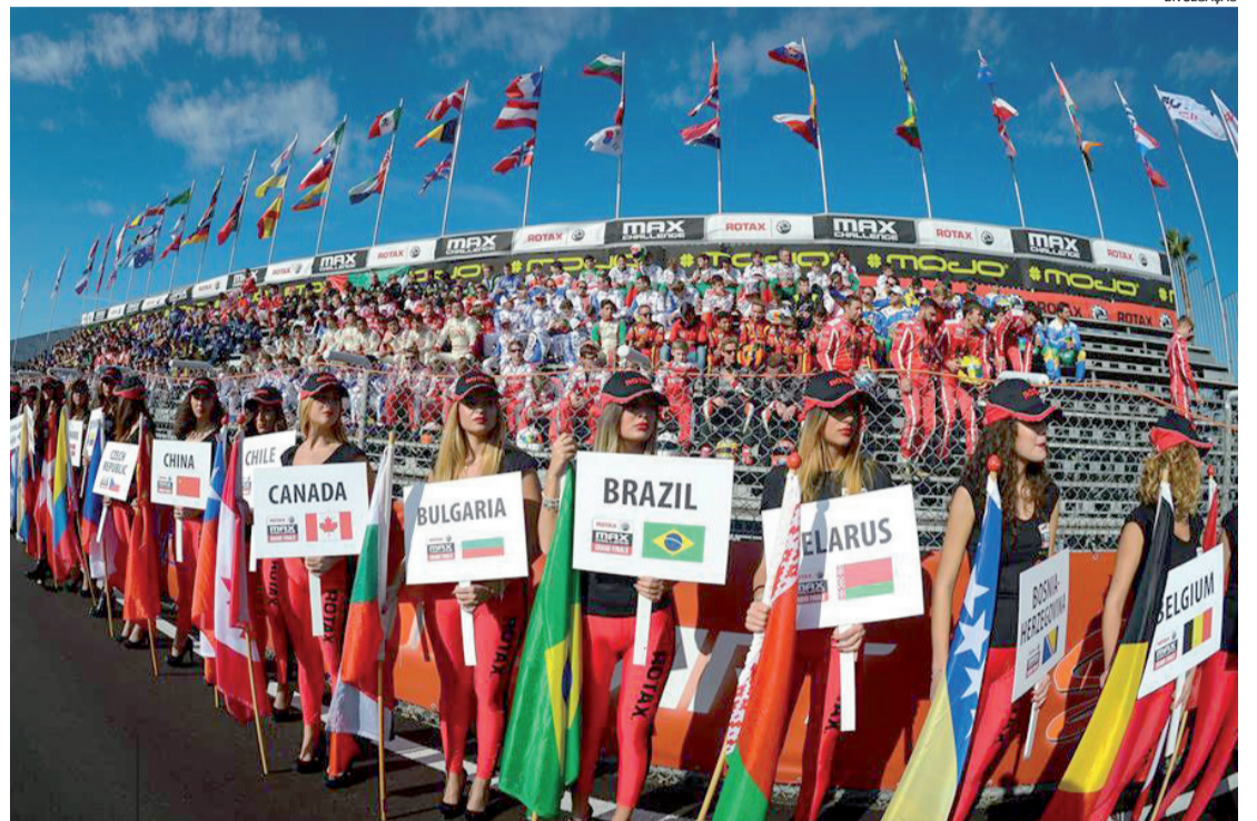
O Brasil tem se destacado nas últimas edições do Mundial de Kart Rotax

O Rotax Max Challenge Grand Finals (RMCGF), que reúne os melhores pilotos de dezenas de países de todo o mundo, será realizado no Circuito Internacional de Kart Paladino, na cidade de Conde, na Paraíba, entre os dias 26 de novembro e 1º de dezembro de 2018.