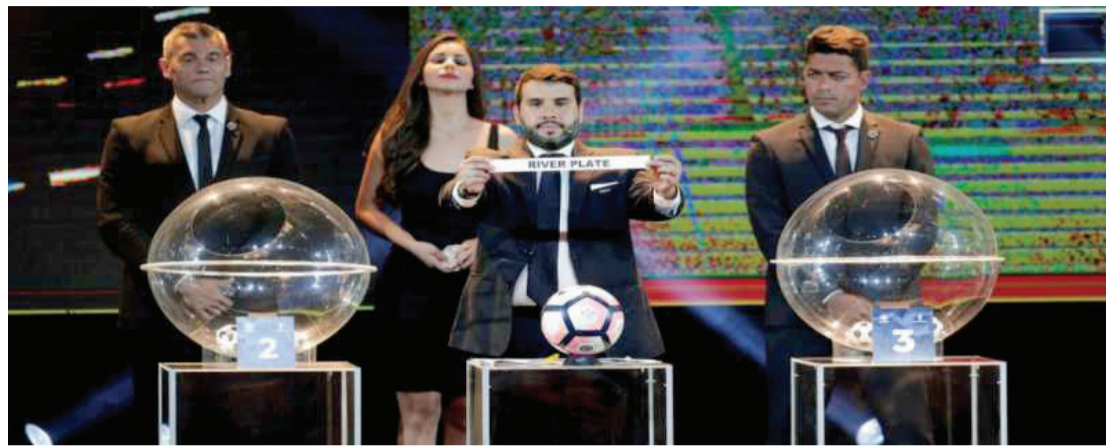
Fase de grupos tem início previsto para o dia 27 de fevereiro

Paraguai - A rivalidade acirrada entre brasileiros e argentinos promete esquentar ainda mais em 2018. O sorteio da fase de grupos da Libertadores colocou sete brasileiros