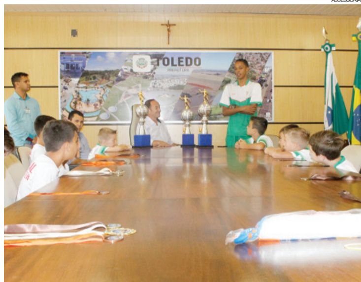
Atletas e familiares compartilharam conquistas com o prefeito de Toledo

Toledo - As equipes de Futsal de Toledo conquistaram excelentes resultados na oitava edição da Copa do Brasil de Futsal. O Município foi representado na competição pelas categorias Sub 8, 10 e 11 por meio da AFCBT (Associação de Futsal das Categorias de Base de Toledo). O Campeonato contou com a participação de 45 times de todo o Brasil, do Paraguai e da Bolívia, que disputaram 17 categorias, reunindo aproximadamente 2 mil atletas.