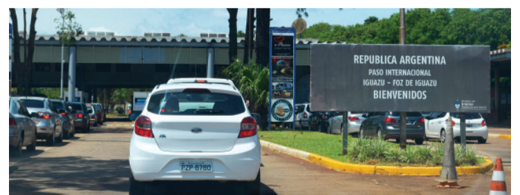
Carta Verde ou itens obrigatórios para os veículos são exigidos apenas para quem vai além da região fronteiriça

O Seguro Carta Verde não está sendo exigido na Aduana Argentina para quem quer apenas ingressar até Puerto Iguazú. Na última terça-feira (19), autoridades de segurança dos três países das Três Fronteiras: Brasil, Argentina e Paraguai, estiveram reunidos na aduana brasileira da Ponte Tancredo Neves para redigir um documento com recomendações sobre documentação e itens de segurança do veículo exigidos para adentrar além da fronteira. A polêmica surgiu quando, na semana retrasada, circularam comentários de que policiais argentinos passaram a abor-