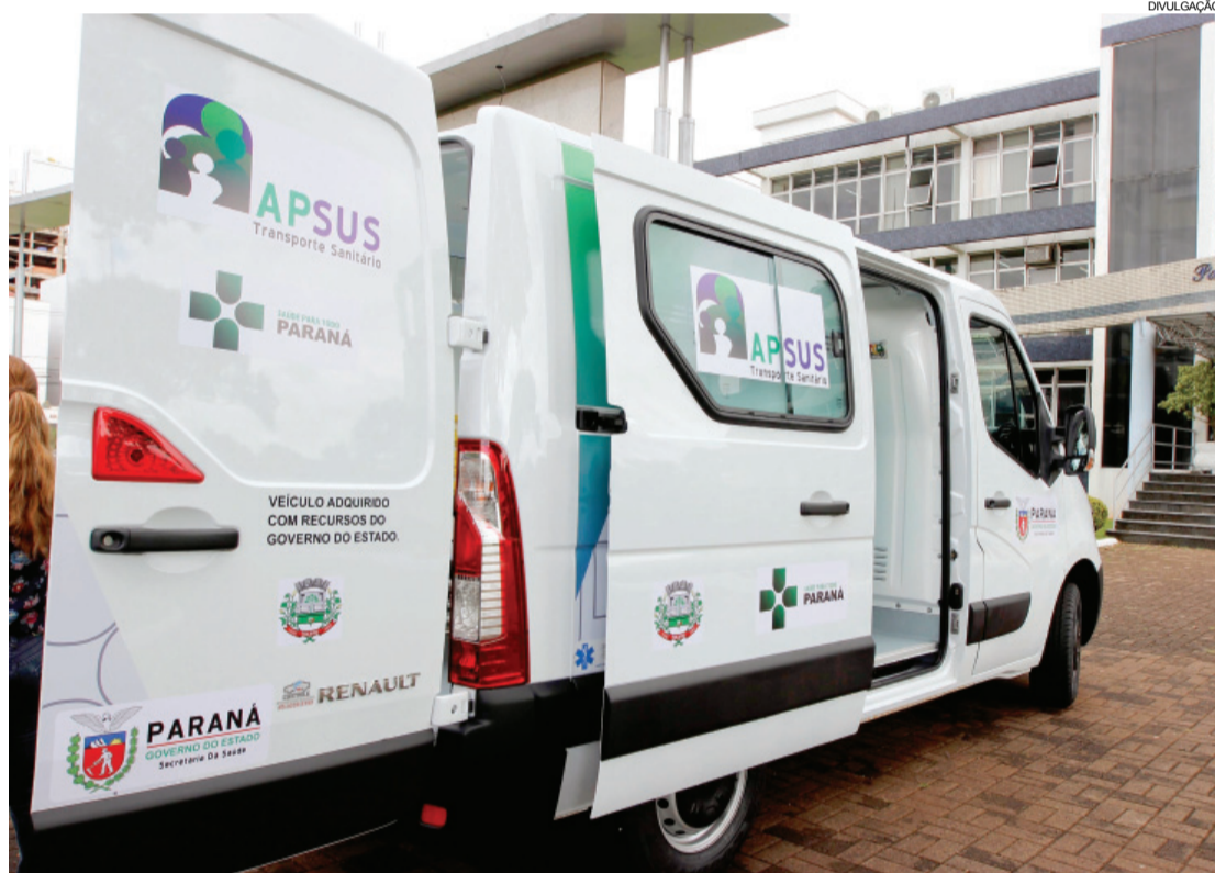
A ambulância vai reforçar o atendimento na área da saúde em Toledo

Toledo - O Município de Toledo ganhou um reforço na frota da saúde. O prefeito Lúcio de Marchi comemora a entrega das chaves de uma ambulância e de uma van. Os investimentos estaduais somam R$ 240 mil e a contrapartida do Município é de R$ 31.800.