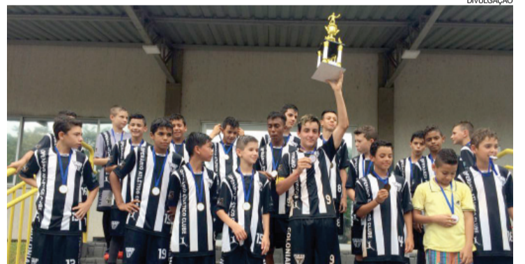
Partidas decisivas foram realizadas no último fim de semana

Por sua vez, Messi passou longe de sua melhor marca pessoal, estabelecida em 2012 - naquela ocasião, o argentino fez 91 gols em 69 partidas. Ainda assim, o camisa 10 do Barcelona teve um ano dentro de seus padrões. A estrela do Barça não fica abaixo de 40 gols na temporada desde 2009 e apenas em 2013 não superou a barreira das 50 anotações.