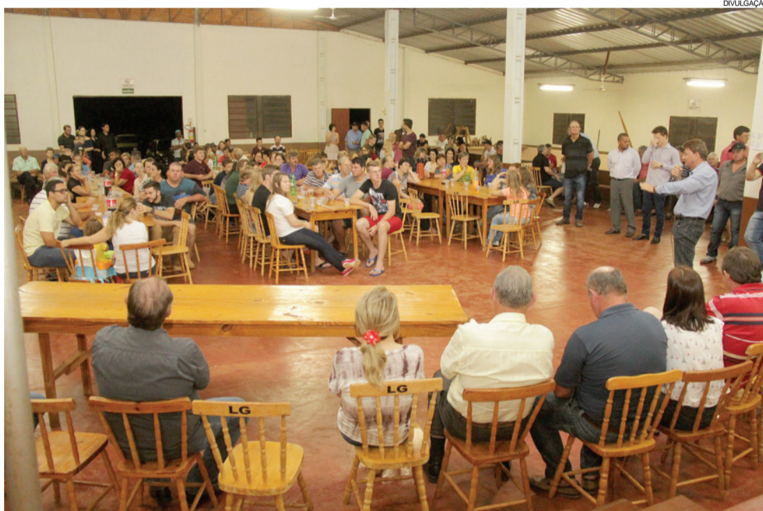
Moradores da comunidade comemoraram a pavimentação na Linha Iguazu

O trecho que liga a pedreira municipal à sede recebeu cobertura com pedra irregular na extensão de 1.500 metros lineares por seis metros de largura, correspondente a metragem total de 9.000 metros quadrados. A obra é uma parceria entre a Prefeitura de Nova Santa Rosa e a Câmara