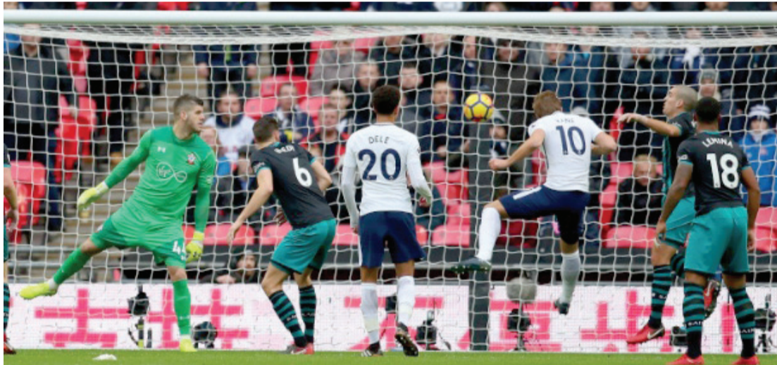
Atacante soma 56 gols nos últimos 12 meses

São Paulo - Três gols no último jogo de 2017 fizeram o atacante Harry Kane terminar como o principal artilheiro do futebol mundial no ano, na frente de Lionel Messi. A estrela marcou na vitória do Tottenham sobre o Southampton ontem, por 5 a 2, e soma 56 gols nos últimos 12 meses.