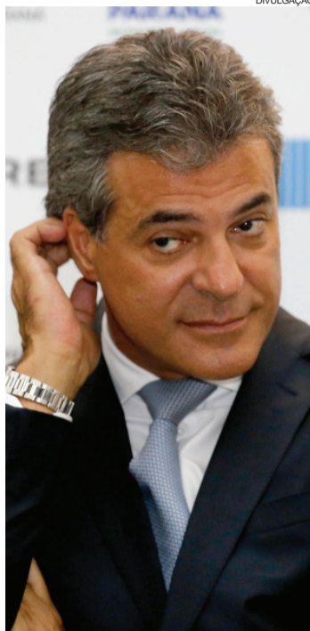
Reeleito governador em 2014, Beto Richa está prestes a deixar o governo para disputar vaga ao Senado

Mas vem mais por aí. Neste mês, o governo do Estado aprovou novo aumento de impostos, desta vez para as pequenas e microempresas. Já avisou que não vai conceder reajuste salarial ano que vem. E seu nome figura em algumas das pastas sobre as mesas de ministros do STF (Supremo Tribunal Federal) e do STJ (Superior Tribunal de Justiça) à espera de aval para ser investigado.