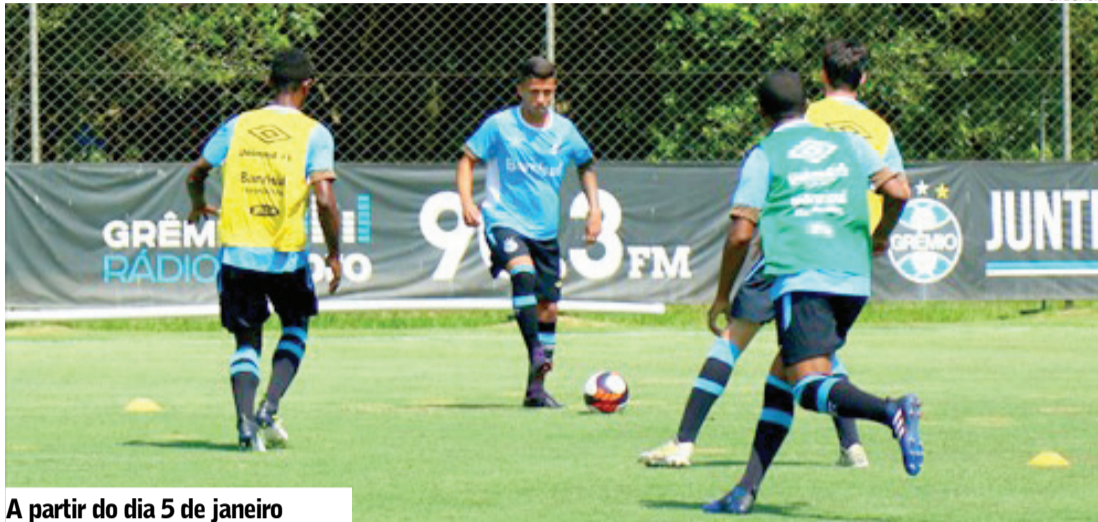
A partir do dia 5 de janeiro atletas começaram preparação para o Campeonato Gaúcho 2018

Ao todo, são 13 atletas nas atividades. A partir de 5 de janeiro, eles se juntarão