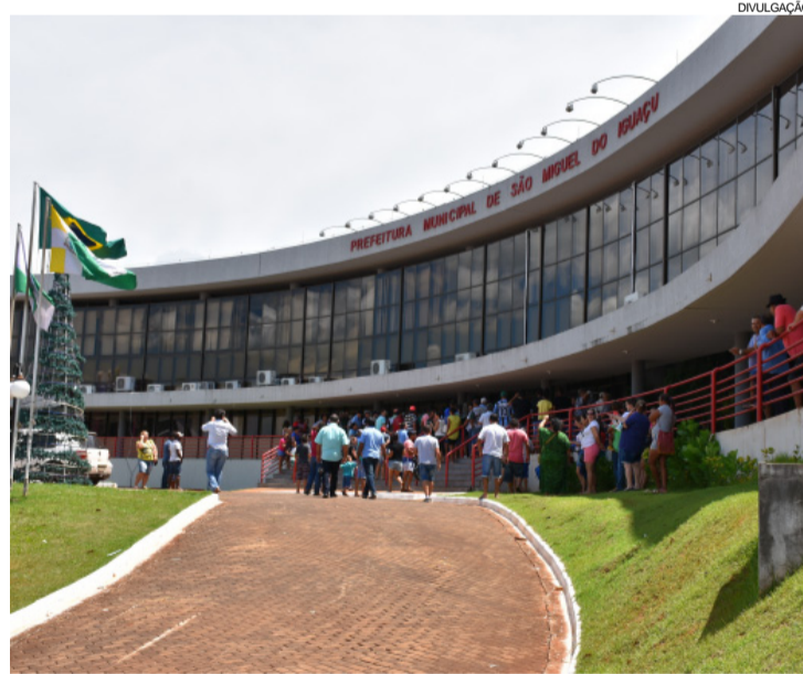
Moradores se reuniram em frente à prefeitura e pediram revisão das taxas