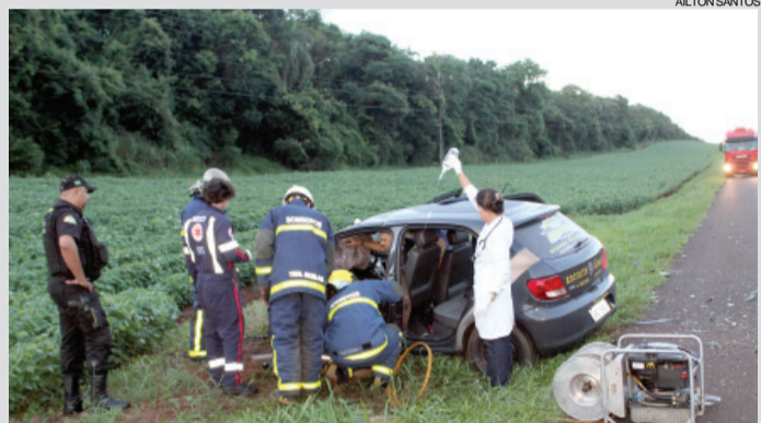
Colisão ocorreu na BR-277

Santa Tereza do Oeste - Um acidente frontal deixou dois carros completamente destruídos e quatro vítimas com ferimentos graves. Foi na BR-277, em Santa Tereza do Oeste. As quatro vítimas ficaram encarceradas quando. Os bombeiros tiveram muito trabalho para prestar o socorro. Oito bombeiros, além dos socorristas da Ecocataratas e os policiais rodoviários federais, atenderam a ocorrência.