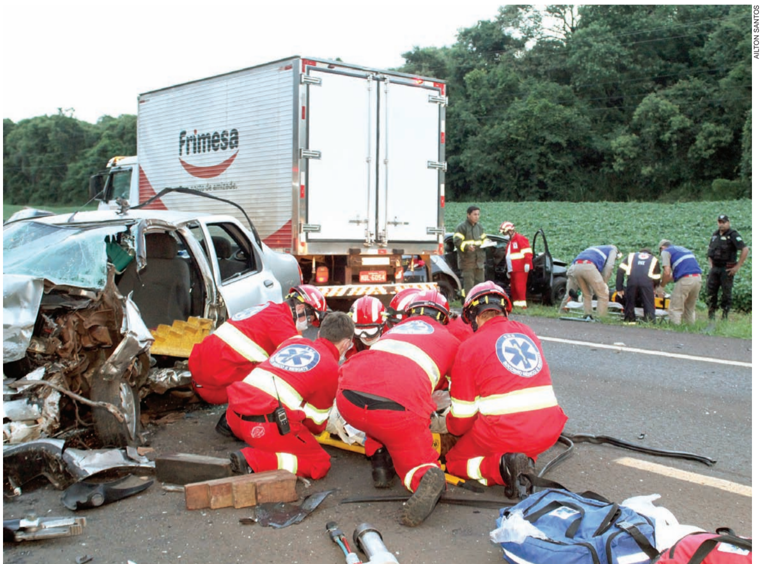
Acidente ontem em Santa Tereza do Oeste aconteceu na pista da BR-277 que deveria ter sido duplicada, conforme contrato original: quatro pessoas ficaram presas nas ferragens