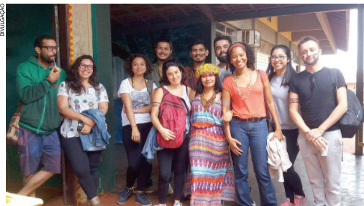
Grupo de estudantes da Unila que foram visita a aldeia em São Miguel

Segundo ela, um grupo de professores indígenas está produzindo materiais específicos para alfabetizar as crianças da aldeia, voltados à tradição, ao guarani e à língua materna. “O nosso sonho é alfabetizar o aluno indígena dos anos iniciais só na língua materna. Esse é nosso sonho. Para depois, no terceiro, quarto ano, iniciar o português. Vejo que só assim se vão manter a língua e a tradição, o modo de viver indígena”, acredita.