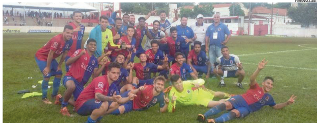
Paraná Clube conseguiu uma classificação heróica com um gol no finalzinho do jogo em Cravinhos