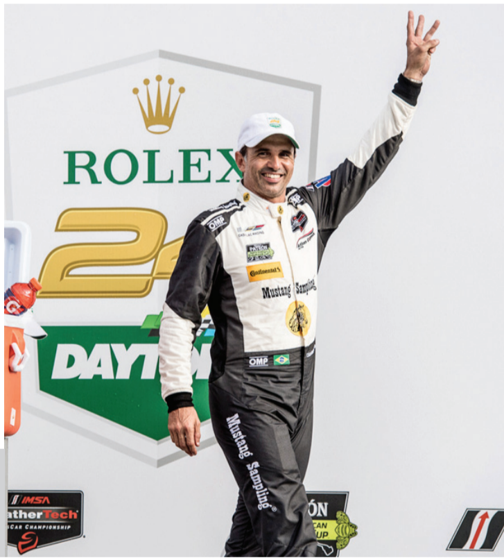
Christian Fittipaldi vence as 24 Horas de Daytona pela terceira vez