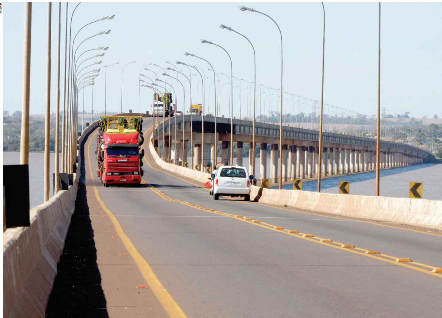
Uma das portas do tráfico e do contrabando, Ponte Ayrton Senna é vandalizada e fica sem iluminação

principais rotas é a Costa Oeste, onde os contrabandistas destruíram toda a iluminação da Ponte Ayrton Senna, que liga o Paraná ao Mato Grosso do Sul, para “cegar” a fiscalização da Polícia Rodoviária Federal, inclusive nos portos clandestinos nas proximidades. | Oeste A5