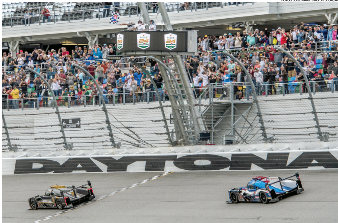
Bandeirada da vitória e recorde de maior número de pontas

A festa brasileira se completou com outras boas atuações. Bruno Senna alcançou o quarto lugar. Hélio Castroneves fechou a prova em nono; Augusto Farfus Júnior foi o 18º, e Bruno Junqueira, o 36º.