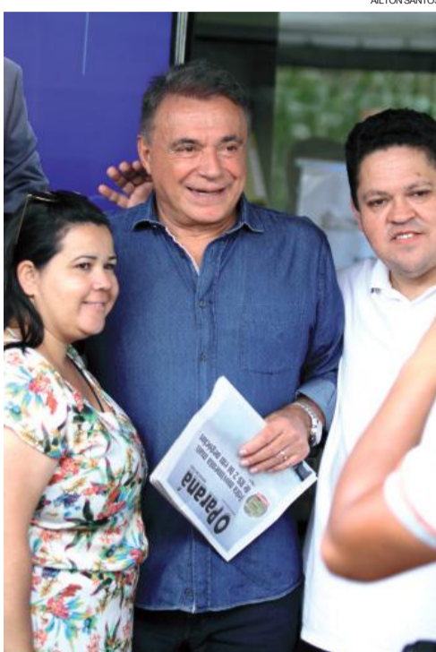
Bem humorado, senador teve até seus momentos de tietagem

Quando falou sobre armar o povo brasileiro, fez uma crí-