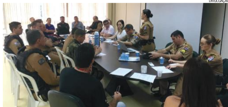
Comissão definiu detalhes para o evento agendado para o dia 11