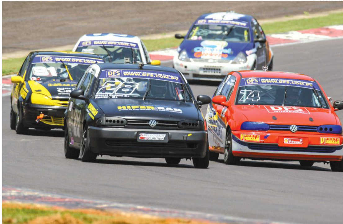
As emoções do Metropolitano de Marcas de Cascavel terão início no dia 18 de março

Em todas as etapas do Metropolitano, também fará parte da programação as provas da Copa Paraná/Sul de Motovelocidade.