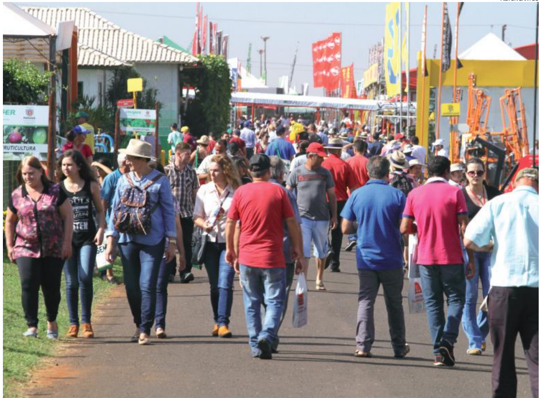
Com público recorde, Show Rural já pensa em manter as metas para a próxima edição

O Show Rural Coopavel, além de movimentar vários setores produtivos de Cascavel e da região (hotéis, ba-