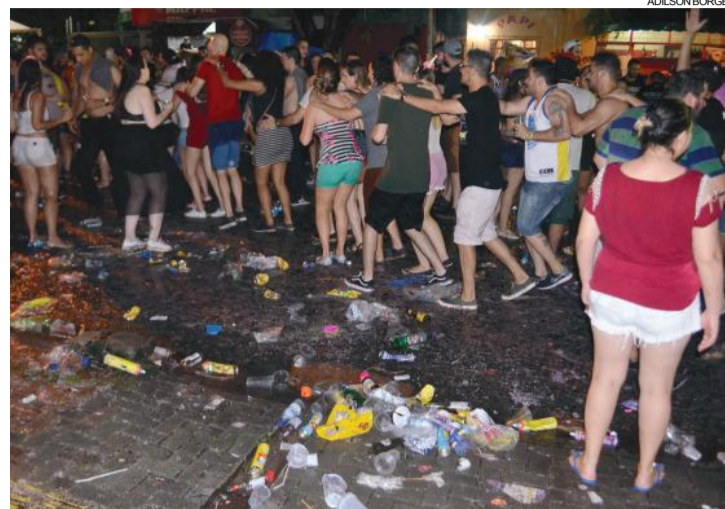
A alegria dos foliões contrastava com o lixo espalhado pela rua

O Carnaval da Saudade terá continuidade nesta terça-feira à tarde, com animação da Banda Sabanna. Haverá ainda o Concurso de Blocos e Foliões e para a reposição de energia, a canja do galo será servida às 17 horas. Toda a renda obtida com a venda do prato será