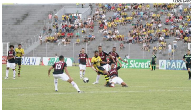
FC Cascavel foi derrota em casa e Toledo perdeu em Cianorte no fim de semana