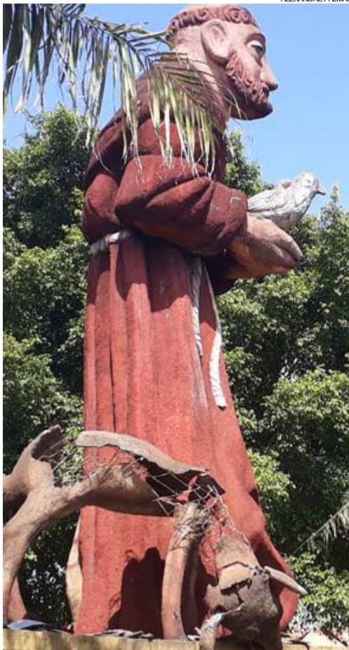
Obra do artista Giovanni Vissotto está esquecida

tem uma placa indicando a inauguração em 2000. Segundo a prefeitura, a manutenção é responsabilidade da igreja. Já a Paróquia São Francisco de Assis diz que a