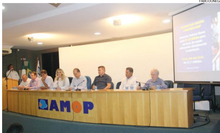
Prefeitos recebem líderes estaduais e nacionais, dentre eles a vice-governadora e o ministro Ricardo Barros (ao centro)

A ascensão de Cida Borghetti ao governo foi dada como certa no discurso do marido, Ricardo Barros, que, em seu pronunciamento, afirmou que a progressista tem muito a contribuir com o desenvolvimento do Estado: "A candidatura da Cida é certa e nenhum cenário vai mudar isso, mas é claro que existe uma grande vontade que ela assuma essa