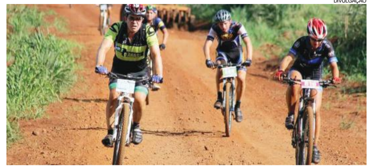
Os ciclistas poderão optar por trajetos de 23 km e 39 km.

Marechal Cândido Rondon - As inscrições para a primeira etapa do 6º Circuito Regional de Cicloturismo da Adetur, que ocorrerá em Marechal Cândido Rondon, já foram abertas. A expectativa para o evento, programado para 4 de março, é a de reunir cerca de mil ciclistas. Em 2017, 722 ciclistas participaram da etapa rondonense.