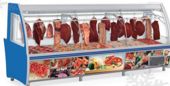
GCPC - 310 AZ