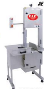
CAF 3.10 super inox NR12