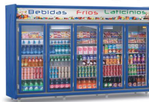
GEVT - 5 PAZ

WWW.REFRIEL.COM.BR vendas@refriel.com.br