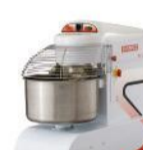
AE - 25L