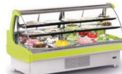
CRSTG - 1500