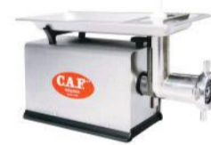
CAF 22 - inox NR12