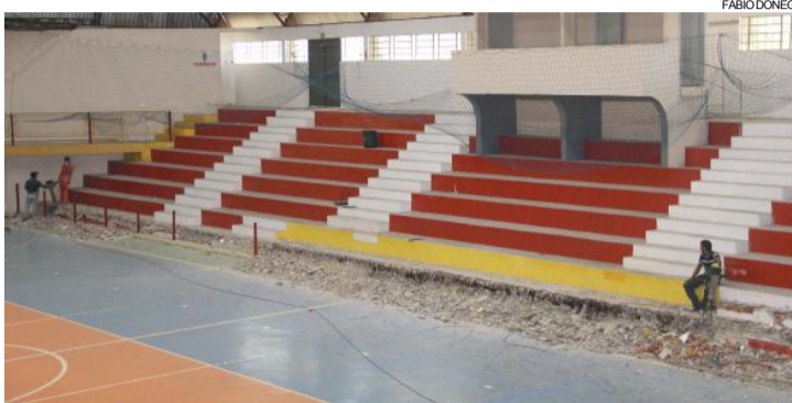
Ginásio da Coopavel recebe melhorias e pode ser a nova casa do Cascavel Futsal

“Foi feito um levantamento do que precisa ser feito. Não são problemas de agora, são de muitos anos. O ginásio foi inaugurado há 33 anos [em 1985] e só recebeu grandes melhorias em 1996 e 2007. O prefeito volta a despachar nesta quinta-feira [volta de Brasília/DF] e então vai ser levantado junto