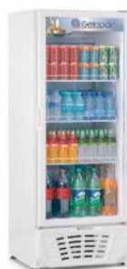
GPTU - 40