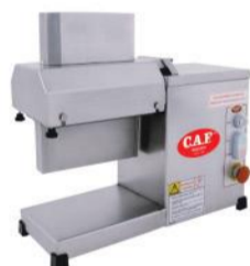
CAF AMB - inox NR12