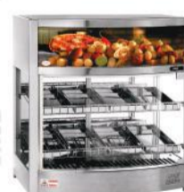
ESTUFA - 266