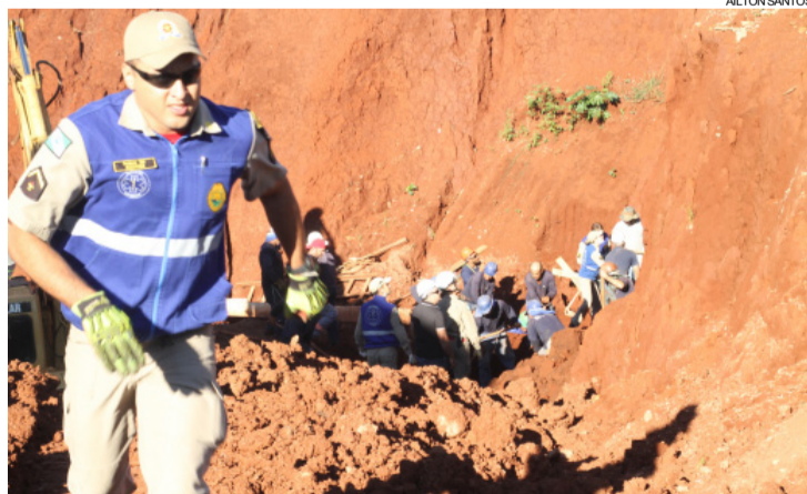
Bombeiros e funcionários trabalhavam para retirar as vítimas de soterramento

Depois de muito trabalho, dois trabalhadores foram encontrados mortos. A terceira vítima foi resgatada com vida e levada a uma das ambulâncias, com ferimentos leves, mas muito abalada com o acidente e a notícia da morte dos colegas. Na ambulância, era incentivado a falar pelos bombeiros, para continuar consciente.