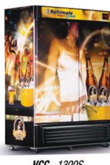
VCC - 1300S