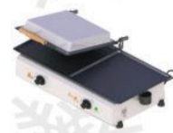
SCE - 70