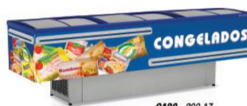
GABS - 290 AZ