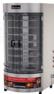
ARV - 150