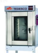
FTT - 300 G