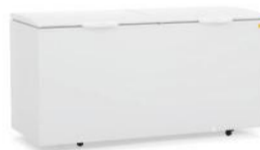
GHBA - 510