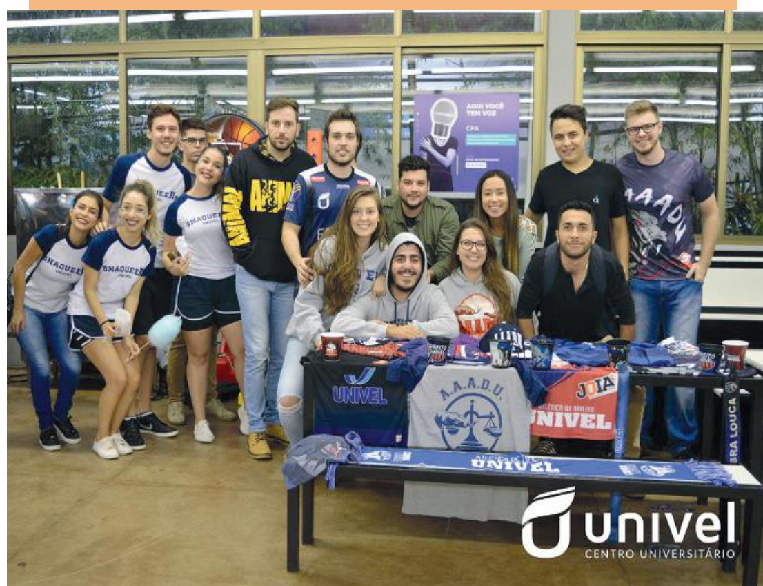
Acadêmicos de Direito da Univel da Atlético Cobra Louca na volta às aulas