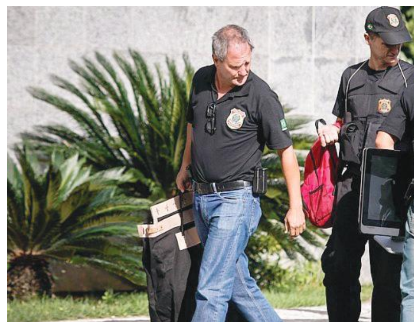
Foram cumpridos 55 mandados de busca e apreensão e seis de prisão tem

Os procuradores afirmaram que não é possível confirmar envolvimento de atores políticos no esquema, mesmo por negligência. Eles não mencionaram o nome do governador do Paraná. “Sempre reiteramos que a Lava Jato não tem cunho partidário. Nossa questão é investi-