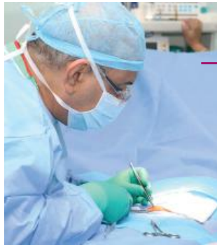
Eventos devem reunir mais de 500 cirurgiões de todo o país em Foz do Iguaçu

A partir de hoje (23) o app Uber começa a operar em Foz do Iguaçu e região de Santa Terezinha de Itaipu e São Miguel do Iguaçu. A informação foi repassada em reunião realizada ontem no Hotel Ra-fain Palace com representantes da plataforma e motoristas interessados em trabalhar para o aplicativo.