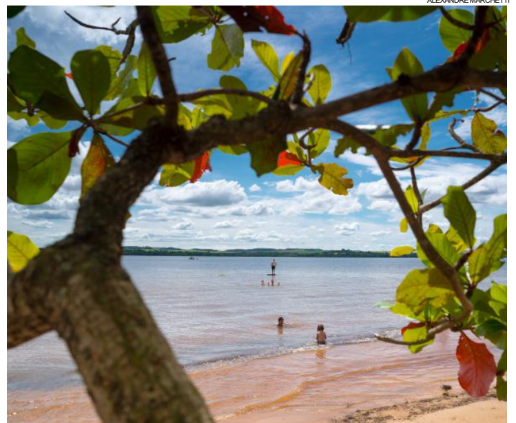
A praia artificial de Porto Mendes, em Marechal Cândido Rondon: potencial para potencializar turismo

Itaipu também estuda entender o prazo de comodato das praias artificiais para mais dez anos, prorrogáveis para o mesmo período. (VD)