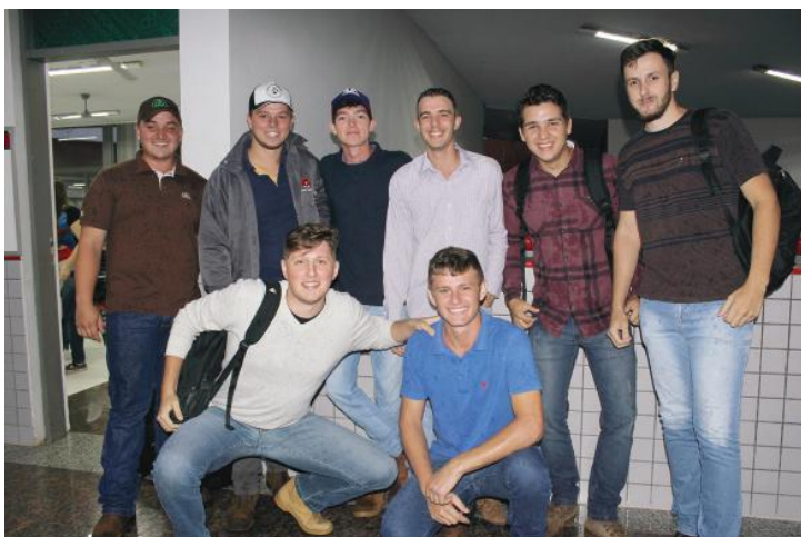
Foi dia de reencontrar os amigos