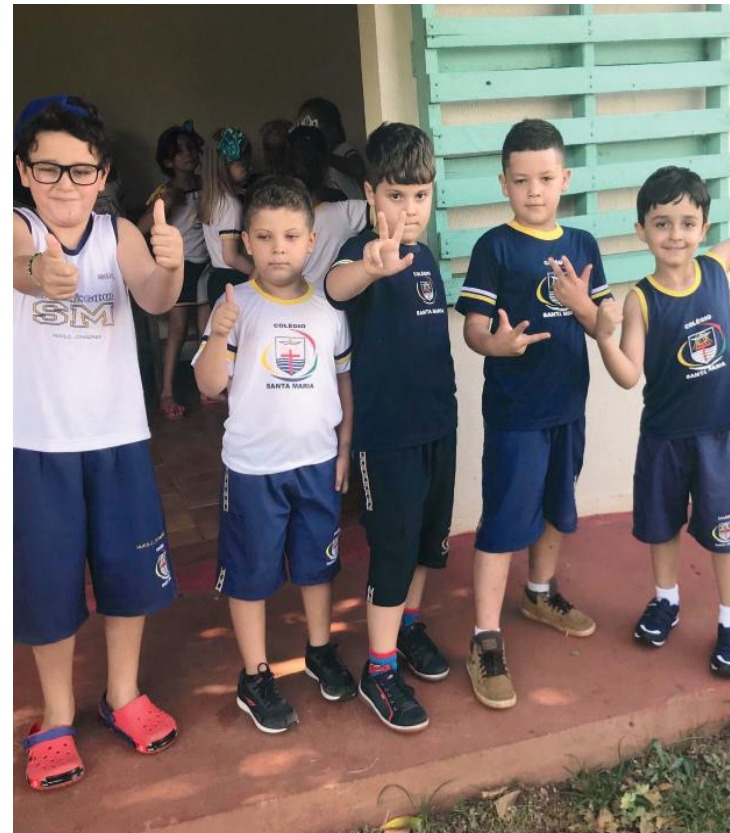
Alunos do Santa Maria fizeram um tour no Colégio no retorno às aulas