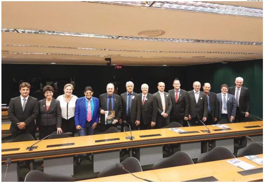
Prefeitos dos municípios lindeiros participam de encontro com senadores para pedir apoio a projeto dos royalties