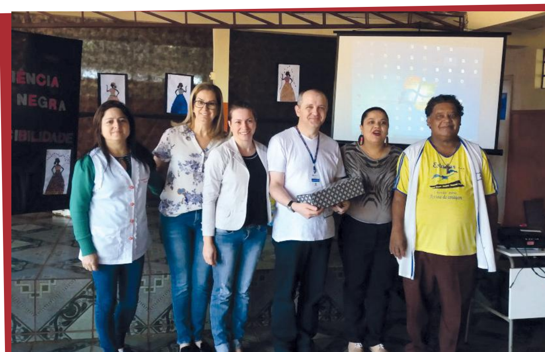
Equipes multidisciplinares no NRE em atividade no Colégio São Francisco de Assis em Corbélia sobre cultura africana