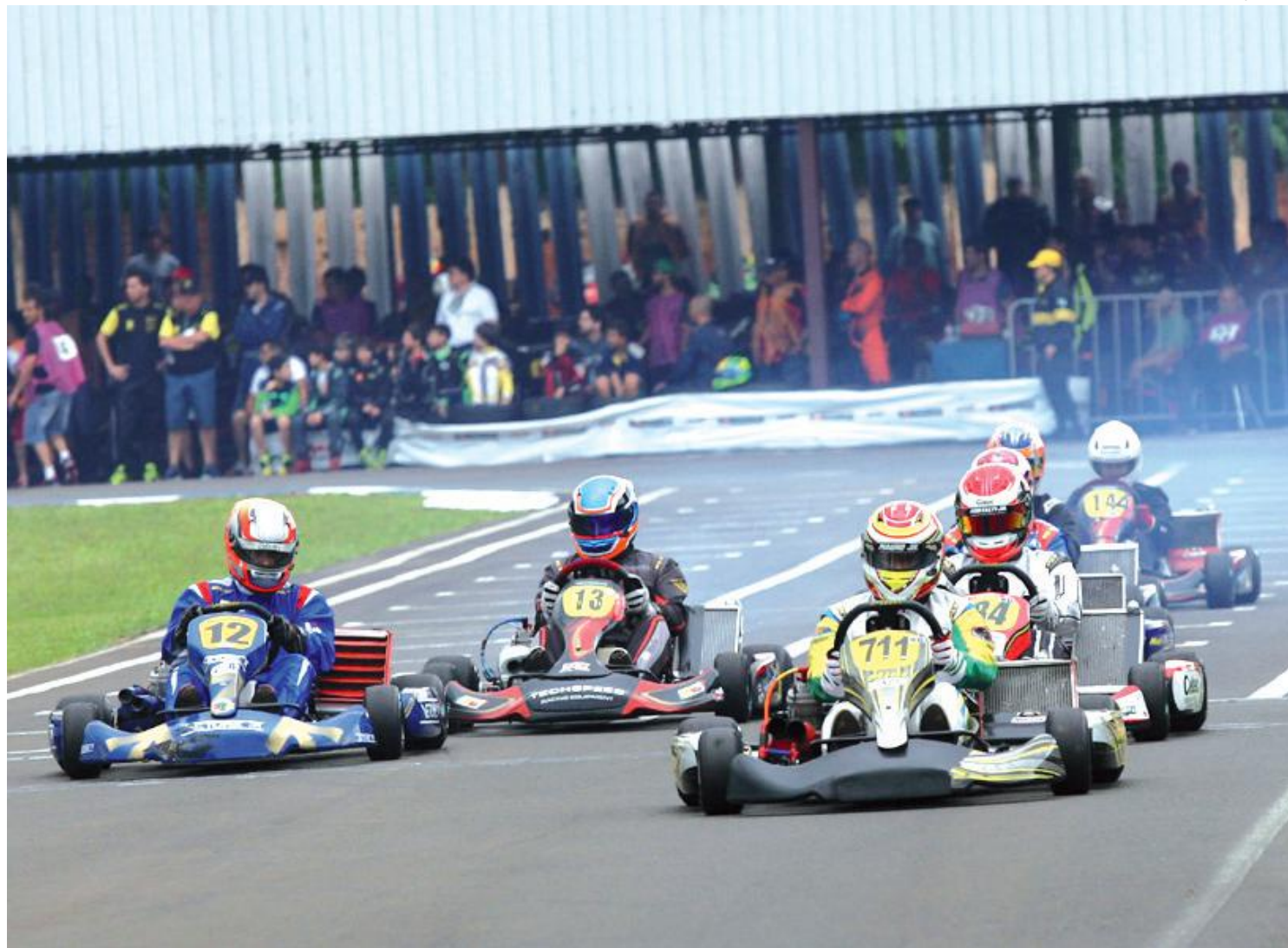
Os pilotos da categoria Sênior B disputam o Paranaense Light na 125 Master

Com a realização de treinos livres a partir das 8h, começa hoje a programação oficial da etapa de abertura do Campeonato Paranaense Light de Kart, no Kartódromo Luigi Borghesi, em Londrina. A prova será amanhã e será também Open do Campeonato Sul-Brasileiro, marcado para Londrina, de 28 a 31 de março.