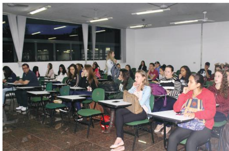
Salas de aula lotadas para o início do ano letivo