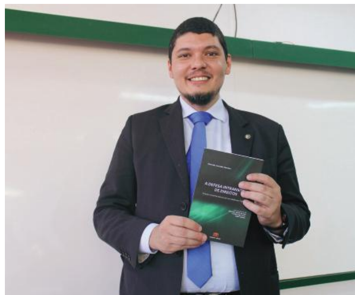
O Defensor é autor do livro “A Defesa Intransitiva de Direitos: Ácidos Inconformismos de um Defensor Público”

O módulo aconteceu em dois finais de semana. Nos encontros, o professor tratou do referencial teórico e denunciou o que considera uma mentalidade autoritária. “Não é com mais cadeias que vamos ter mais segurança. O Brasil tem a tercei-