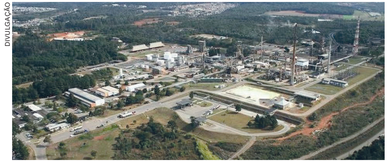
Unidade de Industrialização do Xisto de São Mateus do Sul

Kaefer vai mais além e diz que a proposta levou muito tempo para se tornar realidade, porque a própria Petrobras, o sistema, o governo,