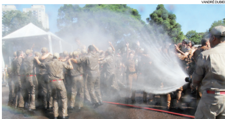
Formatura foi encerrada com o tradicional “batismo” dos novos soldados

Segundo Garcez, os novos soldados irão atuar em equipes de radiopatrulha e em unidades especializadas, como a Rotam (Ronda Tático Motorizada) e a Rocam (Ronda Ostensiva com Apoio de Motocicletas). “Eles vão completar o efetivo que estavam faltando em algumas cidades e fortalecer os grupos de policiamento em Cascavel”.