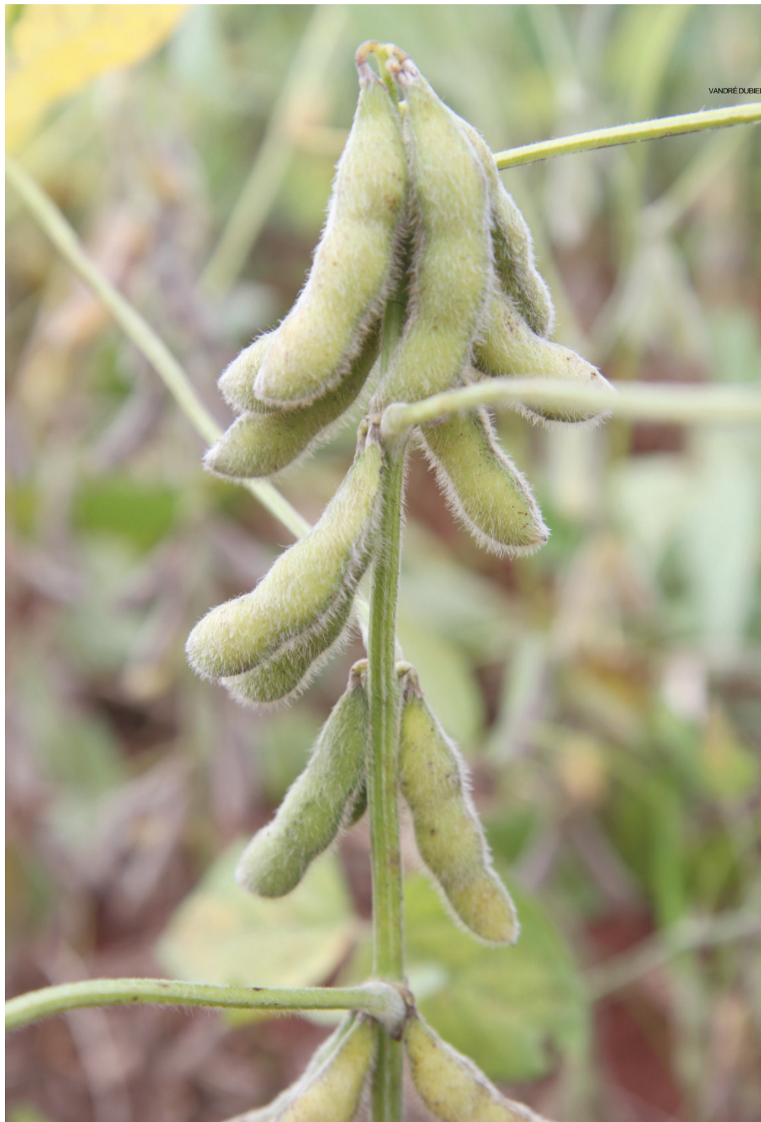
Parte das lavouras da oleaginosa está quase pronta para ser colhida

Conforme o técnico, a colheita para quem plantou soja e milho, a colheita do segundo cereal deve começar um pouco mais tarde. “A prioridade é para a soja, já que o milho é uma