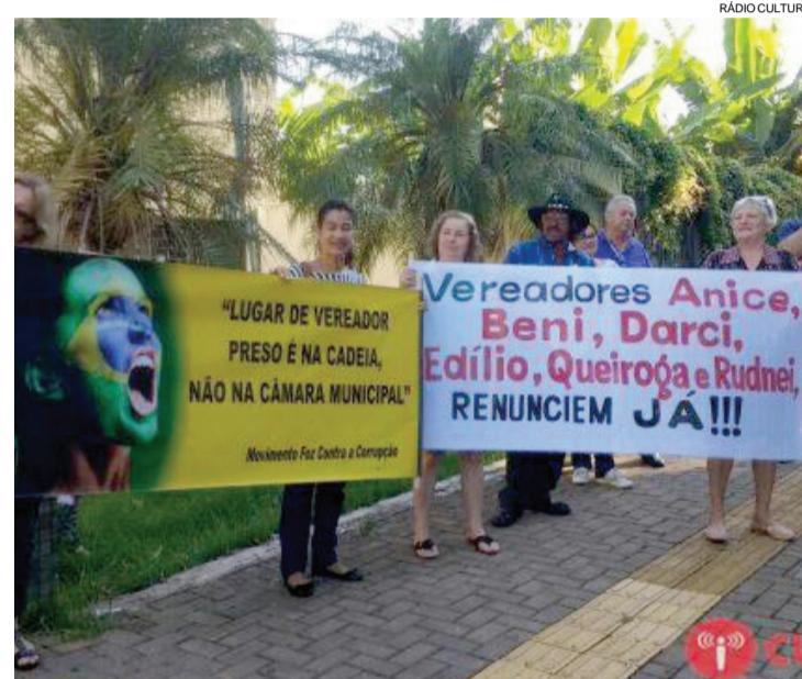
O protesto mobilizou dezenas de moradores de Foz do Iguaçu

deles temporariamente (por cinco dias) e os demais preventivamente (sem prazo para libertação). Cinco deles foram reeleitos e apelaram à Justiça para tomar posse a voltar imediatamente à prisão a fim de não perder o direito ao mandato conquistado nas urnas.