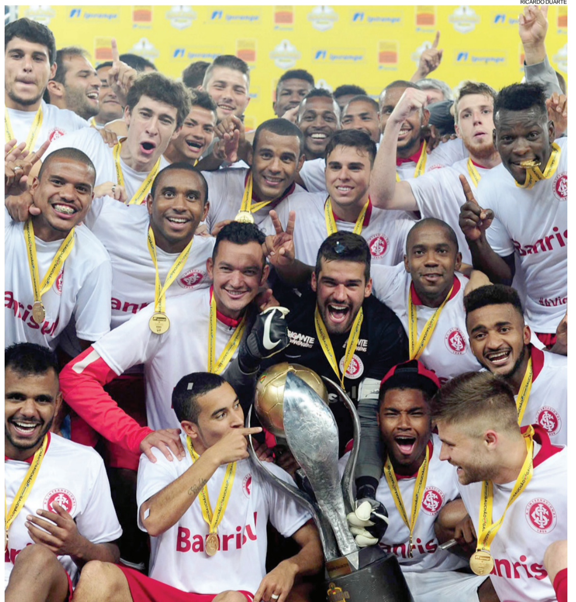
Jogadores colorados comemoraram o sexto título seguido em 2016