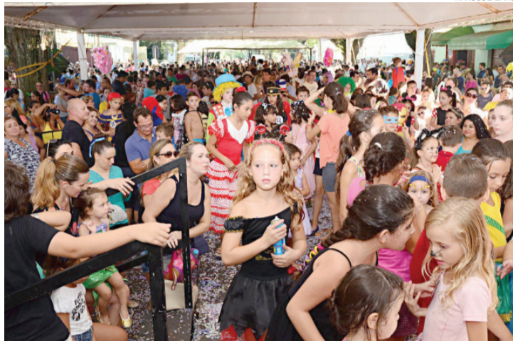
Carnaval da Saudade será realizado nos dias 26 e 28 de fevereiro, na Avenida Marechal Deodoro