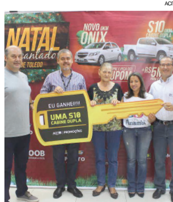
Diretores da Acit com a ganhadora da caminhonete