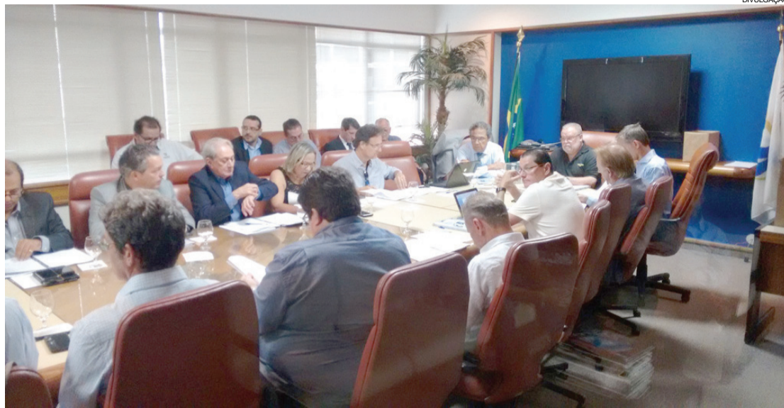
Da sala de reuniões, os presidentes de federações definiram os caminhos do automobilismo nos próximos quatro anos