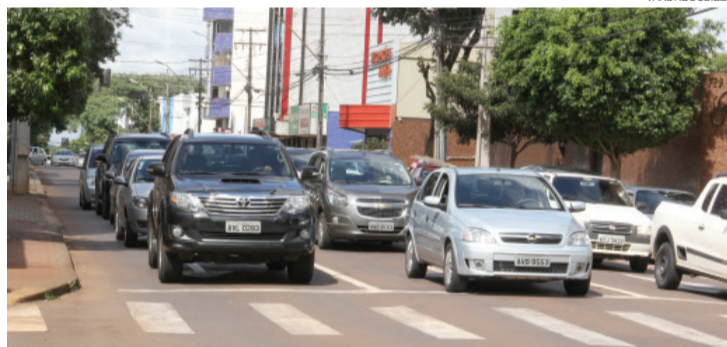
Queda estadual de emplacamentos supera média nacional de 20%

Entre as maiores quedas percentuais estão as cidades de São José das Palmeiras, que viu o número de emplacamentos encolher 50% de um ano a outro, Boa Vista da Aparecida (48%), Iracema do Oeste (47%) e Ibema (44%). Há ainda uma peculiaridade nos dados fornecidos pelo Detran. Em Diamante d'Oeste nenhum veículo foi adquirido até novembro do ano passado. Em 2015, foram apenas 18.