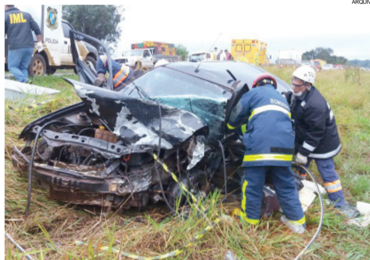
Apesar da alta, o resultado ainda é 16,2% inferior em comparação a 2014

14,2% foram de pessoas nesta faixa etária. Pessoas 60 anos ou mais representaram 12,3% das vítimas. Em seguida, aparecem pessoas das faixas etárias 35-39 anos (11,6%) e 25-29 anos (10,1%).