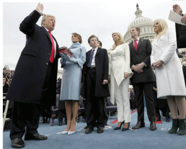
Trump chegando para a posse, na qual fez um discurso agressivo

somos brancos, pardos ou negros, nós sempre acreditamos no mesmo sangue dos patriotas. Nós temos as mesmas glórias e liberdades, e saudamos a mesma bandeira americana", declarou.