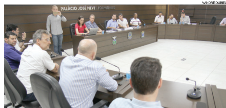
O debate sobre o Plano Diretor foi realizado no plenário da Câmara