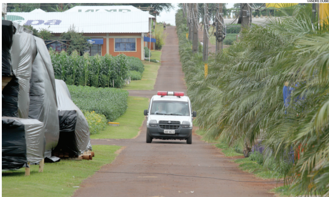
Estrutura do parque está praticamente pronta para receber visitantes e expositores