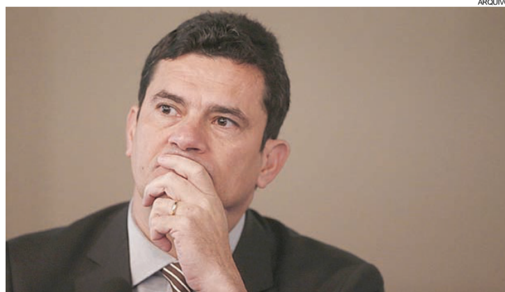
Para Moro, a morte de Teori representa uma perda irreparável

condolências e solidariedade de todos os procuradores da República”, afirmou a Associação em nota oficial.