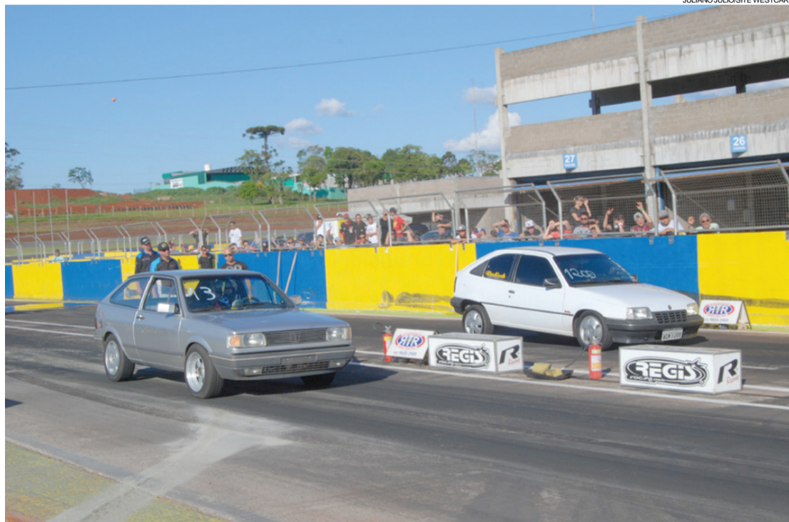
O Desafio de Arrancada de amanhã abrirá a temporada de velocidade em Cascavel

credenciais de boxe, R$ 20. As inscrições agora serão somente na secretaria da prova e custarão R$ 100 para motos e R$ 200 para carros.