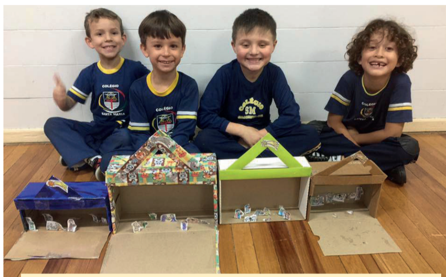
Alunos do 1º ano I do Colégio Santa Maria durante atividade realizada no fim do ano passado