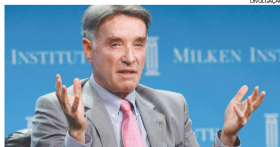
Empresário Eike Batista

Um mandado de prisão internacional será pedido pela Polícia Federal à Interpol para o empresário, com cumprimento imediato. Uma das hipóteses é que Eike Batista tenha usado um passaporte alemão para deixar o país. De acordo com o delegado Tácio Muzzi, a informação de que ele estaria fora do país só chegou ao conhecimento da PF na madrugada de ontem. A polícia apura se houve vazamento da operação.