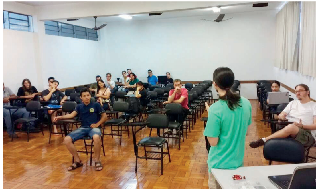
Alunos são divididos em grupos para participar do desafio

oportunidades e campos de trabalho para os profissionais que atuam na área de tecnologia da informação".