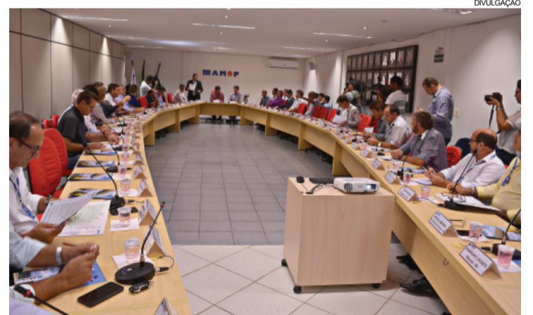
A reunião de ontem teve a participação de mais de 90% dos filiados