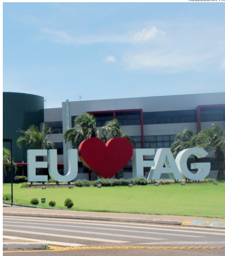
Aulas acontecem na mesma infraestrutura do Centro Universitário FAG

O curso tem duração de dois anos (divididos em quatro semestres) e visa formar profissionais aptos para analisar a viabilidade de propostas de investimentos, fontes de captação - curto e/ou longo prazo -, capital próprio ou de terceiros, com a capacidade aprimorada de interpretar os reflexos das políticas cambiais no capital financeiro e outras atividades que devem ser da alçada de um tecnólogo em gestão financeira.