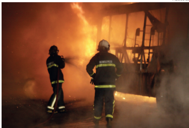
Criminosos obrigaram passageiros a descer e depois atearam fogo no ônibus

Testemunhas do atentado foram até a 15ª SDP (Subdivisão Policial) para fazer o reconhecimento dos suspeitos, mas não houve confirmação da participação da dupla no crime.