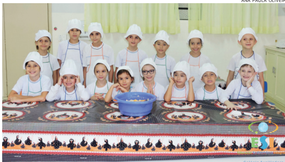
Alunos do Período Integral do ESI Auxiliadora posando pra foto durante aula de culinária