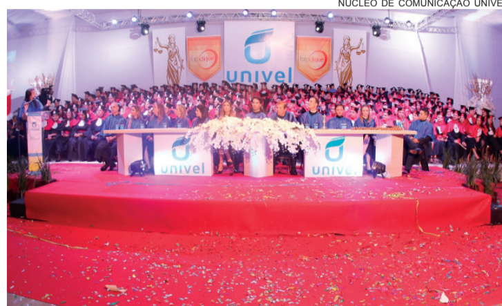
Referência na formação de novos profissionais de Direito, Univel também se destaca em aprovações na OAB

Confira lista de aprovação no Exame de Ordem Unificado em: http://s.conjur.com.br/dl/aprovacao-xx-exame-ordem.pdf