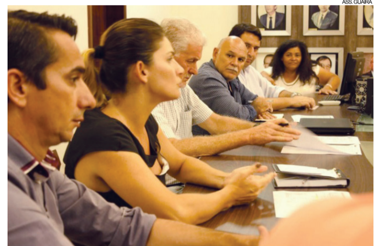
Encontro para debater reajuste ocorreu na quarta-feira