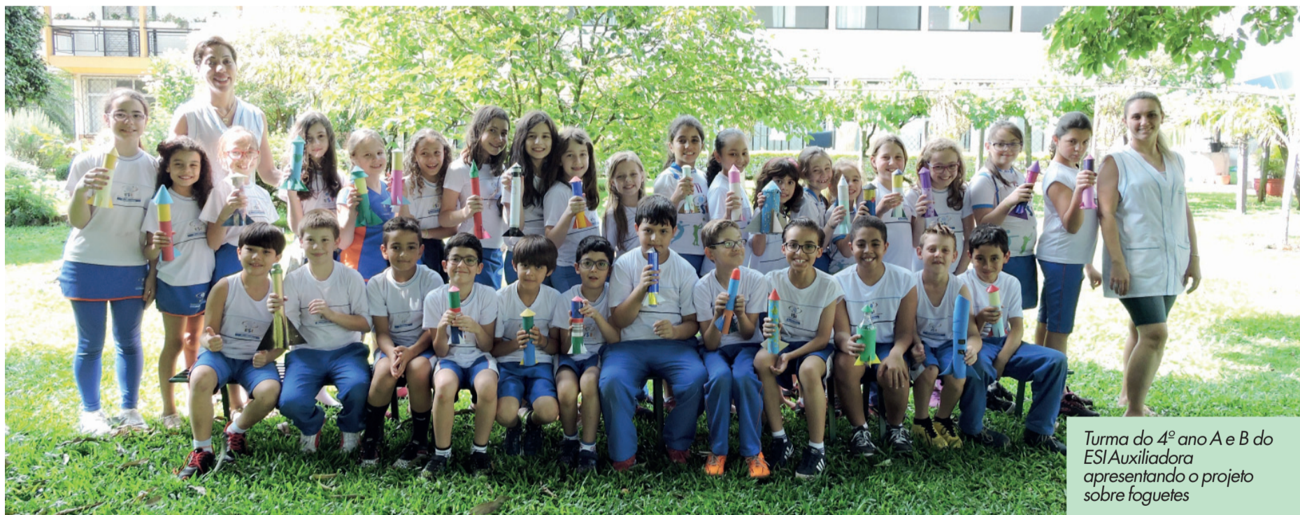
Turma do 4º ano A e B do ESI Auxiliadora apresentando o projeto sobre foguetes