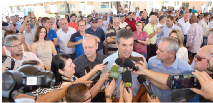
Governador Beto Richa: mais dignidade e melhor qualidade de vida