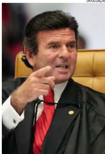
O ministro do STF, Luiz Fux

O presidente da Câmara, deputado Rodrigo Maia (DEM-RJ), disse ontem que vai esperar a decisão do plenário do STF sobre a tramitação do projeto do pacote anticorrupção. Para ele, a decisão do ministro Luiz Fux foi "uma interferência do Poder Judiciário no Legislativo", mas garantiu que não vai criticar nem desobedecer a decisão judicial.