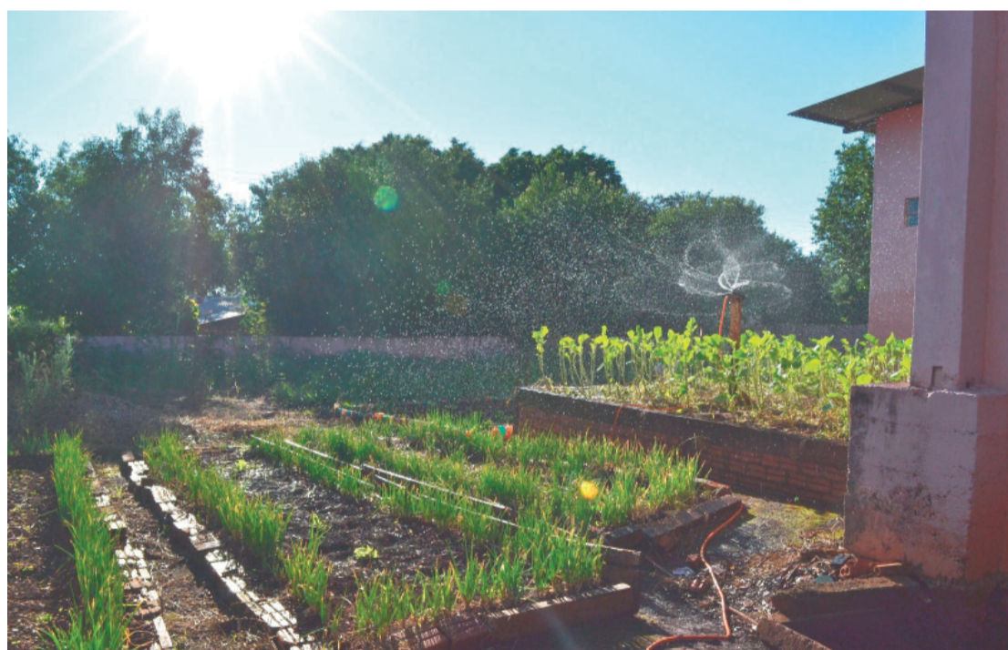
Projeto Ajuda na irrigação da horta

Você está contribuindo para transformar o mundo em um lugar melhor para se viver? Há muita gente tentando, com atitudes que parecem simples, mas que podem gerar bons resultados.