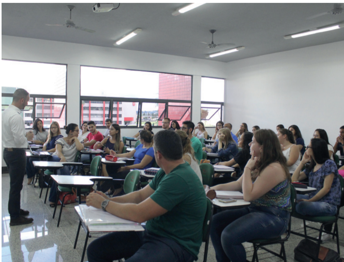
As salas ficaram lotadas já no primeiro dia