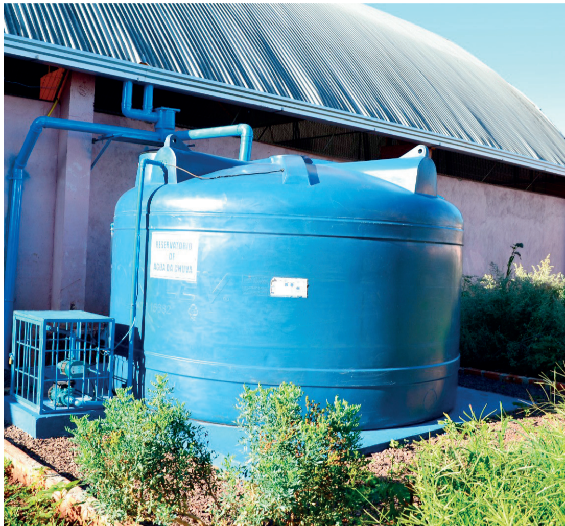
Instalada na horta do colégio, cisterna tem capacidade para 10 mil litros