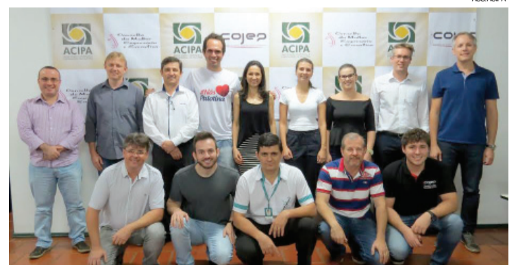
Frazão com a camiseta da campanha e membros da nova diretoria

Expo-Palotina, Feira Ponta de Estoque, Prêmio Acipa de Excelência, campanha de prêmios e promover cursos e treinamentos.