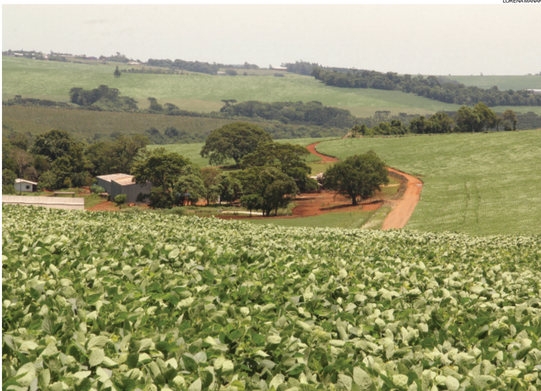
Área cadastrada em Cascavel representa quase 1% de tudo o que já foi registrado no PR

Os índices positivos do Estado colocam Cascavel no ranking dos dez melhores resultados até o momento. O município ocupa a oitava colocação referente ao número de imóveis cadastrados no Paraná, com 3.375 propriedades já regularizadas. O montante é quase 1% de todos os cadastramentos feitos no Estado desde o início da obrigatoriedade, em 2014.