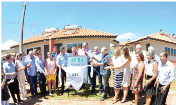
Líderes durante entrega das moradias: emoção e realização de sonho

“Avançamos com obras de habitação nos 339 municípios do Estado, realizando o sonho de milhares de pessoas. São mais de 70 mil casas no meu governo contra 18 mil nos 8 anos do governo anterior. Não dá para comparar. E fizemos isso porque a grande maioria da nossa gente espera uma vida inteira para concretizar esse sonho. No caso de Santa Terezinha, temos um grande prefeito parceiro que consegue vencer a crise e mostrar uma gestão eficiente e de resultados”, disse o governador.