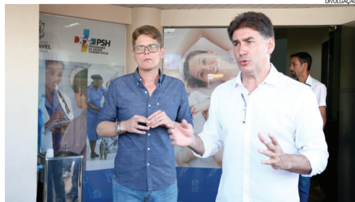
Paranhos entregou ontem uma pequena ampliação da UPA Brasília

que deverá receber cinco novos consultórios, uma sala para pré-consulta e sanitários com acessibilidade. O projeto arquitetônico já está pronto e prevê a edificação de mais 395 metros quadrados.