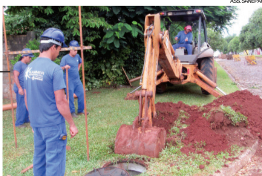
Obras são realizadas pela Sanepar em praticamente todo o Estado

Brasil. “Apesar das dificuldades e das crises econômicas que restringiram o volume de recursos disponíveis, nossa empresa mantém a constância de novas obras para os sistemas de água e esgoto, que se refletem na maior oferta de serviços”, destacou.