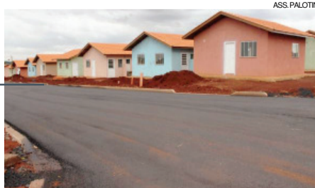
Casas foram construídas em parceria com Cohapar e Caixa

O prefeito Jucenir lembra que recentemente os moradores foram contemplados com meio-fio e instalação de calçadas nos passeios. Em Palotina, mais de 470 famílias já foram beneficiadas com construções de moradias urbanas, rurais e titulações de imóveis.