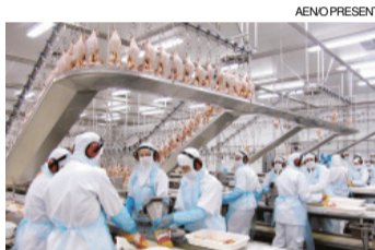
Maioria dos municípios do Oeste tem as exportações baseadas na produção de frango