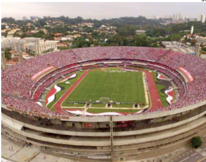
São Paulo enfrentará o Mirassol hoje, às 19h30, no Morumbi

O Palmeiras, por sua vez, jogará amanhã, quando desafiará o Linense, às 17h no Estádio Fonte Luminosa, em Araraquara.