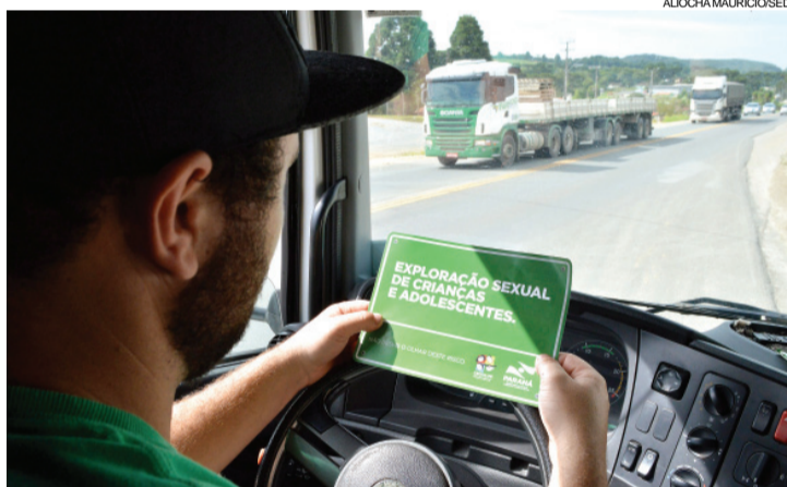
No Paraná, foram identificados 179 pontos vulneráveis à exploração sexual de crianças e adolescentes em trechos de rodovias federais

Para denunciar, basta ligar para o número 181 - Disque-Denúncia, serviço do Governo do Estado. A ligação é gratuita e pode ser feita de qualquer município do Paraná. O atendimento ocorre 24 horas por dia, todos os dias da semana, com garantia de sigilo das informações e de quem faz a denúncia.