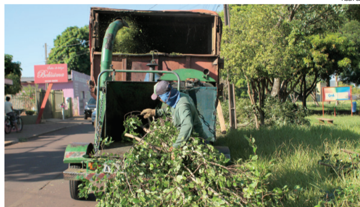
O trabalho segue cronograma previamente agendado

A população do Porto Meira pode levar materiais descartados, exceto eletrônicos e restos de obras, para os eco pontos espalhados pelo bairro e identificados com adesivos. O lixo deve ser depositado nos pontos mais próximos da residência.