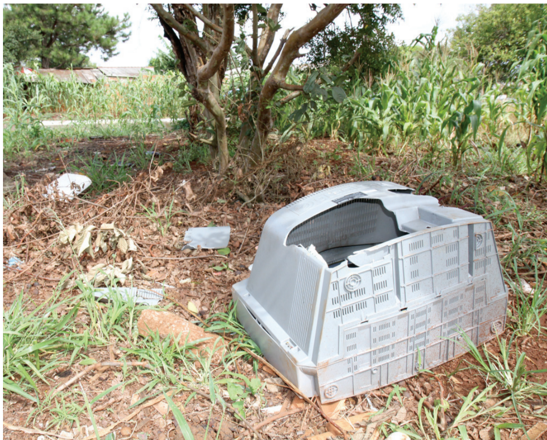
Deixar lixo jogado na rua é uma das principais formas de disseminar focos do Aedes aegypti

O boletim informativo mostra que, desde agosto de 2016, o Paraná já contabiliza 13 casos de febre chikungunya e três confirmações de zika vírus. Em Cascavel, não há nenhuma confirmação das duas doenças, com registros apenas de 79 e 109 notificações, respectivamente.