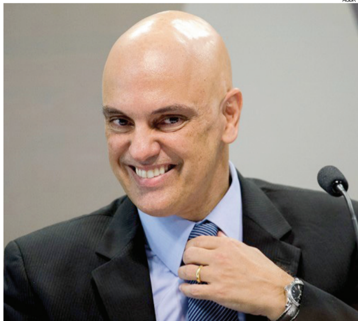
O nome de Moraes recebeu aprovação tranquila no Senado

vor político, citando como exemplo o ministro Edson Fachin.