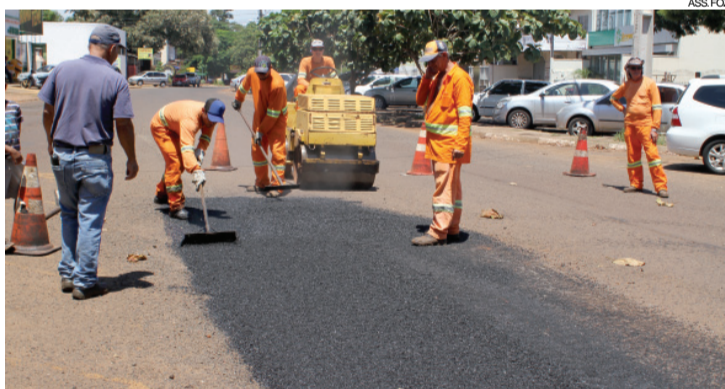
Os bairros já atendidos são a Vila C, Conjunto Libra, Vila Portes, Morumbi, Jardim Manaus e Centro

cidade e depois seguimos para outra que apresenta problemas. Estamos aumentando a cobertura do trabalho em função da quantidade de reparos que era necessário executar desde o ano passado”, completou. Nascimento destaca que até agora apenas um buraco apresentou problema dos quatro mil cobertos. Isso ocorreu no momento em que a equipe