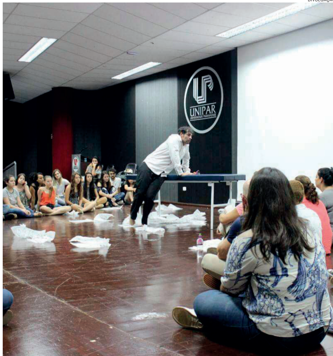
Peça de teatro Personagens Esquecidos foi proposta para o Trote Solidário