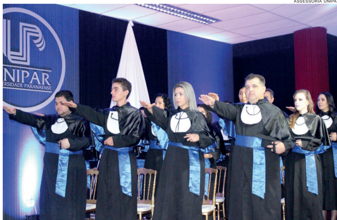
Formandos fazem juramento profissional