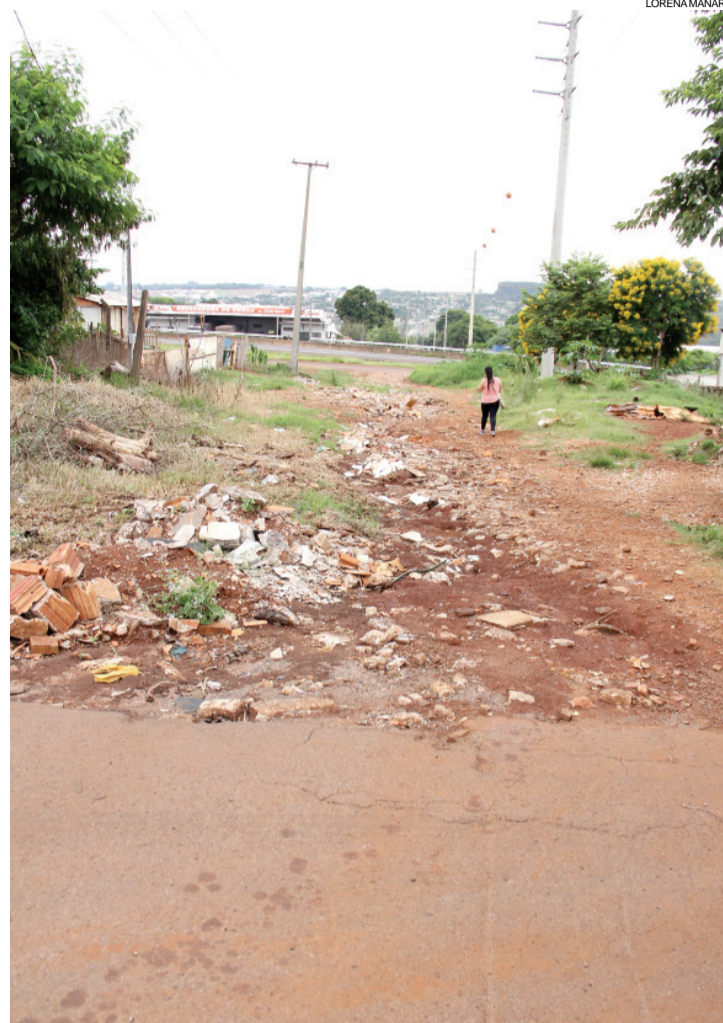
Poeira com o sol e lama com a chuva, essa ainda é a realidade de muitos cascavelenses

As demais ruas em que nada foi feito até agora são: União, João Mioto e José Bartnik no bairro 14 de Novembro e as ruas Brasília e Leão Ianoski no Cataratas, todas sob responsabilidade da Kartal; a rua Mylla, no Pioneiros Catarinense, sob responsabilidade da Pinheiro Marmelleiro, e as ruas Vereador José de Oliveira, Guaíba, Serra Grande e Jacob Bandoлин, cuja licitação foi vencida pela João P.B. Ferreira.