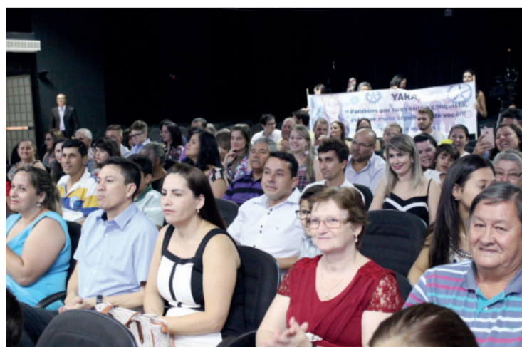
Familiares e amigos comemoram formatura