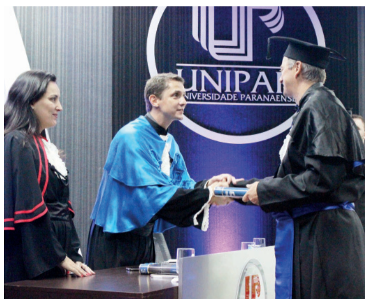
Novos profissionais das áreas de gestão e de marketing são diplomados