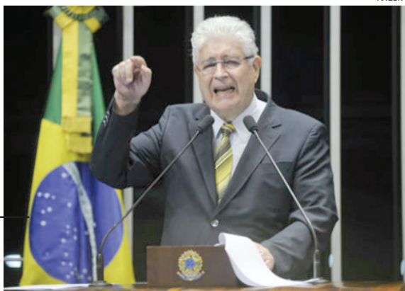
Senador Roberto Requião