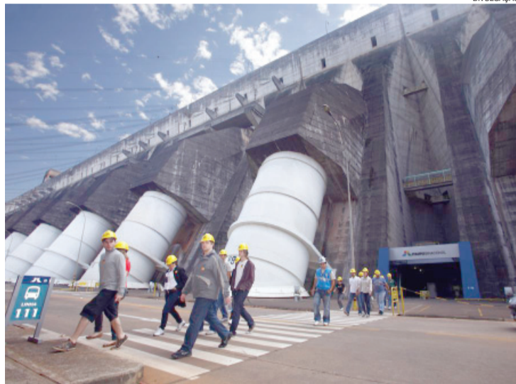
O turismo na Usina de Itaipu é um dos focos da campanha

A estreia será na ação Iguaçu tem a maior queda por você, que será realizada em Curitiba, no próximo dia 14. Esse mesmo espetáculo será levado para várias outras capitais. Paralelamente, também será desenvolvida a ação "Iguaçu Food Trip!", voltada para o mercado paranaense.