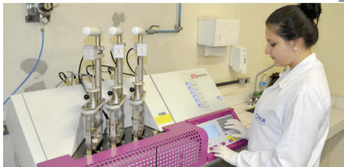
O Tecpar tem uma das melhores tecnologias do País