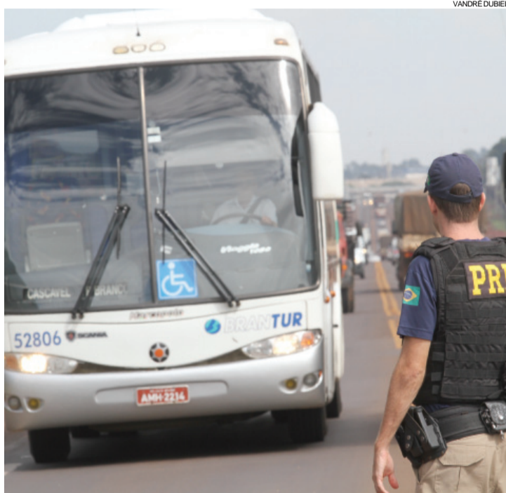
Somente no fim do ano e no feriado de Carnaval 50 pessoas morreram nas estradas do Paraná

A Operação Rodovida foi desenvolvida pela PRF em parceria com o Dnit (Departamento Nacional de Infraestrutura de Transportes), ANTT (Agência Nacional de Transportes Terrestres), ministérios da