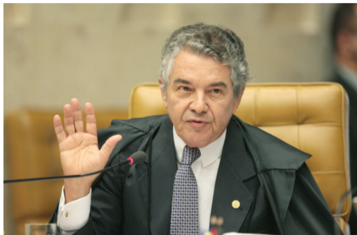
Marco Aurélio mantém parada ação da União contra esses privilégios

questionando tais privilégios proposta pela União tramita desde 2010 no STF (Supremo Tribunal Federal), mas até agora não foi submetida ao plenário pelo relator ministro Marco Aurélio de Mello.