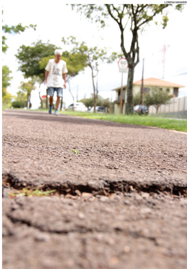
População reclama de ondulações e buracos na ciclovia

Apesar de grandes investimentos não estarem previstos, antes do início das obras do PDI, algumas melhorias deverão ser feitas. "Esses pontos mais críticos, que comprometem a trafegabilidade dos ciclistas, serão corrigidos em breve", afirma a Secretaria de Comunicação da prefeitura.