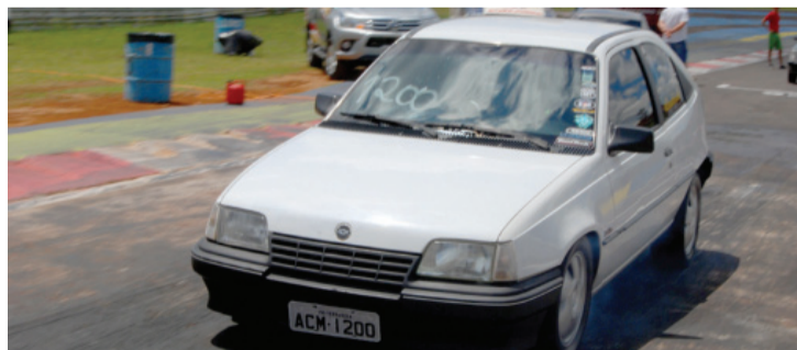
Thiago Wagner, de Terra Roxa, está confirmado na etapa de abertura do Metropolitano de Arrancada de Cascavel

rão em disputa as categorias Força Livre, 6,5 Segundos, 7 Segundos, 7,5 Segundos, 8 Segundos, 8,5 Segundos, 9 Segundos, 9,5 Segundos e 10 Segundos.