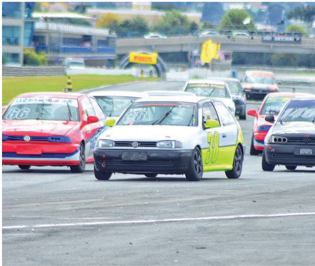
A categoria Marcas vai à pista curitibana com a expectativa de belas disputas

etapa do Metropolitano, também serão realizadas provas da Motovelocidade.