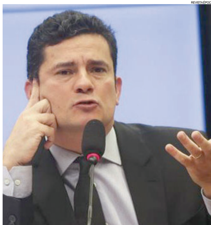
A manifestação de Moro foi feita ainda no mês de abril

público apenas agora, mas já tinha sido assinado em abril, antes das recentes decisões do STF (Supremo Tribunal Federal) que liberaram presos da Lava Jato.