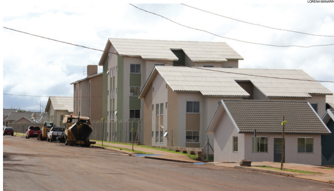
No conjunto Gralha Azul foram construídos 248 apartamentos e 249 casas

Cascavel - A entrega de 777 unidades habitacionais pelo Programa Minha Casa, Minha Vida da Prefeitura de Cascavel está prevista para o fim deste mês de maio.