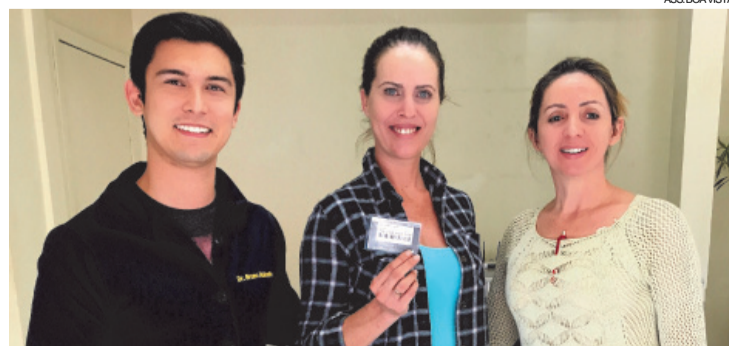
Secretaria comprou plastificadora para facilitar emissão do cartão, que leva só alguns minutos para ficar pronto

O cartão também informa a quantidade de pessoas atendidas pelo SUS e respectivas áreas médicas. Em Boa Vista da Aparecida, os documentos exigidos para fazer o documento são CPF e comprovante de residência, e para as crianças é necessária a apresentação da Certidão de Nascimento.