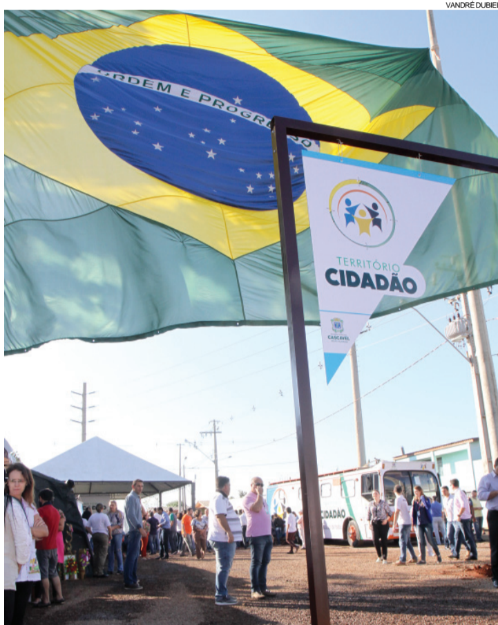
Território Cidadão II foi instalado próximo à Escola Municipal Francisco Vaz de Lima, no Bairro Interlagos

Estruturas ao lado do Território Cidadão II, como o Centro da Juventude, escola e Cmei serão referências para o programa e auxiliarão nas atividades. “O programa também prevê estação de cidadania, mas no Interlagos ela será construída ao lado do terminal nordeste”, destaca o coordenador executivo.