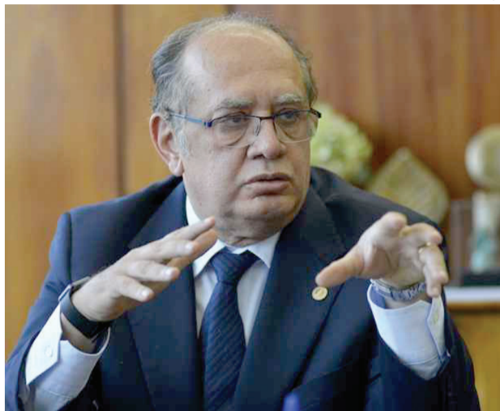
Ministro Gilmar Mendes vê muito açodamento nas homologações

JBS], como envolve o presidente da República, certamente vamos ter que discutir o tema no próprio plenário”, justificou.