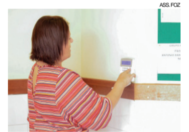
Escolas e Cmeis estão entre principais alvos de bandidos

O município possui cerca de 300 imóveis para a realização de segurança. São 37 Cmeis e 52 escolas municipais, mas também estamos reforçando a segurança nos postos de saúde e em todos os imóveis do município. Atualmente, 140 agentes formam o efetivo responsável por atender os prédios, entre escolas, postos de saúde e parte administrativas, realizando rondas patrimoniais 24 horas.