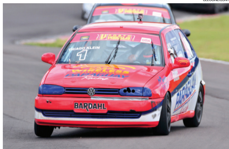
Thiago Klein, que colecionou títulos no ano passado, estreia amanhã no Brasileiro de Turismo 1.600

ção muito difícil porque reunirá os melhores pilotos do País”, frisa Thiago.