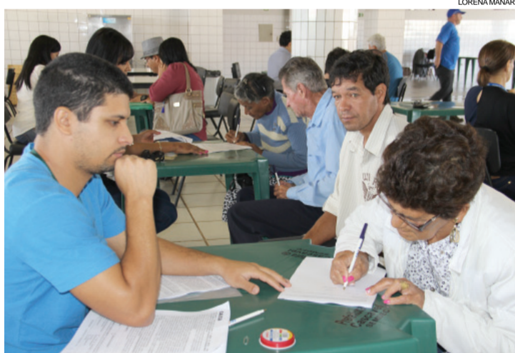
Famílias contempladas pelo Programa Minha Casa, Minha Vida assinaram contratos com a Caixa Econômica Federal

R$ 270, dependendo da renda bruta familiar. O prazo para quitação é de dez anos.