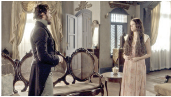
Thomas pede que Domitila continue sendo sua aliada. Diara termina seu artigo. Jacira tenta se desculpar com Piatã. José Bonifácio dá um presente para Leopoldina. Dom Pedro se encontra com Domitila. Thomas exige que Anna fale de seus sentimentos por ele.

Novo Mundo Dom Pedro implora que Domitila não vá embora. Francisco avisa a Thomas que seu plano deu certo. Pedro dá uma casa para Domitila. Leopoldina e José Bonifácio jogam bilhar. Lurdes defende a princesa das ofensas de Patrício. Domitila se frustra ao acordar e não encontrar Dom Pedro. Jacira não gosta dos conselhos que recebe de Ferdinando. Joaquim questiona Germana sobre Jacinto. Wolfgang se preocupa com a permanência dos escravos fugitivos em sua casa. Piatã se irrita com a cobrança que Ubirajara lhe faz por causa de Jacira. Liu conta para Anna que viu Joaquim a observando.