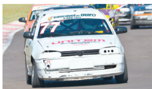
Eduardo Weirich foi o vitorioso da categoria Turismo 1.600 Carburado