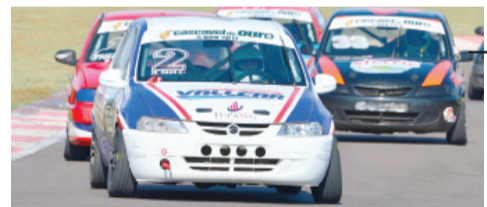
Em mais um final de semana perfeito, Edoli Caus Júnior venceu de ponta a ponta