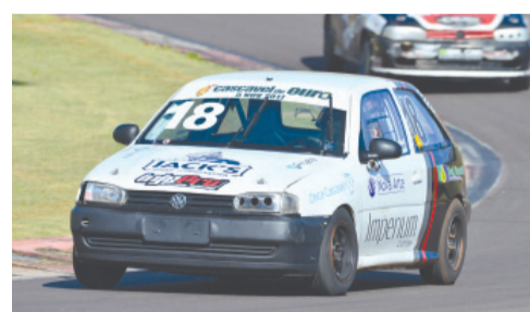
Gabriel Formentão segue dominando a categoria Turismo 1.600 Injetado