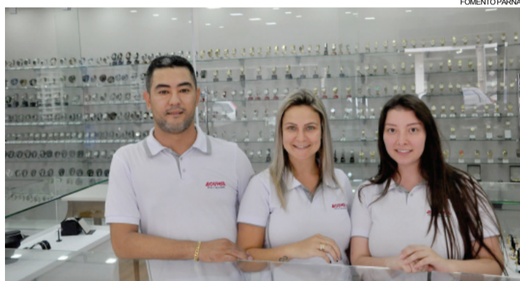
Ótica Gouveia, em Toledo, empresa com 12 anos de atividade e que teve a loja modernizada com a ajuda da Fomento Paraná