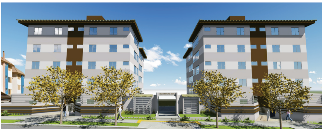
CONDOMÍNIO RESIDENCIAL JAUÁ