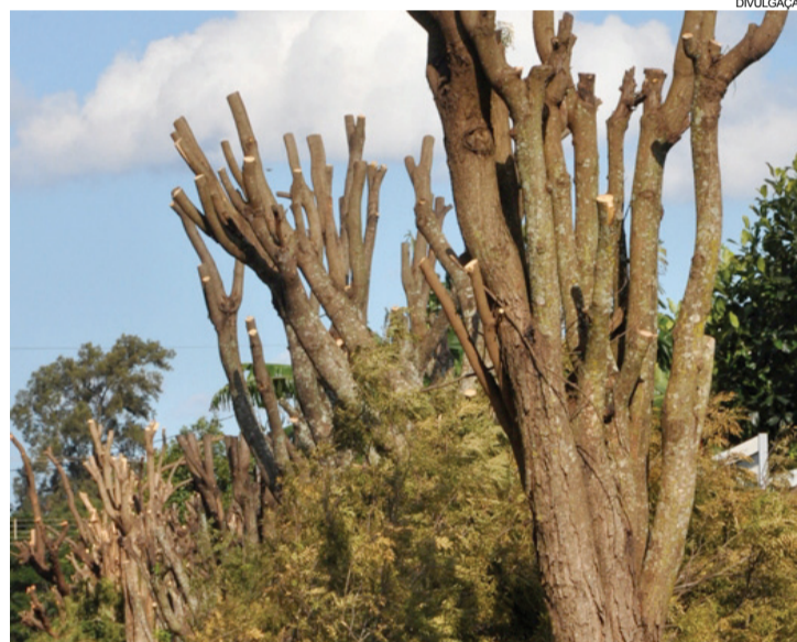
Poda de árvores precisa contar com uma orientação técnica

e Meio Ambiente que vistoriará a árvore a que se refere a solicitação, para avaliar a real necessidade da derrubada, corte ou poda. Para solicitar este serviço, a população deve entrar em contato pelo telefone (45) 3541 0375 ou comparecer pessoalmente a secretaria localizada na Rua Manoel Moreira Pena, 1510.