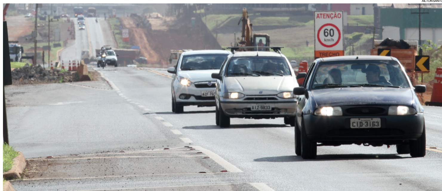
Duplicação da 277 em Cascavel encolhe e causa reação de líderes regionais