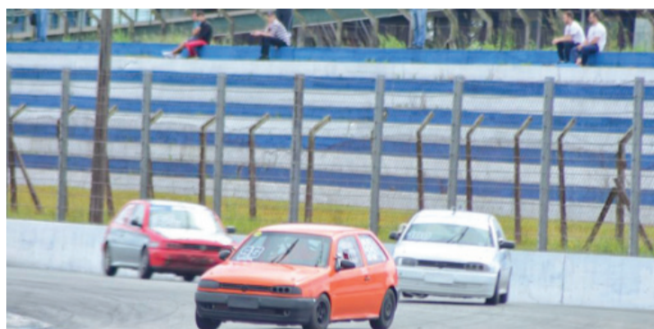
A Márcio Ymagava/Lucas Garbulha Inoue lidera a categoria Turismo e corre em casa