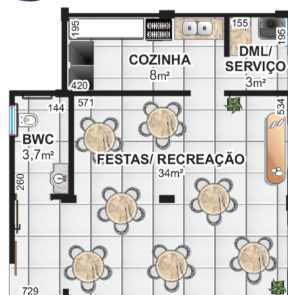
36 unidades residenciais 2 SALÕES DE FESTAS - 50m² + 50m²