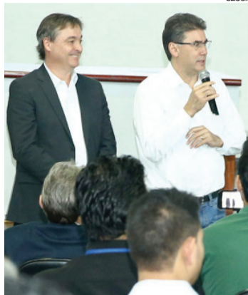
Renato Segalla, ao lado do prefeito Leonaldo Paranhos: números positivos

Segundo ele, a expectativa é arrecadar R$ 44 milhões em IPTU neste ano. A previsão atualizada da receita para 2017