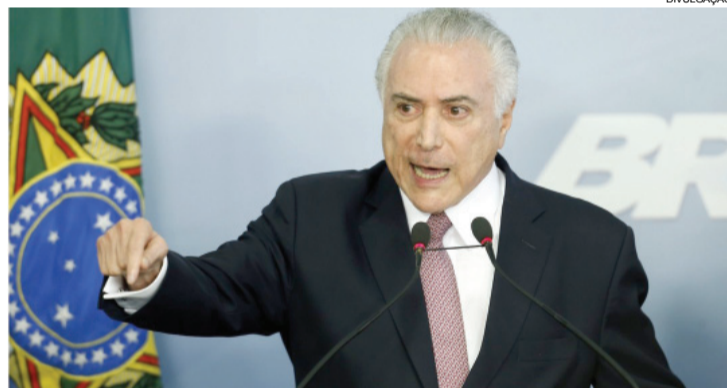
Presidente Temer: “Tenho orgulho de ser presidente. Não sei como Deus me colocou aqui”

“Tenho orgulho de ser presidente. Não sei como Deus me colocou aqui. Portanto, tenho honra de ser presidente, mas pelos avanços do meu governo e não permitirei que me acusem de crimes. [...] Não me falta coragem para seguir na reconstrução do País, e conchemos, na defesa da minha dignidade pessoal”, concluiu.