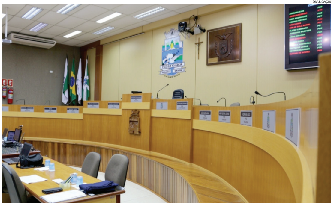
Plenário da Câmara de Foz do Iguaçu, onde o processo de cassação dos vereadores será julgado