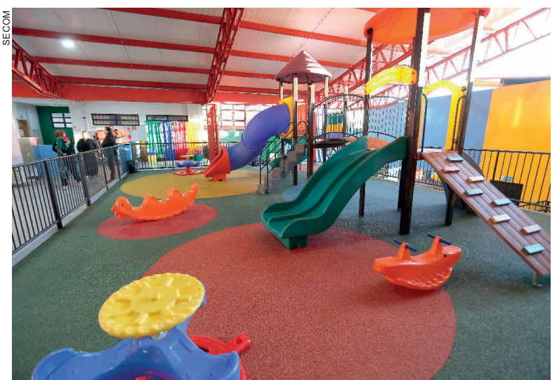
A unidade fica na região norte da cidade

Embora ontem tenha acontecido a inauguração oficial, desde o dia 22 de maio, já há