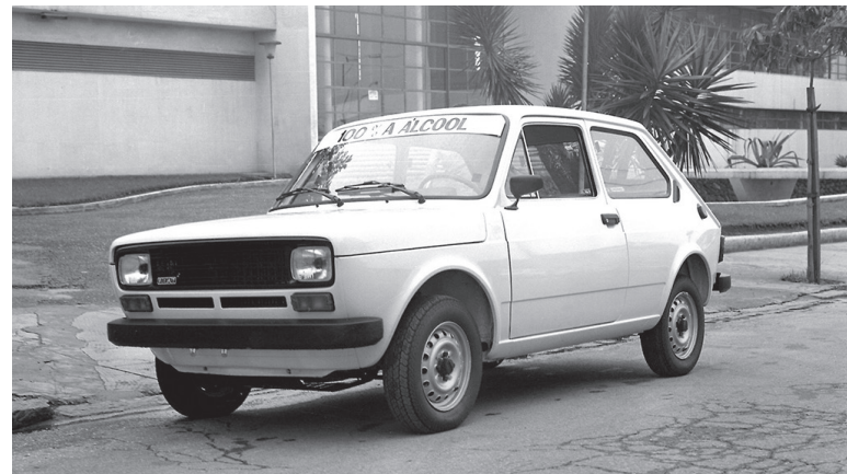
O Fiat 147 foi o primeiro modelo fabricado no Polo Automotivo de Betim e, também, o primeiro automóvel a etanol produzido em série no mundo

Em setembro de 1978, um Fiat 147 realizou o que seria o teste definitivo para a criação do primeiro motor brasileiro a etanol: uma viagem de 12 dias e 6,8 mil quilômetros pelo país, com média de mais de 500 km diários, três mil quilômetros por terra e variações climáticas superiores a 30 graus.