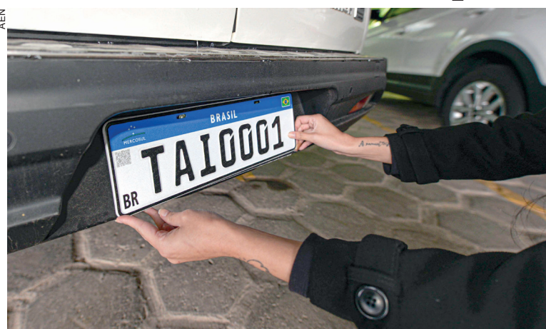
O Paraná realiza uma média de 21 mil emplacamentos mensais

Desde junho de 2023, o primeiro emplacamento de veículos no Paraná pode ser realizado de forma 100% online, pelo computador ou celular. Essa opção propicia agilidade e economia para os