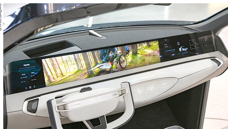
Novidade incorpora recursos de segurança, como avisos de ponto cego, cuidados com saúde e monitoramento de passageiros