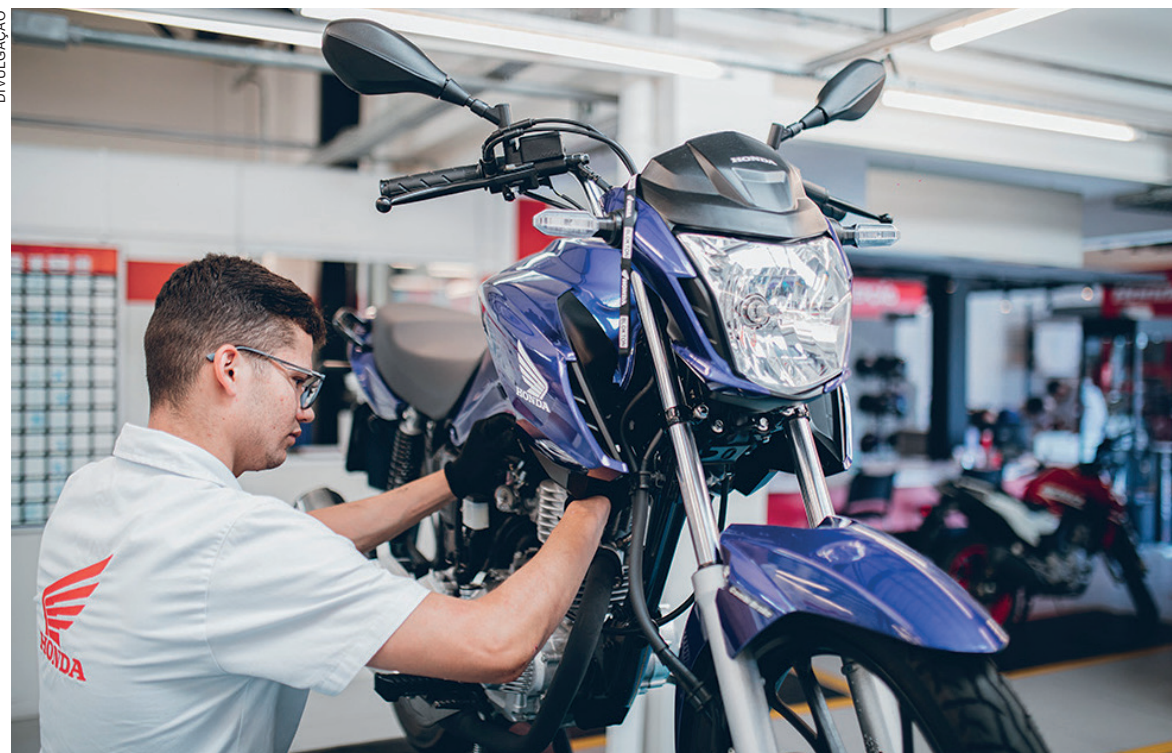
O método desenvolvido pela Honda ensina os cuidados básicos para manter em dia as boas condições do veículo, sem precisar ser um especialista em mecânica

Com o preço do combustível em constante alta, como o recente aumento de 7,11% na gasolina nas refinarias