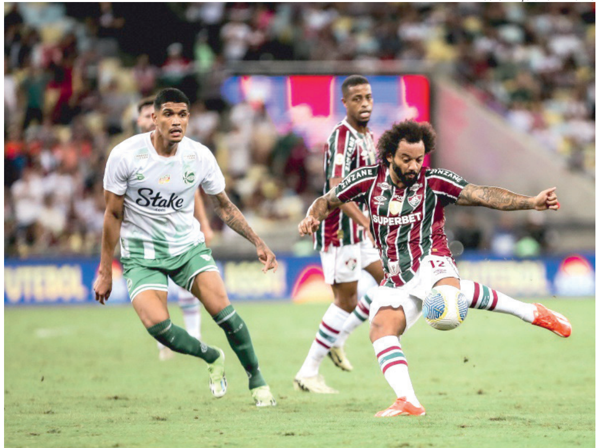
Juventude e Flu fecham semana da Copa do Brasil