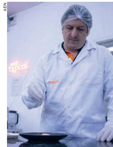
No Brasil é necessário comprovar que a população já consome esta espécie de fungo há mais de 25 anos

“O investidor está focado na venda e geração de receita e não em desenvolver a tecnologia, que é uma área de risco, mas essencial para qualquer negócio, especialmente em biotecnologia. Por isso, o investimento do Governo do Paraná aumenta muito a nossa competitividade porque nos possibilita crescer como indústria, e no fim gerar empregos e renda para o próprio Estado”, afirma o diretor.