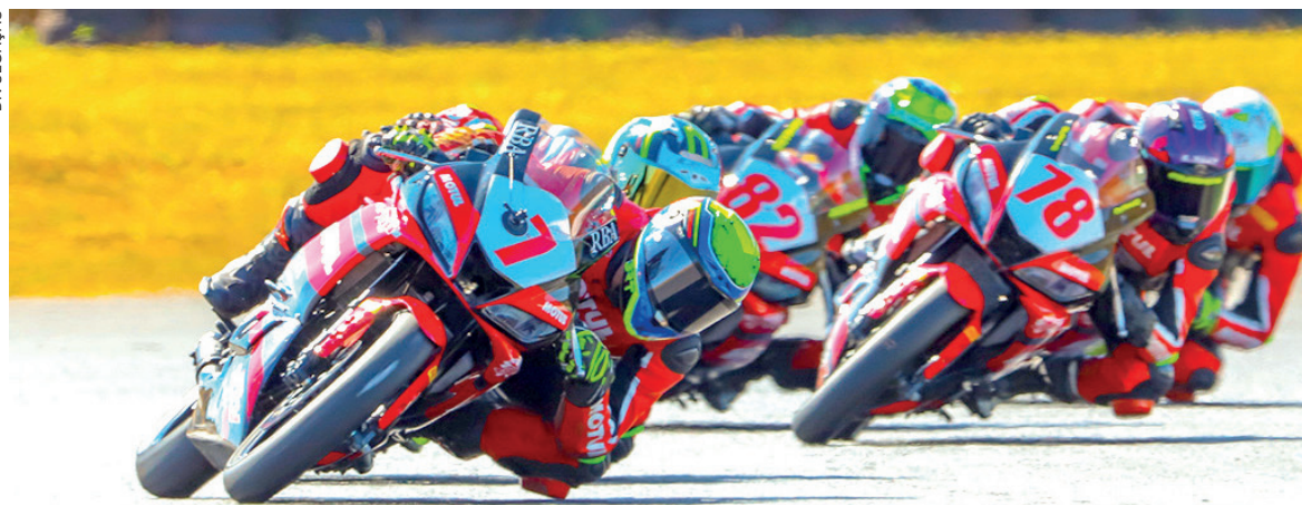
Primeira temporada monomarca da GP300 tem se mostrado a mais competitiva

Em seu primeiro ano como categoria monomarca, a Motul 300V Cup/GP300 tem se destacado pela competitividade das corridas, com disputas acirradas do início ao fim de cada prova. Esse equilíbrio é resultado da padronização técnica das motos, que são preparadas pelo Moto1000GP com subsídio e apoio técnico da Motul. As próximas corridas serão nos dias 17 e 18 de agosto, no GP Cascavel, no Autódromo Internacional Zilmar Beux de Cascavel, no Oeste paranaense.