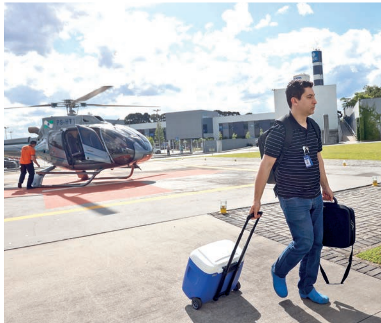
Cascavel teve 148 notificações e 57 doações

O Sistema Estadual de Transplantes conta com apro-