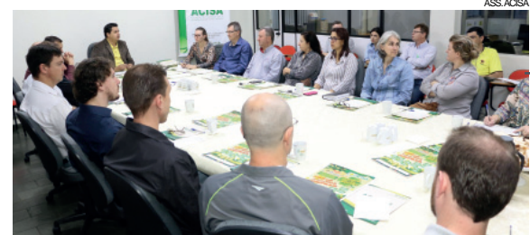
Evento que marcou o lançamento oficial da campanha

O lançamento da promoção foi nesta semana em reunião ordinária da Associação Comercial e Empresarial. O sorteio dos vales compras será dia 23 de dezembro, às 20h, na Praça Central.