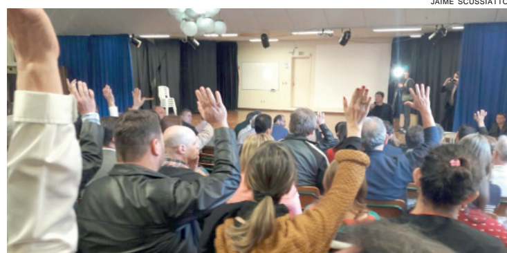
Assembleia em que os bancários de Cascavel aprovaram a proposta dos bancos e encerraram a greve

Sobre os acordos com o Banco do Brasil e a Caixa Econômica Federal, o comando nacional dos bancários negociou os mesmos índices da Fenaban (bancos privados) para as duas instituições públicas, tanto para este ano como para 2017, e também sobre o abono de todos os dias parados durante a greve.