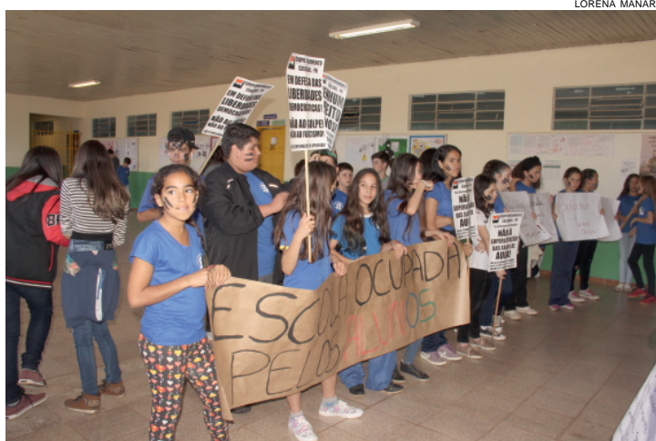
Protesto no Colégio Júlia Wanderley, ontem, em Cascavel, foi organizado pelo Grêmio Estudantil

Na região norte, estudantes dos Colégios Itagiba Fortunato, Francisco de Lima, Brazmadeira e Clarito, fecharam a Avenida Papagaios. Já os alunos do CEEP (Centro Estadual de Educação Profissional Pedro Boaretto Neto) fizeram uma passeata saindo do colégio até a prefeitura. Além das mudanças na educação, os estudantes manifestaram apoio aos professores da rede estadual, que já