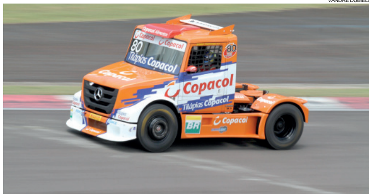
Competindo em casa, Pachenki foi o mais rápido nos dois treinos de ontem no Autódromo Zilmar Beux