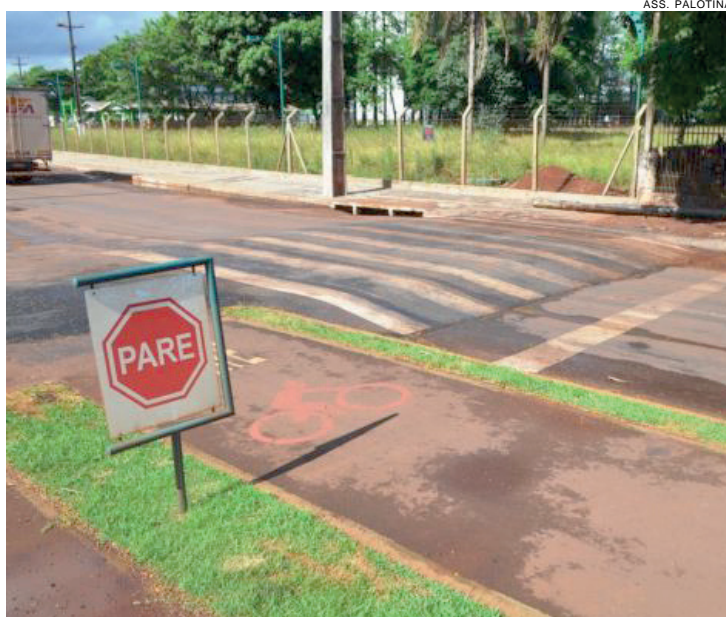
O recurso é empregado na avenida Presidente Kennedy

Atendendo a diversas solicitações de moradores, a Prefeitura de Palotina efetuou a instalação de quebra-molas em diversas ruas como forma de reduzir a velocidade dos veículos em locais de grande movimentação. Foram implantados três na rua Pioneiro, nos bairros Parque Mônaco e Pôr do Sol. Um na rua Á.