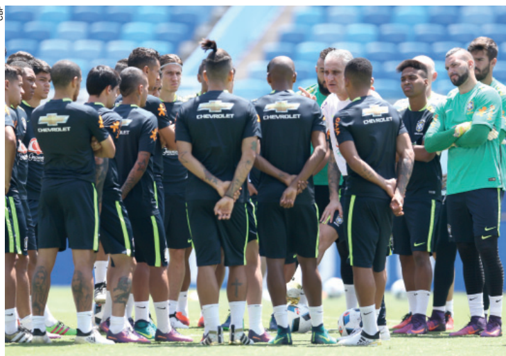
Técnico Tite tenta seguir com 100% de aproveitamento na seleção

A sequência de vitórias do Brasil fez a equipe saltar