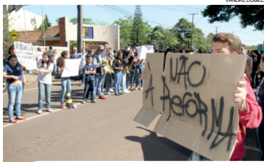
Em Cascavel, pelo menos sete colégios foram ocupados por estudantes