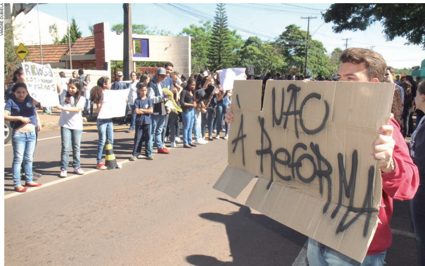
Em Cascavel, sete colégios estaduais tinham sido ocupados pelos estudantes até o fim da tarde de ontem

GARANTIA Cartas de aval reduzem em até 1% o juro às empresas