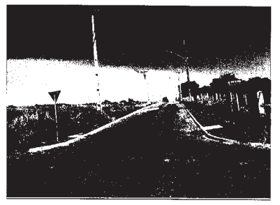
Sem mais, E o parecer,