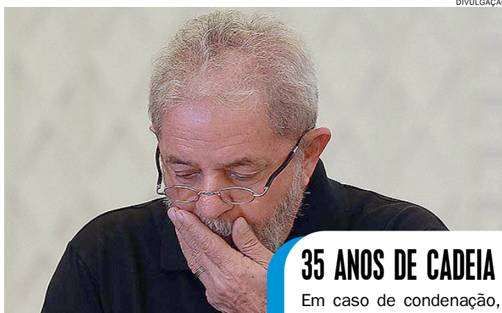
Nova denúncia contra Lula foi protocolada ontem na Justiça Federal de Brasília

ra." Os repasses foram feitos à empresa que traz as iniciais de Lula na logomarca, a LILS Palestras. Foi criada no alvorecer de 2011, menos de dois meses depois de Lula ter deixado a Presidência da República.