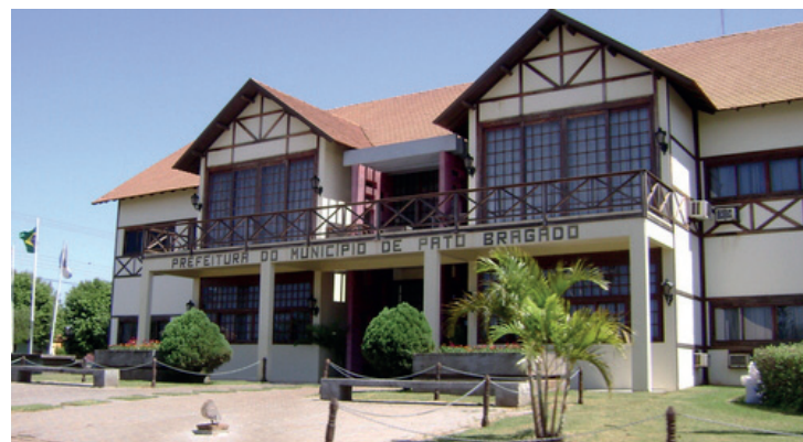
A pacata Pato Bragado, primeira colocada do Oeste paranaense

370 dos 399 municípios. O acréscimo paranaense está relacionado, entre outros fatores, ao incremento nos repasses do IPVA e do ICMS por parte do governo estadual.