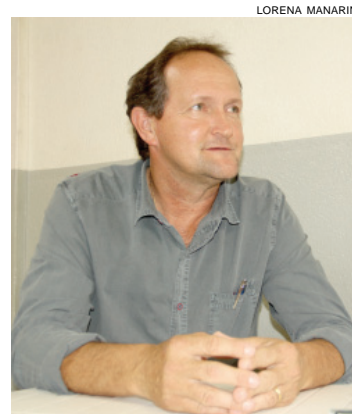
O prefeito eleito de Três Barras do Paraná, o peemedebista Hélio Bruning

com o envolvimento de todos. “O patrão é o povo. Temos de ouvi-lo e colocar em prática o que ele considera importante para que o município cresça, ofereça oportunidades e compartilhe prosperidade”. O prefeito eleito também vai priorizar a geração de empregos. Um dos caminhos para isso, afirma ele, será a construção de novos barracões industriais e de casas populares.