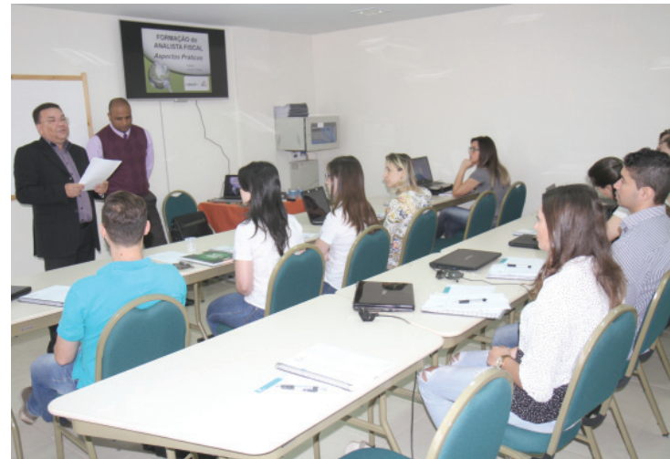
Curso ocorre na sala de treinamentos do Sescap-PR em Cascavel

litando a aprendizagem e a absorção de conhecimento.