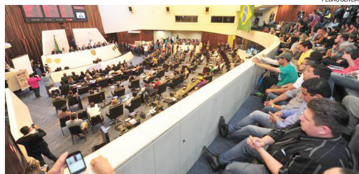
A audiência pública superlotou o plenário da Assembleia Legislativa

grande maioria", o juiz que se notabilizou no comando da Operação Lava Jato ressaltou que "ninguém tem a pretensão de apresentar isso como se fossem os dez mandamentos ou coisa que o valha".