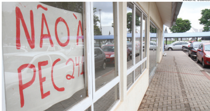
Protesto contra a PEC 241 ocorreu também na Uniãoeste

Já a greve dos professores da rede estadual segue hoje para o nono dia. De acordo com a Secretaria Estadual da Educação, apenas 2% das escolas estão totalmente paradas, o que representa 42 unidades; 21% funcionam parcialmente e 44% estão abertas normalmente. Os dois movimentos afeta aproxima-