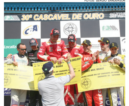
Além do troféus, os três primeiros colocados receberam premiação em dinheiro