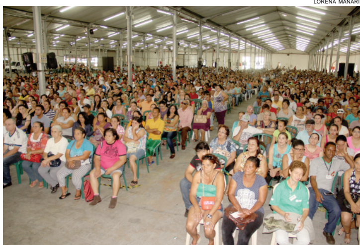
Sorteio das famílias do Residencial Riviera foi realizado ontem no Centro de Convenções e Eventos