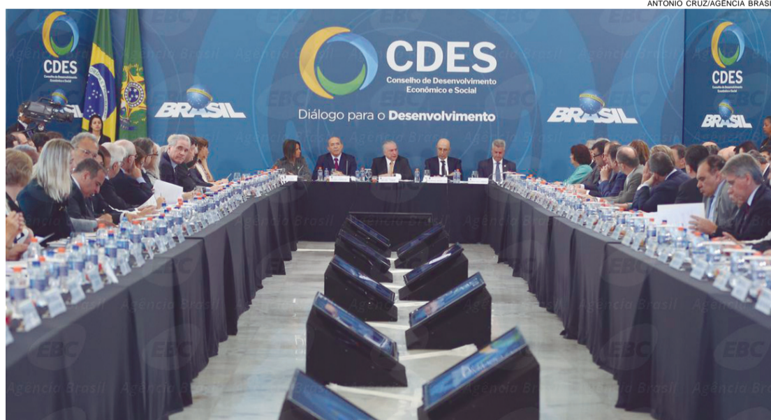
Reunião ontem do Conselho com o presidente Michel Temer, em Brasília

O empresário Abílio Diniz defendeu a PEC (Proposta de Emenda à Constituição) dos Gastos Públicos enviada ao Congresso Nacional pelo Executivo.