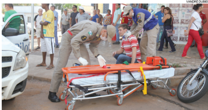
O acidente ontem na Avenida Brasil deixou uma pessoa ferida

Com a instalação de semáforos nos novos cruzamentos, a expectativa é de que os acidentes diminuam e o trânsito fique mais organizado. Segundo Denardin, alguns desses equipamentos entrarão em funcionamento em poucos dias. “Já fizemos um ofício à Copel e estamos aguardando que a ligação elétrica seja feita”, afirmou.