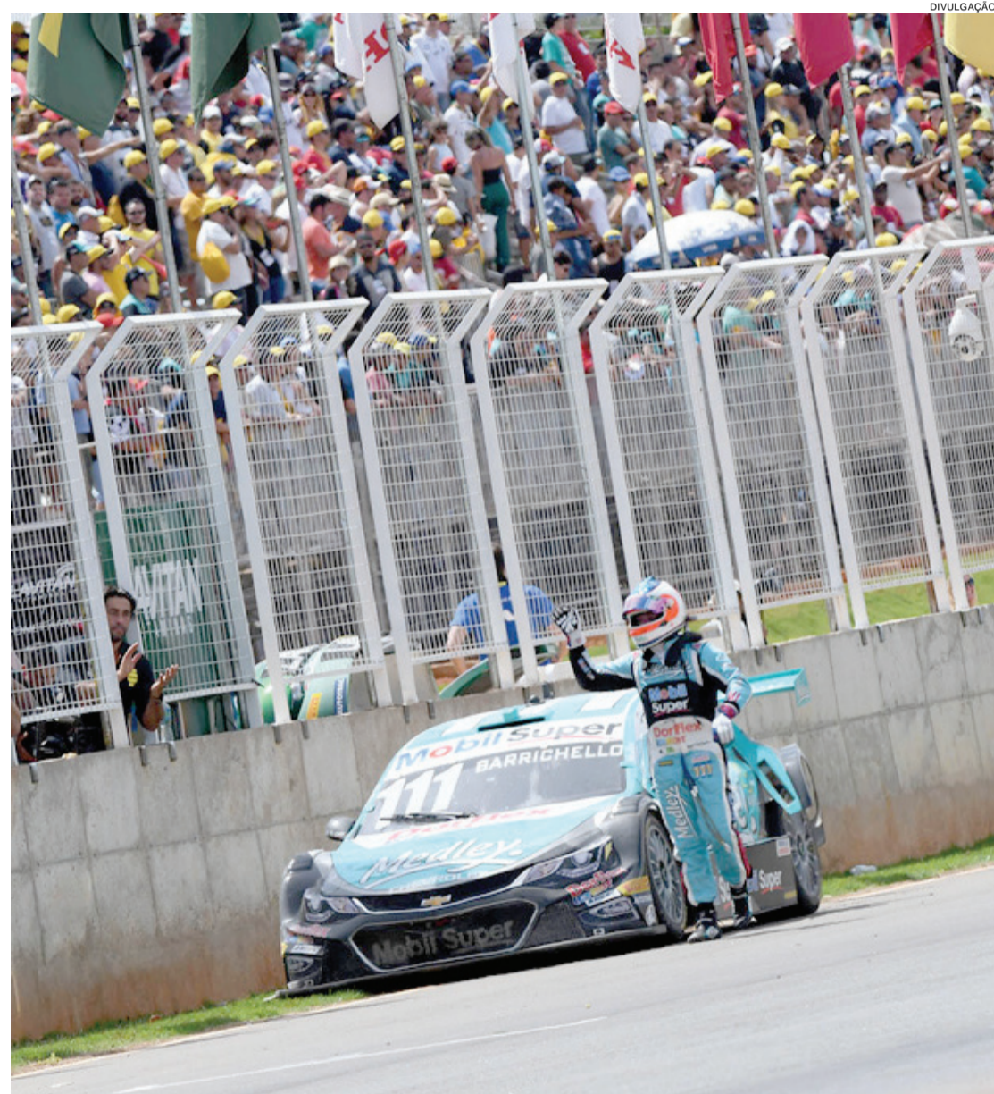
O carro de Barrichello ficou sem combustível a poucos metros da linha de chegada