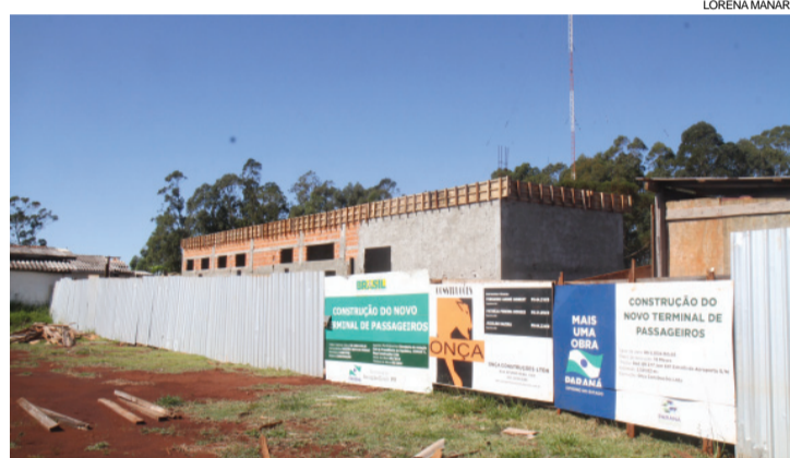
Construção do Terminal de Passageiros está parada há meses e só deve ser retomada no ano que vem