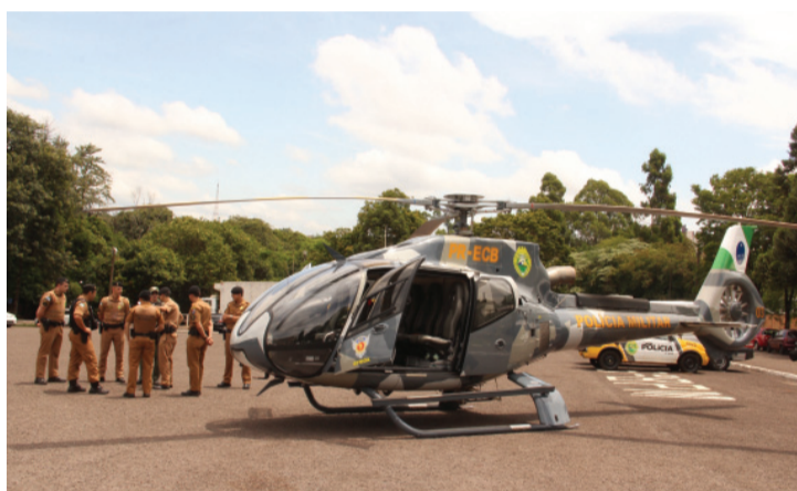
O uso da aeronave permite um campo de ação maior nas ações policiais