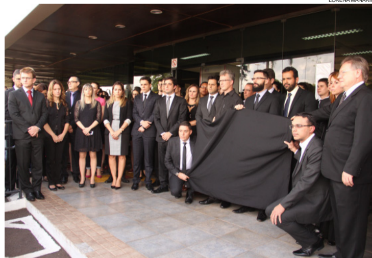
Juízes, promotores e servidores do Fórum de Cascavel no protesto

As autoridades entendem também que a mudança “é uma forma de retaliação” à Operação Lava Jato. Depois da fala dos juízes e promotores, foi feito um minuto de silêncio como forma de protesto.