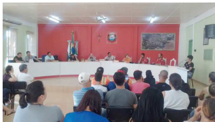
O assunto foi detalhado em encontro na Câmara de Vereadores

terrestre. A operação provoca pequenos tremores, necessários para a confiabilidade das leituras, que chegam a dez quilômetros de profundidade e a um raio de 14. Há reserva de vibrações de 15 mil metros antes e depois de áreas urbanas.