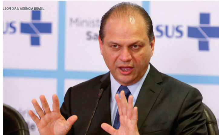
O ministro da Saúde, o paranaense Ricardo Barros