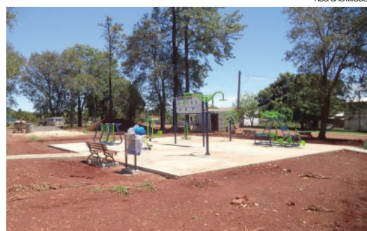
O investimento nas obras chega aos R$ 170 mil