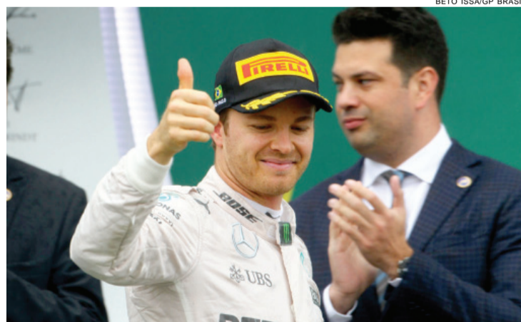
Nico Rosberg decidiu abandonar as pistas para atender pedido da mãe

atende um pedido da mãe, que tem medo de vê-lo nas pistas. "Minha mãe ficou muito feliz com minha decisão", declarou.