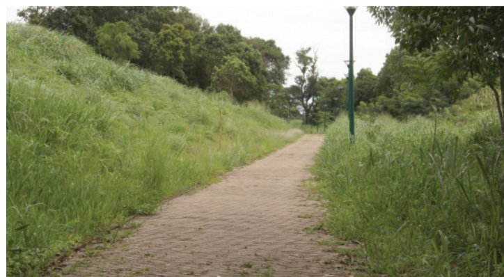
Alvo de vandalismo, Parque Paulo Gorski deve receber melhorias