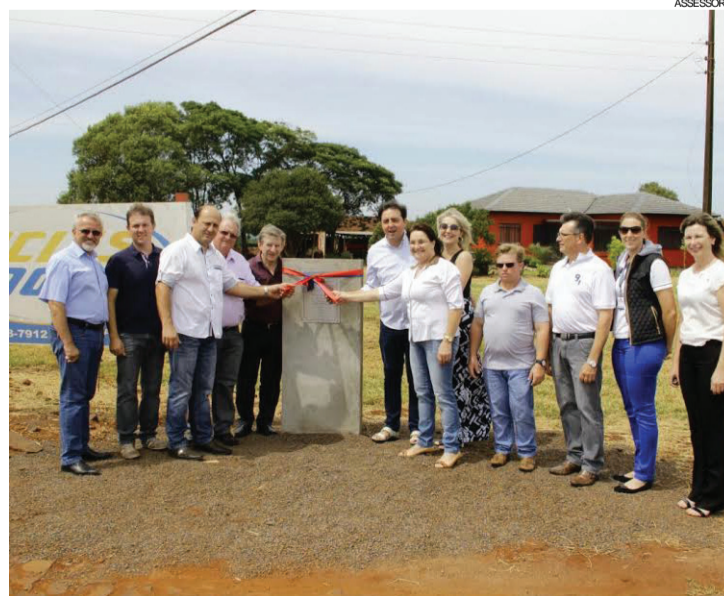
Líderes e moradores durante entrega de uma das obras

revitalização da Escola Municipal Getúlio Vargas, na sede municipal, e lançou a pedra fundamental da pavimentação poliédrica em estrada rural do distrito de Alto Santa Fé. Para essa pavimentação, Rusch conseguiu a liberação de recursos a fundo perdido do governo do estado, que somam R$ 238,5 mil. “São importantes investimentos, com recursos do governo do Paraná e do próprio município, proporcionando desenvolvimento e qualidade de vida à população”, observou o deputado estadual.