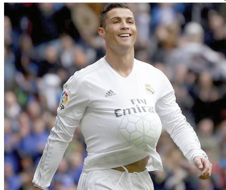
Mundial é o único torneio em que CR7 ainda não marcou pelo Real

na, outra da Copa do México e o clássico local. Antes disso eu não conhecia nada. Agora, tenho que ver bem nosso rival e decidir como jogar", reconheceu o técnico francês.