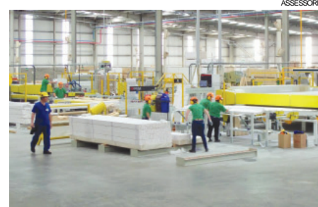
A fábrica opera em sinergia com a unidade de Quedas do Iguaçu, localizada a 180 quilômetros de distância