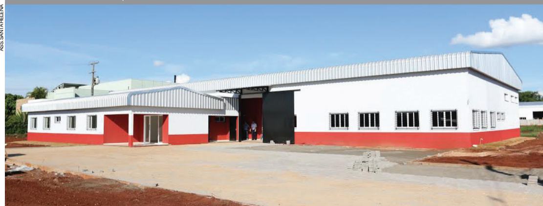
Barracão pré-moldado vai abrigar a indústria de confecções J A Fusinato e Cia Ltda, Tarifa Zero, no Parque Industrial IV, em Santa Helena. A obra de 800 metros quadrados contou com investimento de R$ 890 mil. A unidade vai chegar a 48 empregos diretos e 120 indiretos por meio de facções e lavanderias.