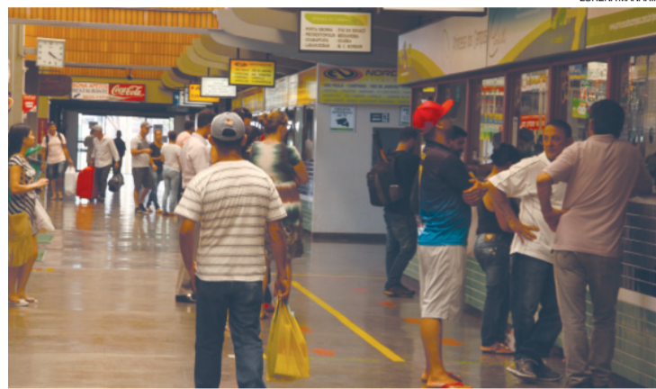
Movimento na rodoviária de Cascavel promete ficar ainda mais intenso a partir da próxima semana