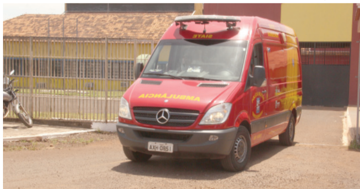
Vítima de queda no interior da PIC foi atendida pelo Siate

dimento) do Jardim Veneza. Não há informações sobre o incidente e nem se o homem seria interno ou funcionário da penitenciária.