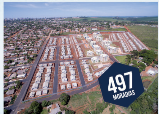
RESIDENCIAL GRALHA AZUL