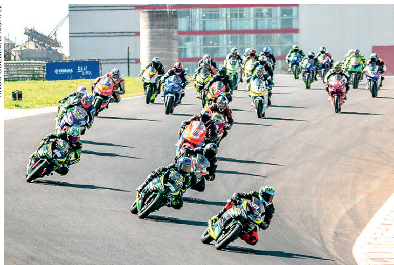
O Bacião é considerada uma das curvas mais desafiadoras do Brasil

O Moto1000GP, que é o Campeonato Brasileiro de Motovelocidade, segue todos os protocolos de segurança exigidos pela CBM (Confederação Brasileira de Motociclismo) e pela FIM (Federação Internacional de Motociclismo). O campeonato conta com o patrocínio da Yamaha, Motul, Pirelli e LS2, e o apoio da