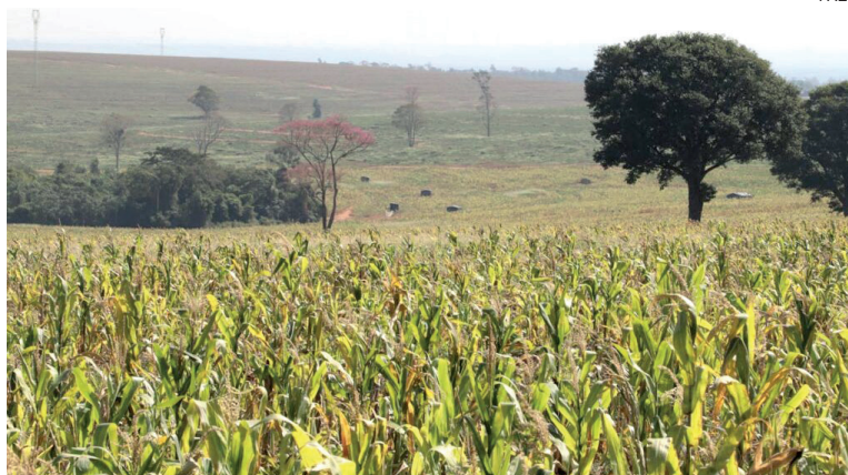
Invasores no Oeste seguem estruturando acampamentos e avançando nas propriedades invadidas

Essa primeira reunião teve a participação de representantes do governo, estado,