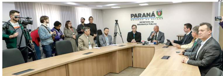
Entrevista coletiva realizada ontem na Secretaria de Segurança Pública, em Curitiba

Teixeira também atualizou o trabalho de identificação, que está sendo conduzido pela Polícia Científica de São Paulo. Todos eles já passaram pelo exame de necropsia. Até o fechamento desta edição, 15 haviam sido identificados e 12 liberados inclusive com certidões de óbito e seis deles já estavam em processo de translado. Em relação aos demais, ainda faltam