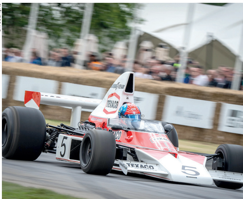
Em 1974, Emerson Fittipaldi tornou-se o primeiro campeão mundial de pilotos de Fórmula 1 da McLaren

A presença da McLaren no Monterey Car Week 2024 se concentrará em sua notável história nas corridas e em como o pedigree de Fórmula 1 inspira seus supercarros na comemoração do 50º aniversário de seu primeiro Campeonato Mundial de Fórmula 1 no The Quail, a reunião do esporte a motor, que acontecerá na próxima sexta-feira (16).