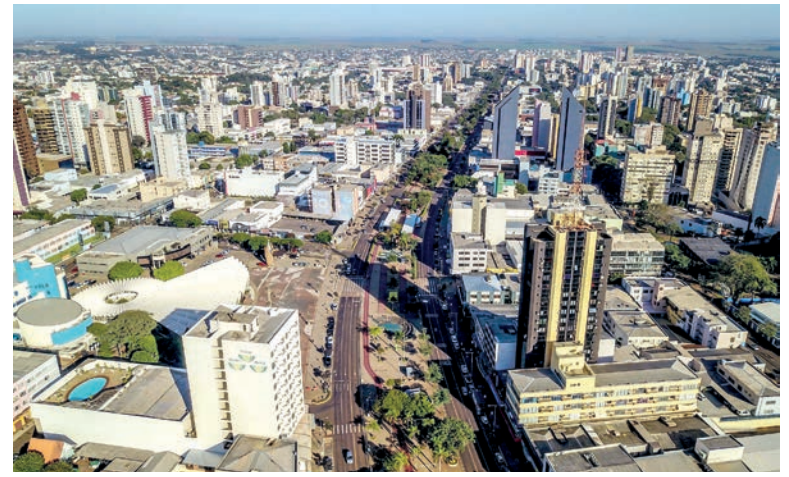
Cascavel se mantém como a 5ª cidade mais populosa do Estado

Londrina é também a segunda maior cidade do Estado, com 577.318 pessoas, única paranaense a figurar na lista de municípios com mais de 500 mil habitantes ocupando a 17ª posição nacional. Ela é seguida por Maringá com