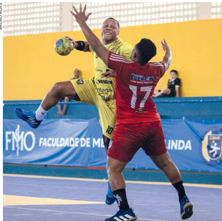
Cascavel Handebol segue invicto no Brasileiro de Clubes

jogam o Stein Futsal, Londrina, Maringá Seletto e Pato Branco. O outro quadrangular será disputado em Chopinzinho, com as donas da casa, Colombo, AFETO/Toledo e Guarapuava.