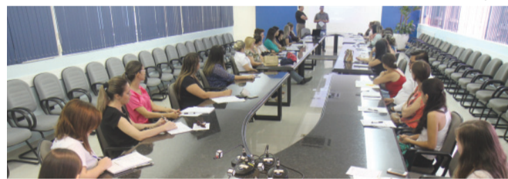
Colaboradores das empresas contábeis participaram de curso ministrado pelo Sescap-PR ontem em Cascavel