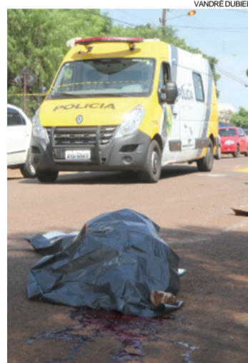
Homem de 36 anos foi assassinado no meio da rua, pouco antes do meio-dia