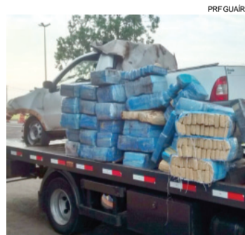
Veículo roubado em fevereiro transportava mais de 640 quilos de maconha

sendo levada para Dois Vizinhos, no Sudoeste do Estado. O motorista, de 32 anos, foi preso e encaminhado di-