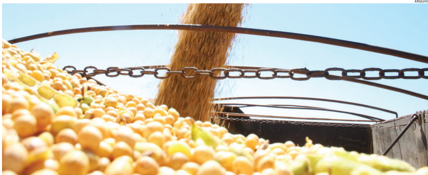
Agronegócio mantém a liderança nas exportações do Oeste: complexo soja é um dos destaques