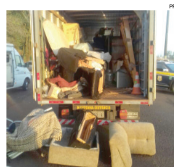
Caminhão que levava mudança escondia 520 quilos do entorpecente