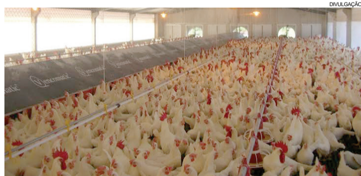
Ovos são produzidos em granjas em Itirapina, interior de São Paulo

As granjas para a produção dos ovos especiais foram