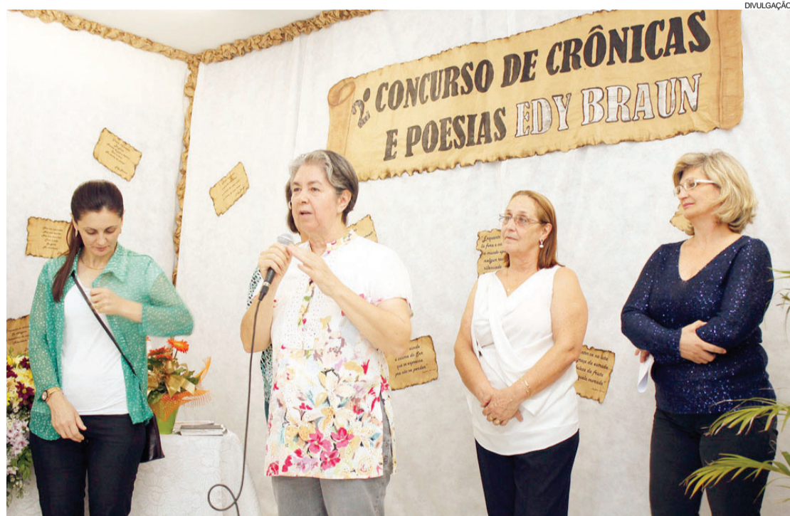
Poderão participar do concurso pessoas de todas as cidades do Oeste paranaense

(CERTI/Coopagro), na Rua Rodrigues Alves, 1224 – Jardim Coopagro, ou na Casa da Cultura, na Rua XV de Novembro, 1638 – Centro.