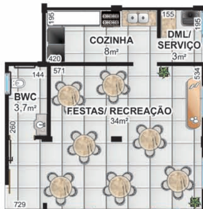
2 SALÕES DE FESTAS - 50m²

PRÓXIMO: Shopping JL UNIPAR e CEEP Irani Supermercado Clube Comercial Hiper Muffatto Rodoviária Prefeitura