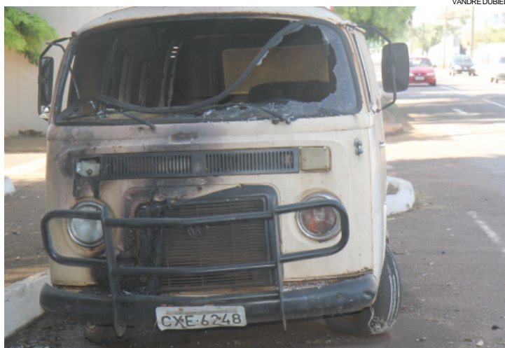
Kombi estava estacionada na Rua Jacarandá quando foi incendiada

No fim de março, uma onda de atentados assustou a população cascavelense. Cinco ônibus e um carro foram incendiados como forma de represália à morte de dois jovens em confronto com a polícia. A polícia já descartou que os incêndios de ontem tenham relação com os ataques do mês passado. O caso é investigado pelo GDE (Grupo de Diligências Especiais) da Polícia Civil.