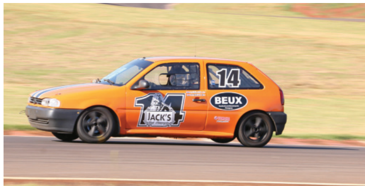
Marcelo Beux é um dos cascavelenses em ascensão no automobilismo