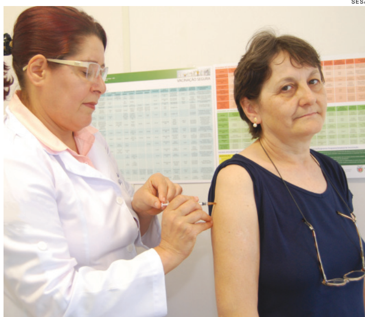
Grupos prioritários podem procurar uma unidade de saúde a partir de amanhã

Para se proteger, a indicação é a prevenção. Tomar a vacina, lavar sempre as mãos com água e sabão e andar com álcool gel. Também é importante deixar os ambientes ventilados.