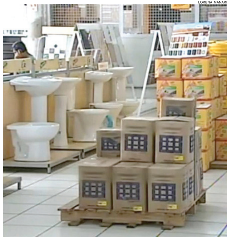
Movimento menor é sinônimo da crise econômica e do receio dos consumidores de comprometerem suas rendas

É muito fácil fretar um ônibus padrão Princesa dos Campos