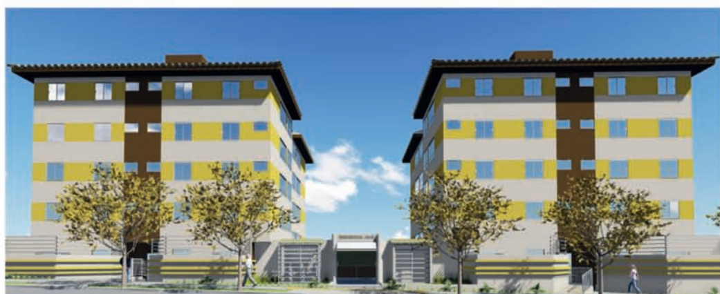
CONDOMÍNIO RESIDENCIAL JAUÁ