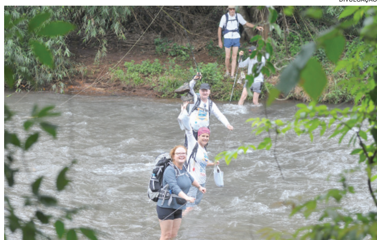
Trajeto inclui belas paisagens da natureza e travessia pelo rio

nham 13 km, junto de um grupo de moradores de Boa Vista, até a prainha das Marinas, onde a missão é encerrada.