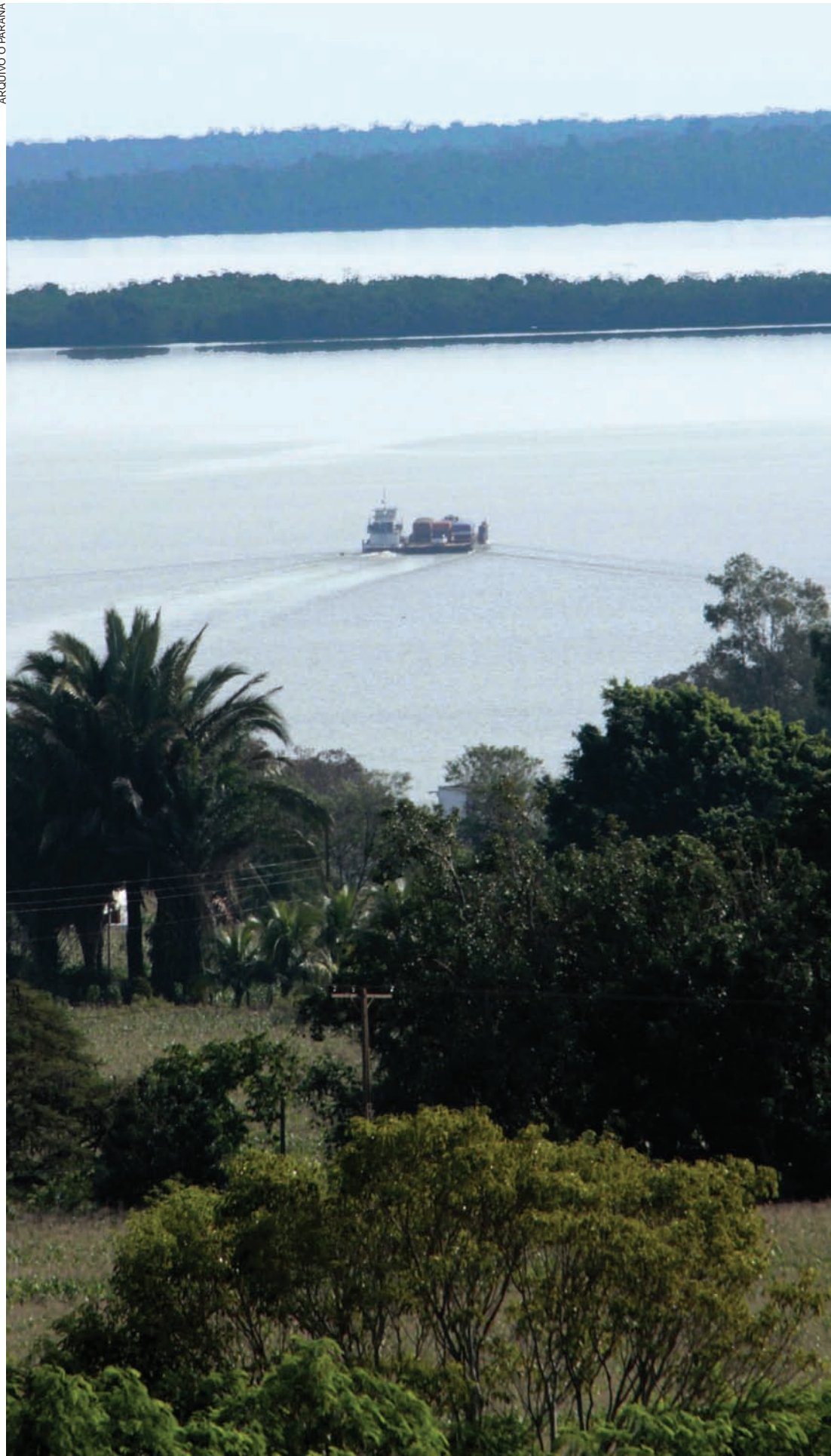
ARQUIVO O PARANÁ

Cinco anos depois de iniciar uma série de reportagens sobre o contrabando, o tráfico e o descaminho, O Paraná voltou a campo e constatou que pouco mudou de lá para cá. Quadrilhas movimentam milhões todos os dias com o contrabando principalmente de cigarros, administram algo em torno de 200 portos clandestinos, utilizam-se de lanchas e carros potentes e migram para o Sudoeste do Estado quando a fiscalização é intensificada no Oeste. Oeste 11