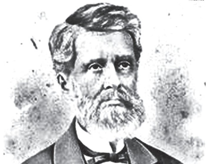
Carneiro de Campos: natural da Bahia, deputado por São Paulo

Deputado paulista Carneiro de Campos apresenta na Assembleia Geral Legislativa do Império projeto criando a Província de Curitiba (futura Província do Paraná).