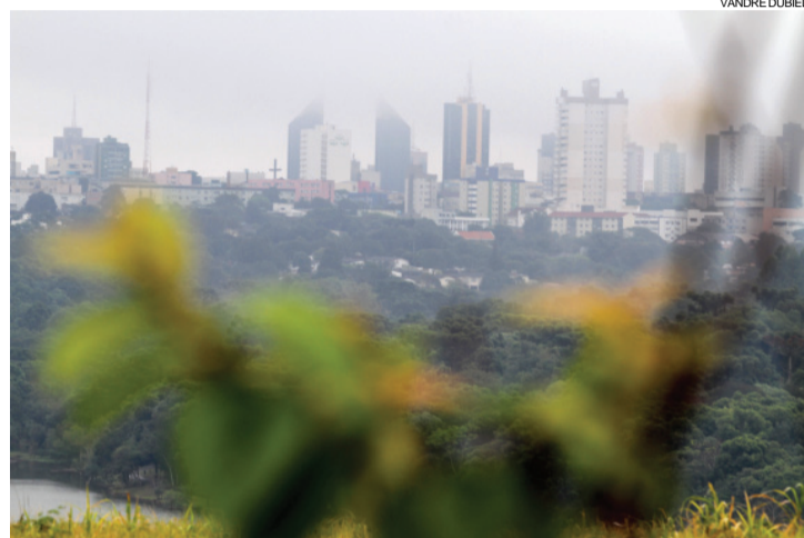
Com a mudança do tempo, ontem, em Cascavel, e neblina encobriu parte dos prédios da cidade