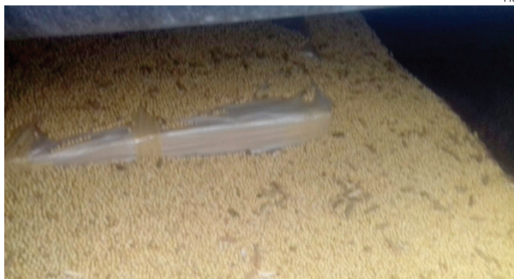
A carga de soja era usada para esconder a maconha

O motorista, um homem de 42 anos, disse aos policiais que receberia R$ 10 mil para levar o caminhão com o entorpecente até São José dos Pinhais, na região Metropolitana de Curitiba, o deixá-lo em um posto de combustíveis.