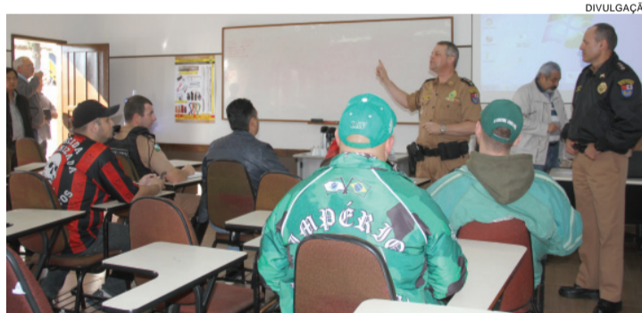
PM e torcidas acertaram detalhes durante reunião

e danos durante o jogo. Atuaremos com muita firmeza e determinação, antes da partida e também após o encerramento”, garante.