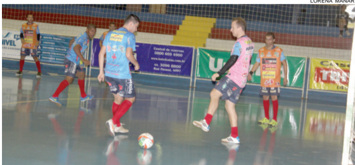
Cascavel vai buscar uma vitória para engrenar no Estadual

O comandante cascavelense não poderá contar com Deilton, Caça, Cadini e Wanderson, que estão no departamento médico.