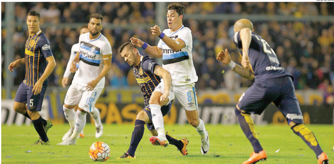
Derrota para o Rosario culminou na eliminação do Grêmio na Libertadores

"Não vou dizer que nossos atletas que não tiveram dedicação: houve sim, mas o adversário foi melhor. Claro que uma eliminação dessas dói, ela é pesada, foi a nossa terceira eliminação no ano. Estamos entrando no mês em que vai começar o Campeonato Brasileiro, porque o ano não acabou", concluiu.