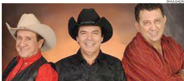
O Trio Parada Dura é um dos mais tradicionais da música sertaneja no Brasil. Músicos subirão ao palco depois das 22h

As atrações musicais da feira sobem ao palco do Parque de Exposições depois das 22h. Não há cobrança de in-