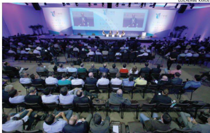
Painel com líderes e o governador de São Paulo, Geraldo Alckmin: Enic reuniu mais de mil de pessoas de quarta-feira a ontem

Alckmin fez um balanço das Parcerias Público-Privadas e Concessões do governo paulista, que somam R$ 100 bilhões em investimentos. Na PPP de Habitação Popular serão entregues, até o fim do ano, os primeiros blocos de apartamentos. São 3.683 unidades habitacionais, dessas, 2.260 de interesse social (HIS) e 1.423 de mercado popular.