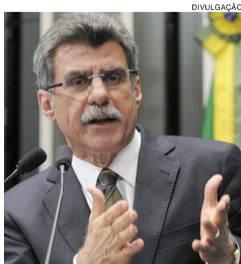
Ministro Romero Jucá, do Planejamento

a economia que o governo pretende fazer com a redução de 4 mil cargos comissionados será anunciada “no momento certo”, em razão das diferentes remunerações.