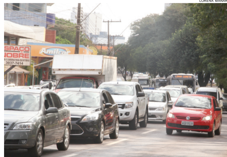
Cascavel tem mais de 40 mil veículos com o IPVA atrasado

Mais informações podem ser obtidas na Uopecan, fone 45-2101.7022.