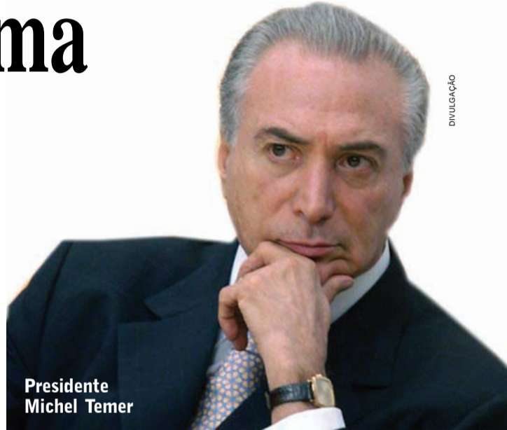
Presidente Michel Temer

Já estava havendo redução e cortes em programas sociais na gestão da petista, como Minha Casa, Minha Vida e Pronatec.