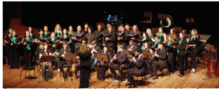
Integrantes do Coral Municipal irão se revezar em vários números