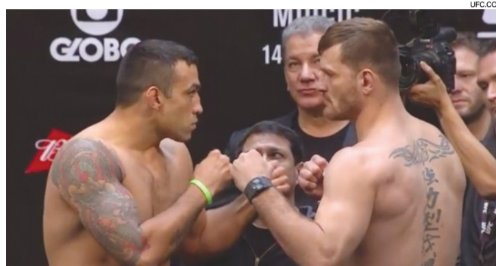
Fabricio Werdum e Stipe Miocic farão o duelo principal da noite

uma cirurgia quinta-feira. O ex-campeão dos Médios enfrentaria Uriah Hall. A luta marcaria o retorno do Spider ao octógono após a derrota para Michael Bisping em fevereiro, em Londres.