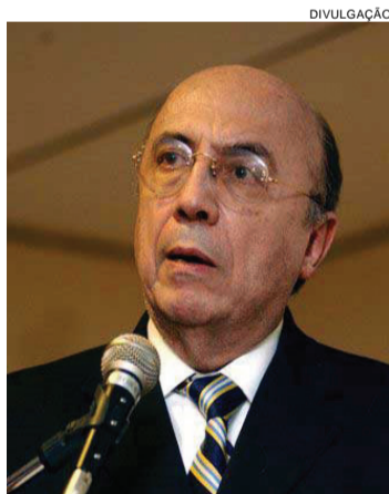
Ministro Henrique Meirelles

blica e seu crescimento a níveis sustentáveis. Um novo imposto será temporário. Se for necessário”, declarou.