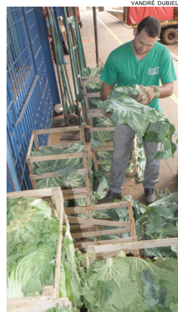
Mudança nas refeições em dias frios diminui venda de hortaliças e frutas na Ceasa