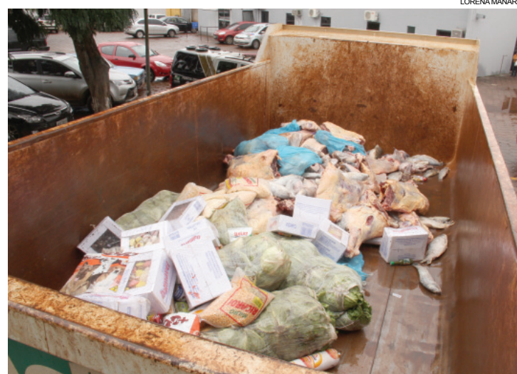
Além de carne, foram apreendidos produtos como doces e verduras