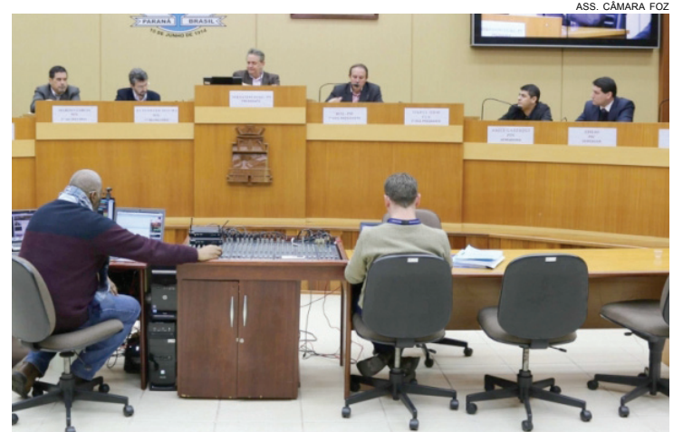
Dois dos três depoimentos previstos para ontem foram colhidos

CASSAÇÃO Vitorassi também deixou claro que a CPI Pecúlio está agindo com todo rigor necessário e que o caso poderá não se esgotar com o término da investigação feita por ela. Segundo ele, se restar comprovado que um esquema criminoso funcionava no âmbito da administração, será proposta a instauração de uma Comissão Processante para cassar o mandato do prefeito Reni Pereira.