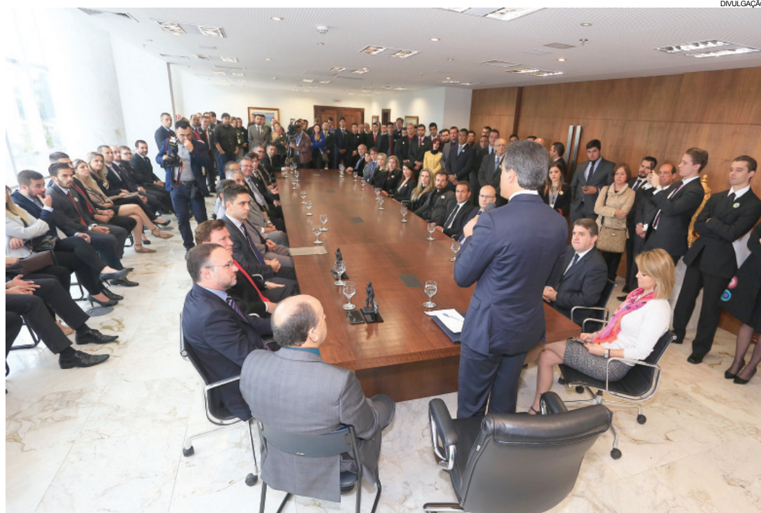
Novos delegados irão reforçar 50 comarcas do interior e unidades especializadas