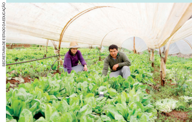
Alimentos da agricultura familiar são encaminhados semanalmente às escolas

INVESTIMENTO - O investimento com a aquisição de gêneros alimentícios para suprimento do Programa Estadual de Alimentação Escolar no período de 2011/2016 chegará a R$ 605 milhões, sendo R$ 143,8 milhões destinados às cooperativas e associações no fornecimento de gêneros da agricultura familiar. Até 2010, o Governo do Estado investia R$ 3 milhões na aquisição de merenda da agricultura familiar. Hoje chega a R$ 38 milhões.