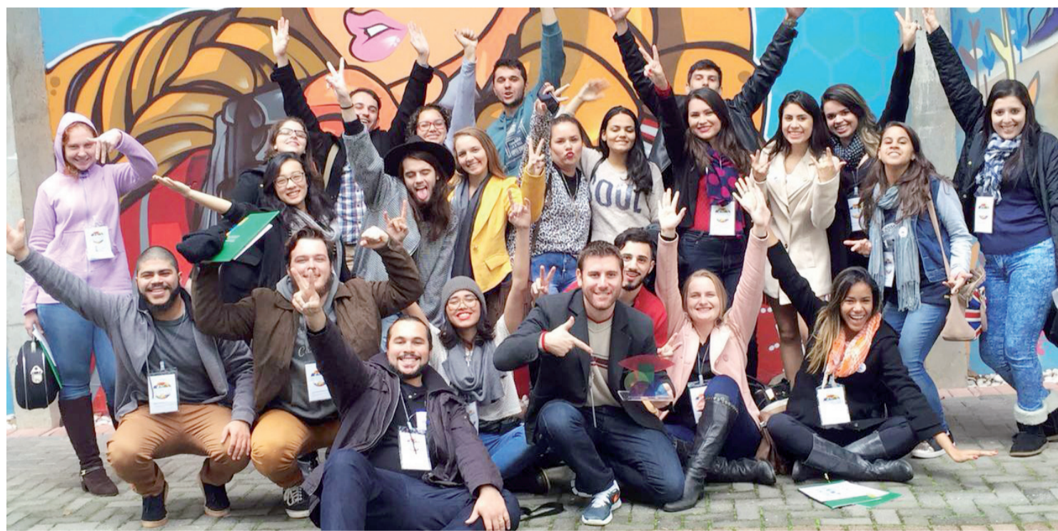
O Centro FAG esteve representado no Intercom Sul por docentes e alunos de Publicidade e Jornalismo

alunas irão disputar o prêmio nacional junto aos outros vencedores de cada região em setembro, na Universidade de São Paulo - USP.