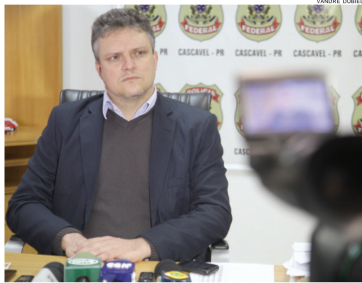
Mochi: Laudos são necessários para que polícia conclua o inquérito

Além de sanar eventuais dúvidas, os laudos são necessários para que a Polícia Federal conclua o inquérito. A PF aguarda também o resul-