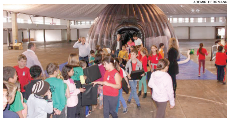
Alunos da rede municipal participam do projeto Planetário na Escola

O projeto dissemina o ensino da astronomia que é trabalhado na disciplina de ciências da natureza. Alunos e professores têm a oportunidade de ver o céu estrelado com imagens e sons adequados que oferecem inúmeros efeitos sensoriais especiais, mostra a constituição do dia e da noite, os movimentos da