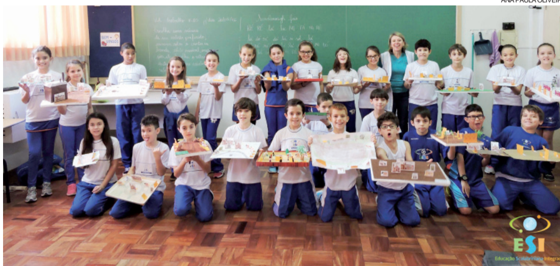
Turma do 5º ano A do ESI Auxiliadora em dia de apresentação da maquete de uma Vila Operária