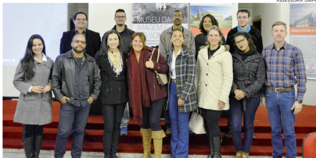
Professores e organizadores do evento posam para foto