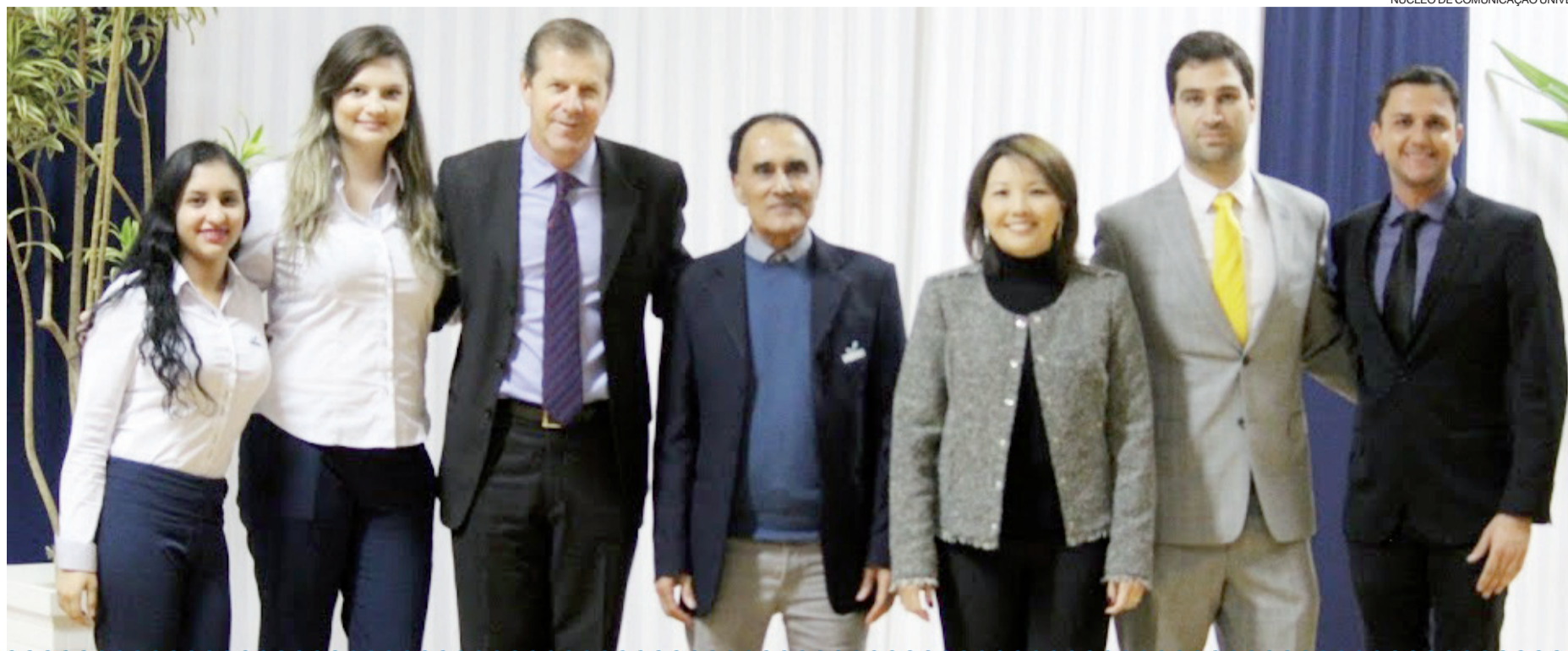
Equipe da Univel na solenidade de formatura coletiva dos cursos de pós-graduação