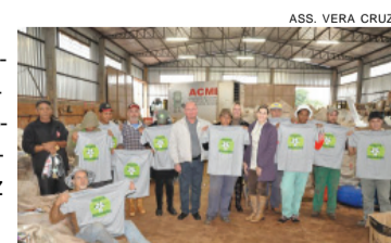
ASS. VERA CRUZ

Acaba de ser feita a entrega de novos uniformes e equipamentos de proteção individual aos trabalhadores da Associação dos Catadores de Material Reciclável de Vera Cruz do Oeste. A entrega contou com a presença do prefeito Eldon Anschau e outros líderes. Atualmente, a associação conta com 13 catadores e um motorista. Cada um recebeu dois pares de uniforme, composto por camiseta e calça, além de bota e luvas. As roupas foram doadas pela Itaipu e as botas foram adquiridas pela prefeitura.