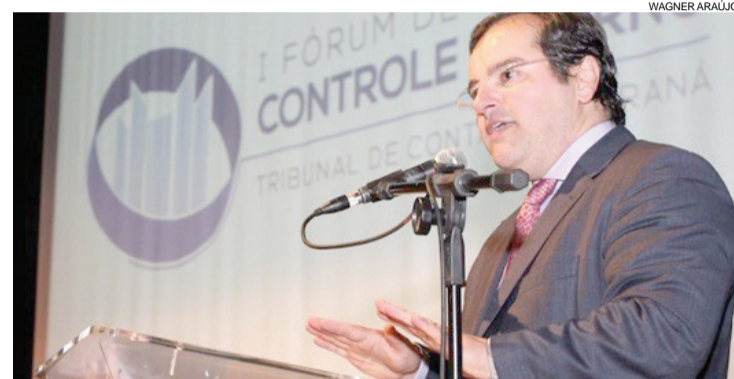
O presidente Ivan Bonilha destacou as atribuições da corte de contas

tão de destacar o trabalho da Escola de Gestão Pública, unidade de educação própria do Tribunal que capacitou 12 mil gestores e servidores de todo o Paraná em 120 cursos presenciais e via internet ao longo do ano passado e outros quatro mil neste ano.