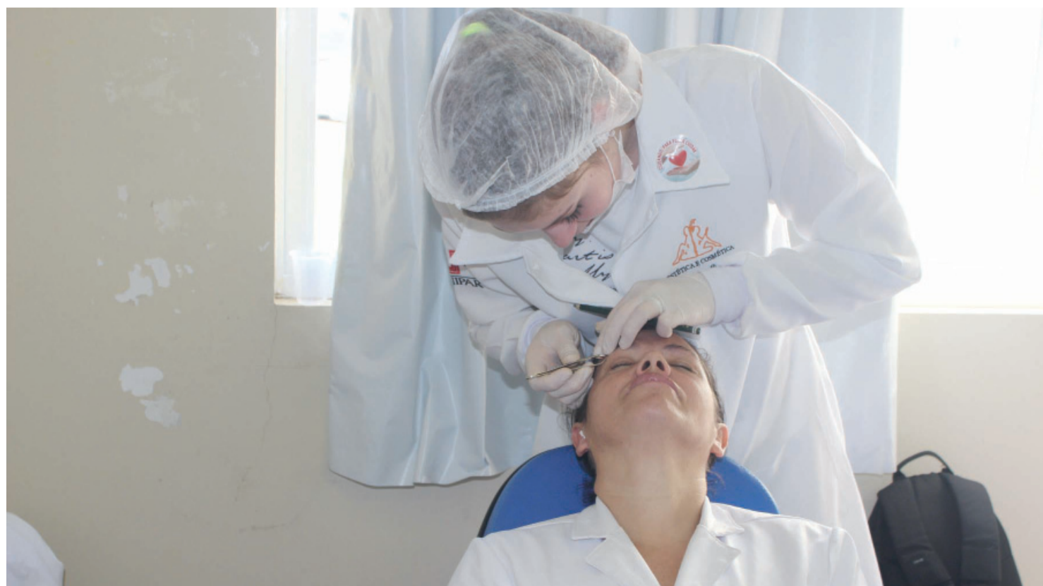
Modelagem de sobrancelha foi um dos serviços oferecidos