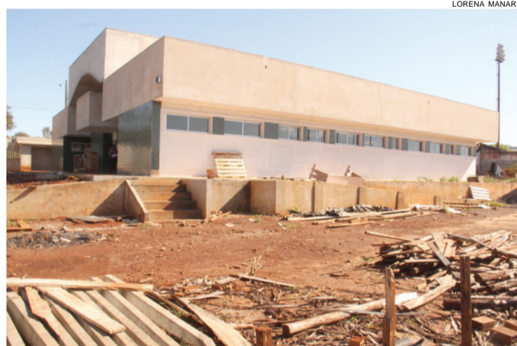
Obras paralisadas há oito meses devem ser retomadas em julho