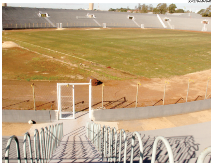
Os 14 portões antipânico estão prontos, mas oito deles ainda precisam de corrimão nas arquibancadas

Internamente toda a estrutura já está pronta, com as paredes pintadas e no aguardo de receber os equipamentos de musculação (cada vestiário terá uma academia) e toda a louça dos vestiários. A grama sintética da sala de aquecimento dos vestiários já está no local, mas ainda não colocada. A área comum aos times, na saída dos vestiários para o campo, e o túnel de acesso ao gramado também estão concluídos, bem como as cabines de imprensa, que ganharam janelas novas, mas que ainda precisam ser pintadas. O foço do elevador que levará às cabines de imprensa também está concluído e no aguardo da chegada do maquinário.