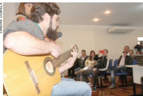
Pacientes do SIM-PR fizeram apresentações artísticas no evento