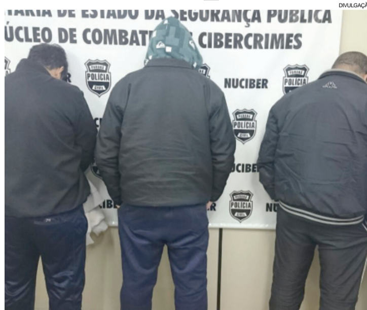
Suspeitos eram investigados há um ano pelo Nuciber

As investigações iniciaram há um ano, a partir de denúncia de órgãos de proteção à criança dando conta que menores vinham sendo alvos de abuso