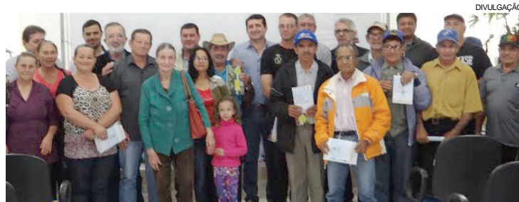
Líderes e famílias durante a solenidade de entrega das chaves

anuais de R$ 285. Segundo o prefeito Silvio de Souza, o município continuará a buscar mais famílias para efetuar os cadastros e beneficiar a população rural com moradias dignas fortalecendo a agricultura familiar.