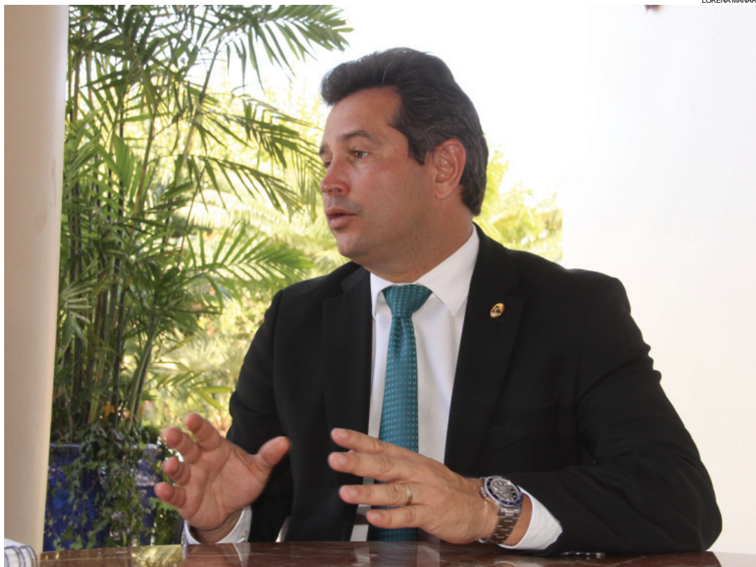
Ministro dos Transportes, Maurício Lessa, em visita a Cascavel: continuidade de duplicação é garantida

“São obras fundamentais que precisam continuar, e por isso não há risco de serem paralisadas. A duplicação acontece em uma rodovia que é de extrema importância para o Brasil, de impacto econômico muito grande e que permite uma integração nacional. É um empreendimento que está dentro das prioridades do ministério. Nosso principal objetivo é entregar obras”, diz Lessa. O empreendimento é o primeiro do País a utilizar um sistema de base e sub-base com uma camada de 24 centímetros de concreto, o que ga-