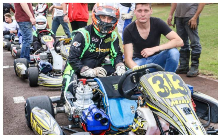
Lago planeja assumir a liderança da categoria Sênior

As disputas da categoria Cadete deverão ser das mais equilibradas