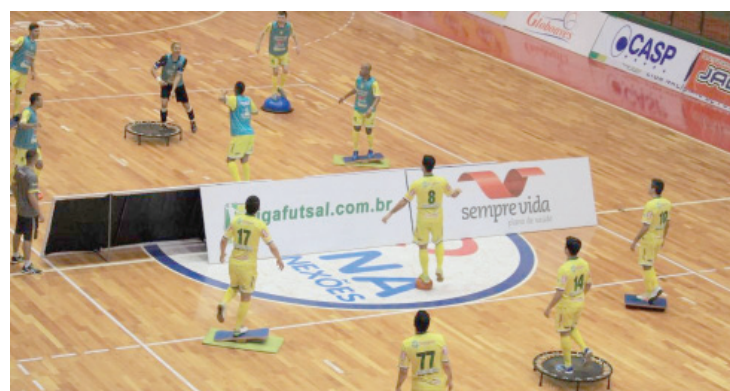
Folga de jogos não significa pausa nos treinamentos em Marechal

Foz Cataratas. Até lá, os ponta-grossenses já terão atuado mais uma vez, na segunda-feira, diante do Cascavel.