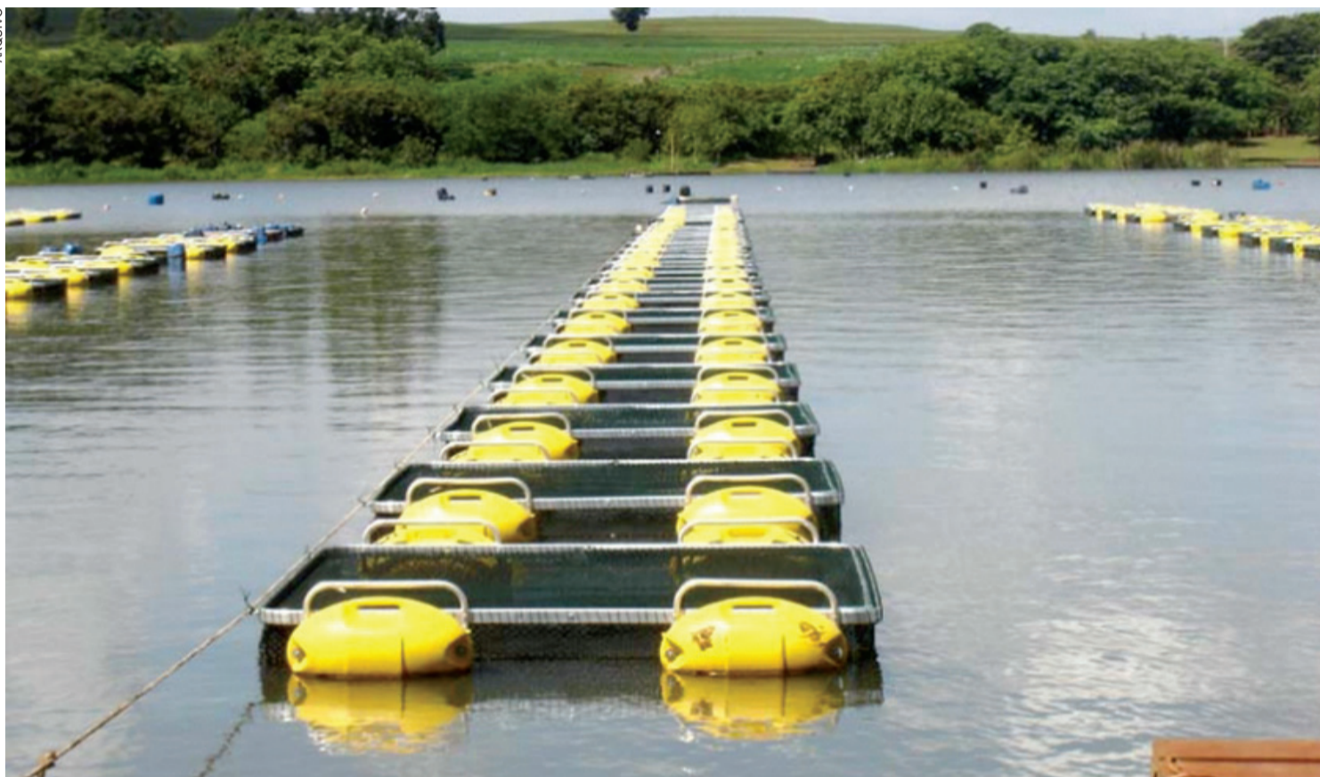
O programa de tanque-rede poderia transformar o Oeste do Paraná em força mundial na produção de peixes