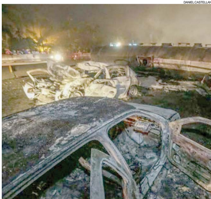
Acidente deixou quatro pessoas mortas e outras 15 feridas

menos 12 veículos que seguiram pela rodovia foram atingidos no acidente.