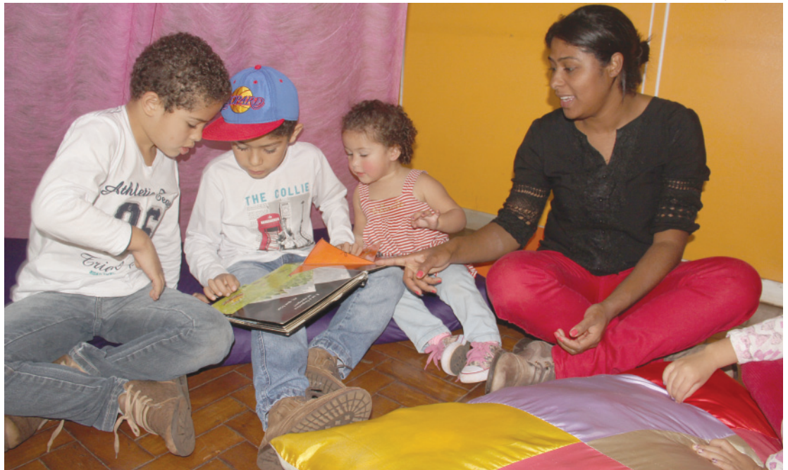
“Férias com Leitura” está entreterendo crianças com contação de histórias