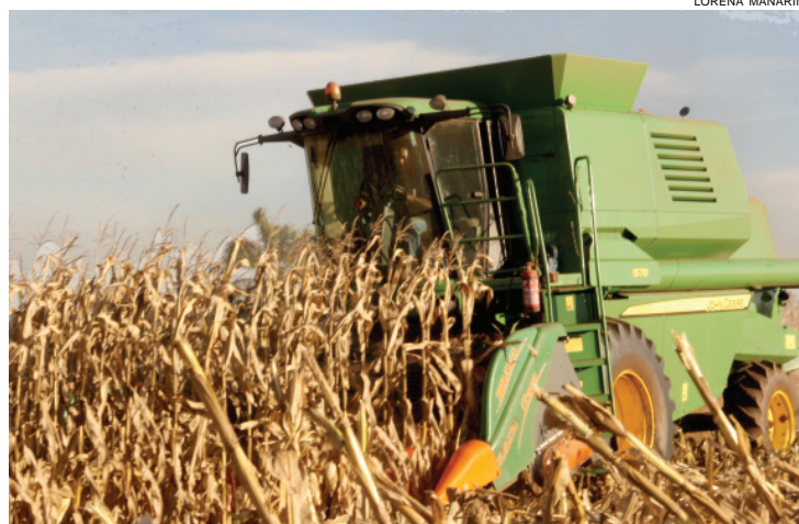
Produtores intensificam a colheita antes da chegada da chuva