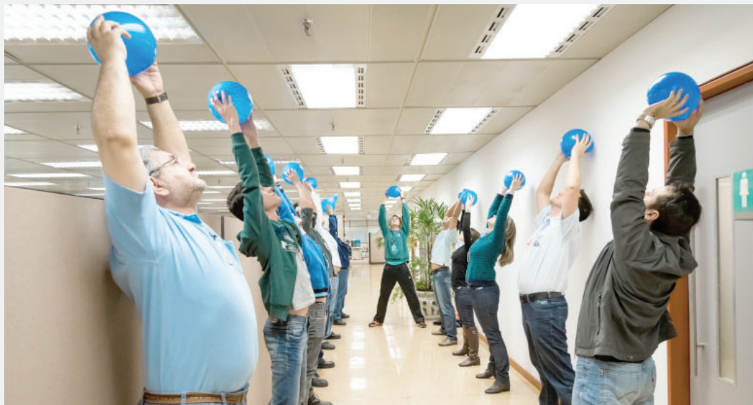
Funcionários foram envolvidos em atividades de orientação

atividades físicas com frequência e metade tem sobrepeso ou obesidade.