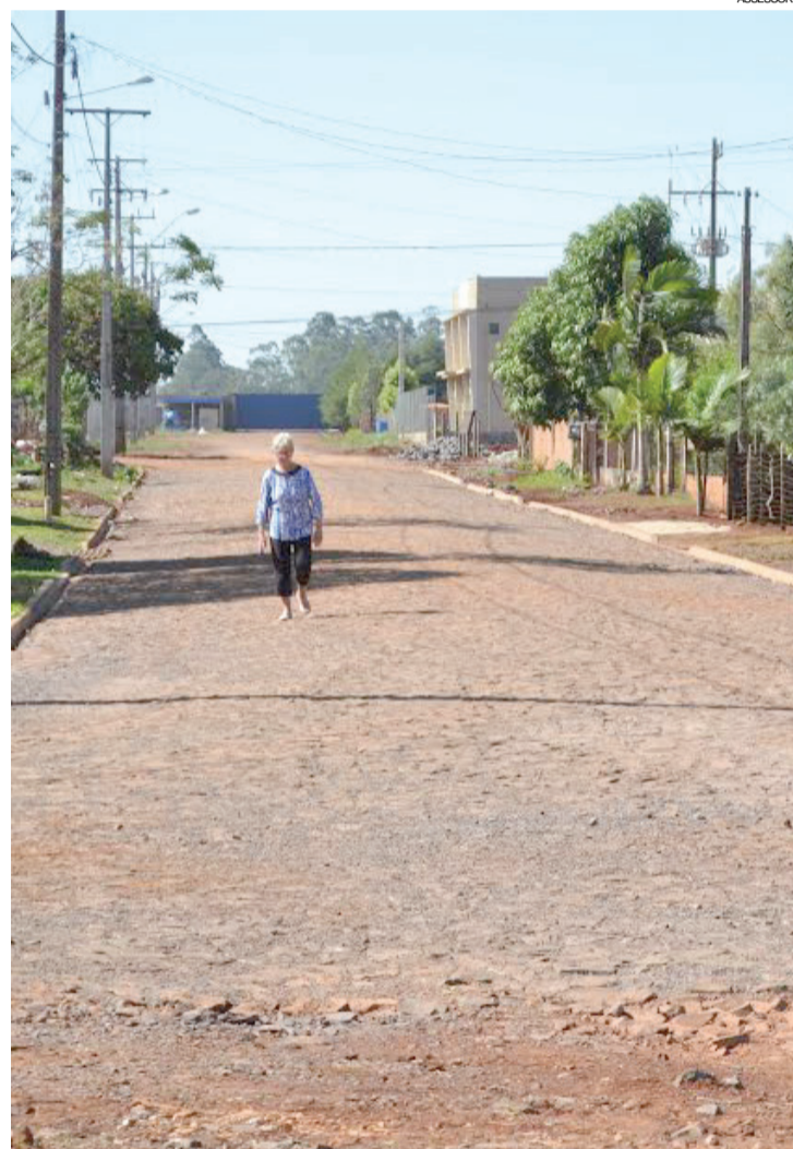
Distrito de Santa Maria: famílias ganham pavimentação

também dá atenção ao distrito de Santa Maria, que está às margens da BR-163, liga Cascavel ao Sudoeste do Paraná. Uma das obras é a pavimentação poliédrica das ruas Josefa Roberto Sampaio, Ortelina Aires da Silva e Onofre Guedes. São implantadas galerias de água pluvial, calçada de concreto, meio-fio, sinalização vertical, placas de trânsito e de sinalização. O custo dessa obra é de R$ 270 mil.