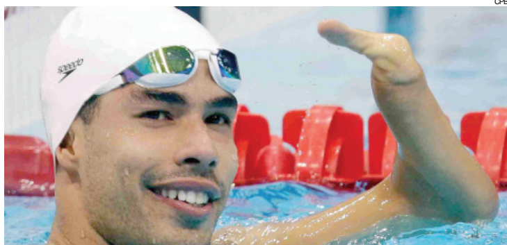
Daniel Dias é o maior medalhista do País, com 15 conquistas

do programa para Tóquio 2020 por não se enquadrarem nas regras do Comitê Paraolímpico Internacional - suas vagas serão ocupadas pelo badminton e pelo taekwondo.