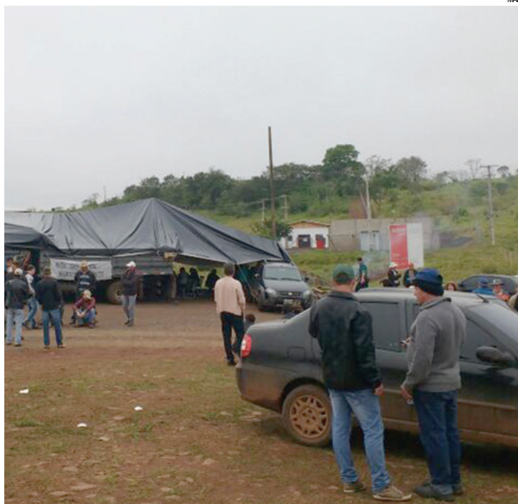
Atingidos montaram acampamento na madrugada de segunda-feira (5) e exigem acordo com consórcio sobre questões sociais