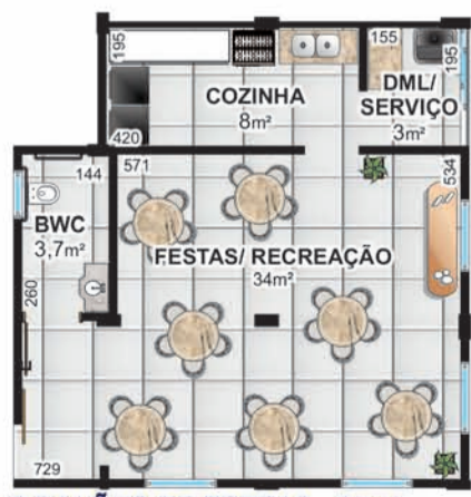
2 SALÕES DE FESTAS - 50m²

PRÓXIMO: Shopping JL UNIPAR e CEEP Irani Supermercado Clube Comercial Hiper Muffato Rodoviária Prefeitura