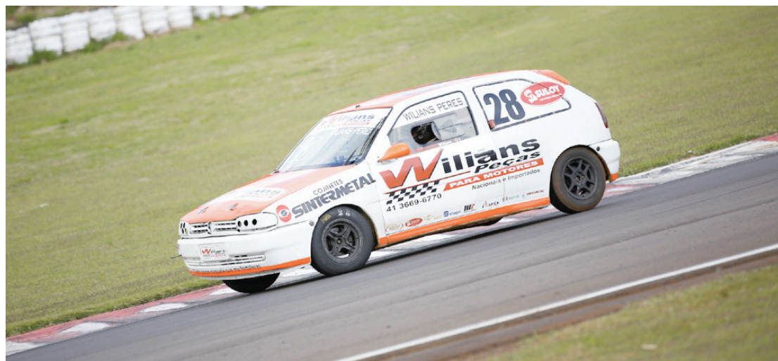
Wilians Peres se sagrou campeão da categoria Turismo ao fim de uma temporada fantástica