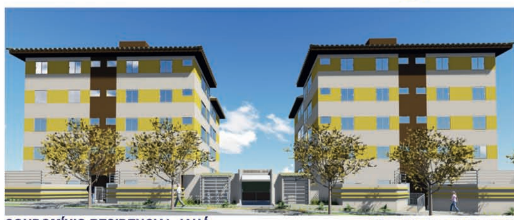
CONDOMÍNIO RESIDENCIAL JAUÁ 36 unidades residenciais

Pesquisa de Mercado PRÉ-LANÇAMENTO Rua Jaú