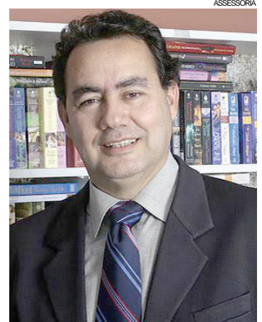
O médico e autor de livros de sucesso Augusto Cury, que estará em Cascavel na próxima segunda-feira

e cineasta Arnaldo Jabor, que falará sobre Projeto de um novo Brasil. E no dia 27, o tema Superando desafios com criatividade e inovação será apresentado pelo explorador Amyr Klink. Os patrocinadores do Conexão Empresarial 2016 são Ecocataratas, Gráfica Positiva, Funcional Consultoria, Sebrae, Sicoob Credicapital, Unimed e Sicredi. Outras informações podem ser conseguidas com a Uniacic pelo telefone 3321-1400, ou na própria associação comercial na rua Pernambuco, 1802.